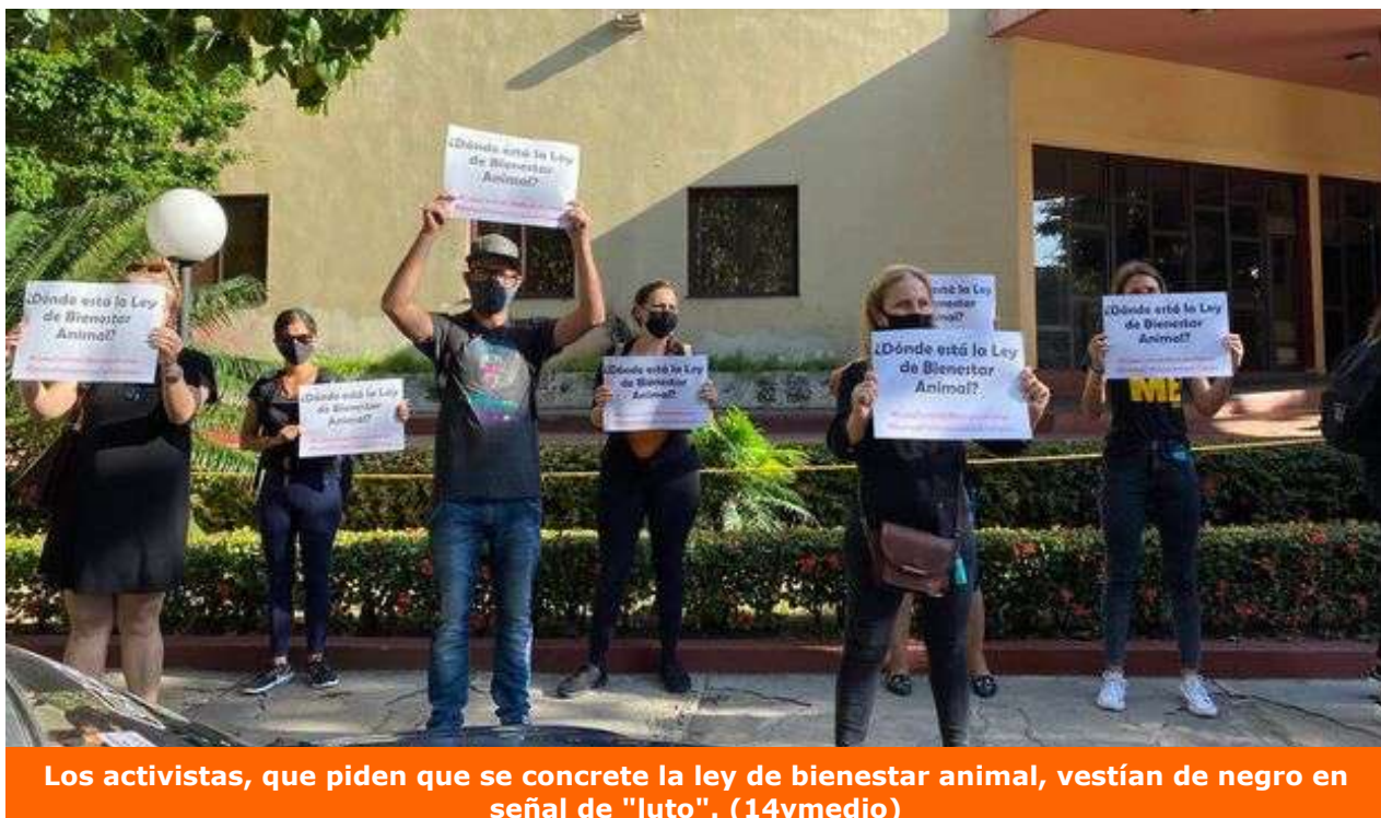
Los activistas, que piden que se concrete la ley de bienestar animal, vestían de negro en señal de "luto".