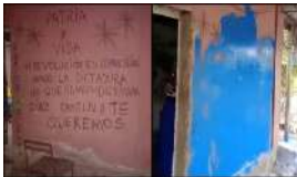
ACTO DE REPUDIO A UNA FAMILIA DE ACTIVISTAS