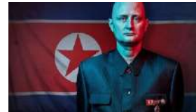
UN DANÉS INFILTRADO EN COREA DEL NORTE