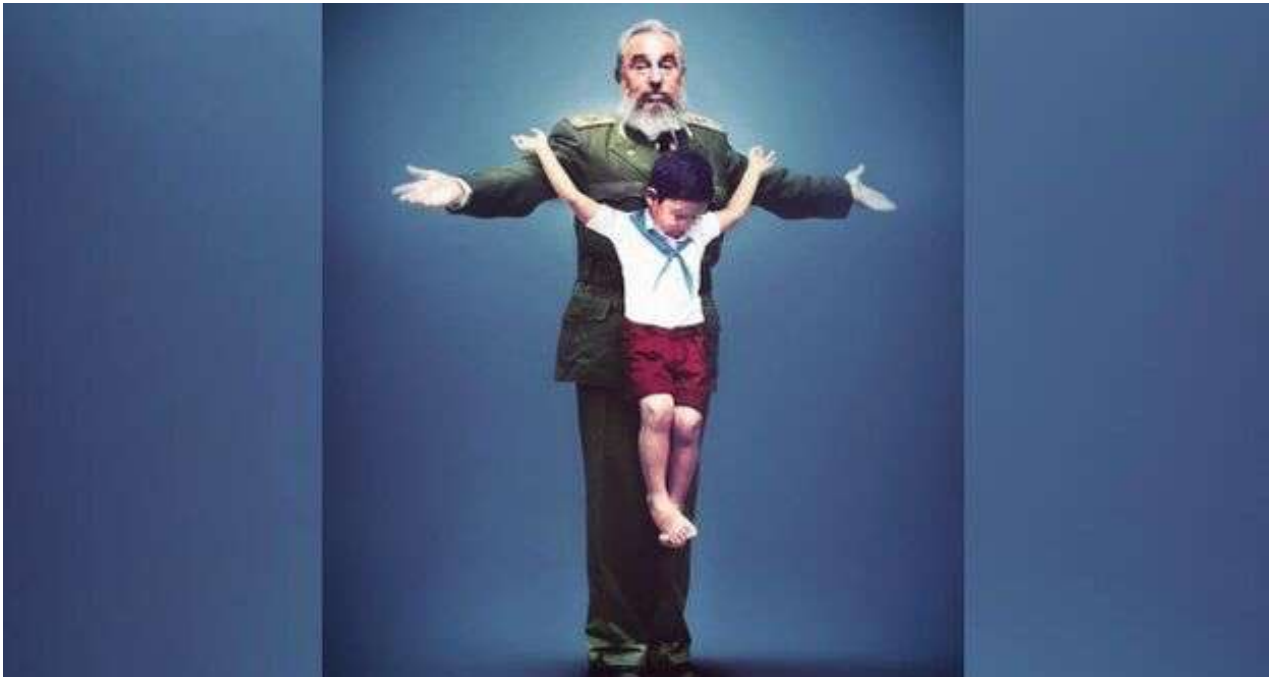
La obra Doctrina de Erik Ravelo, en la que contrapone una imagen de un niño uniformado en una cruz formada por los brazos de Fidel Castro. (Erik Ravelo/Facebook)