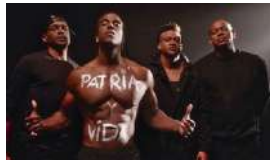
'PATRIA Y VIDA', EL HIMNO QUE LLAMA A LA RAZÓN