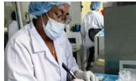
CUBA, ÚLTIMA EN VACUNAR EN EL CONTINENTE