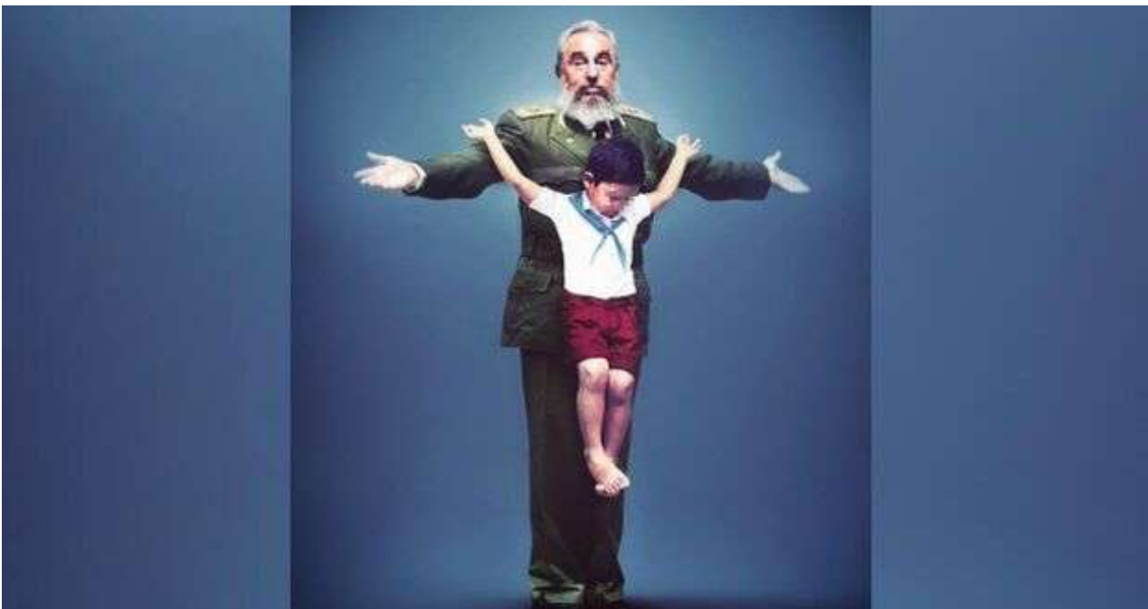
La obra Doctrina de Erik Ravelo, en la que contrapone una imagen de un niño uniformado en una cruz formada por los brazos de Fidel Castro. (Erik Ravelo/Facebook)

Una selección con lo mejor de la semana del primer diario independiente hecho en Cuba