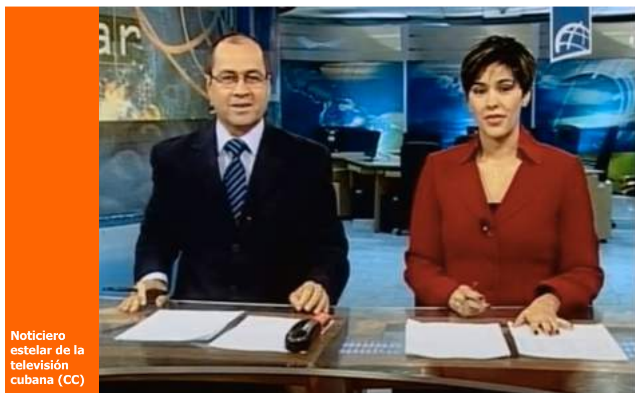
Noticiero estelar de la televisión cubana (CC)