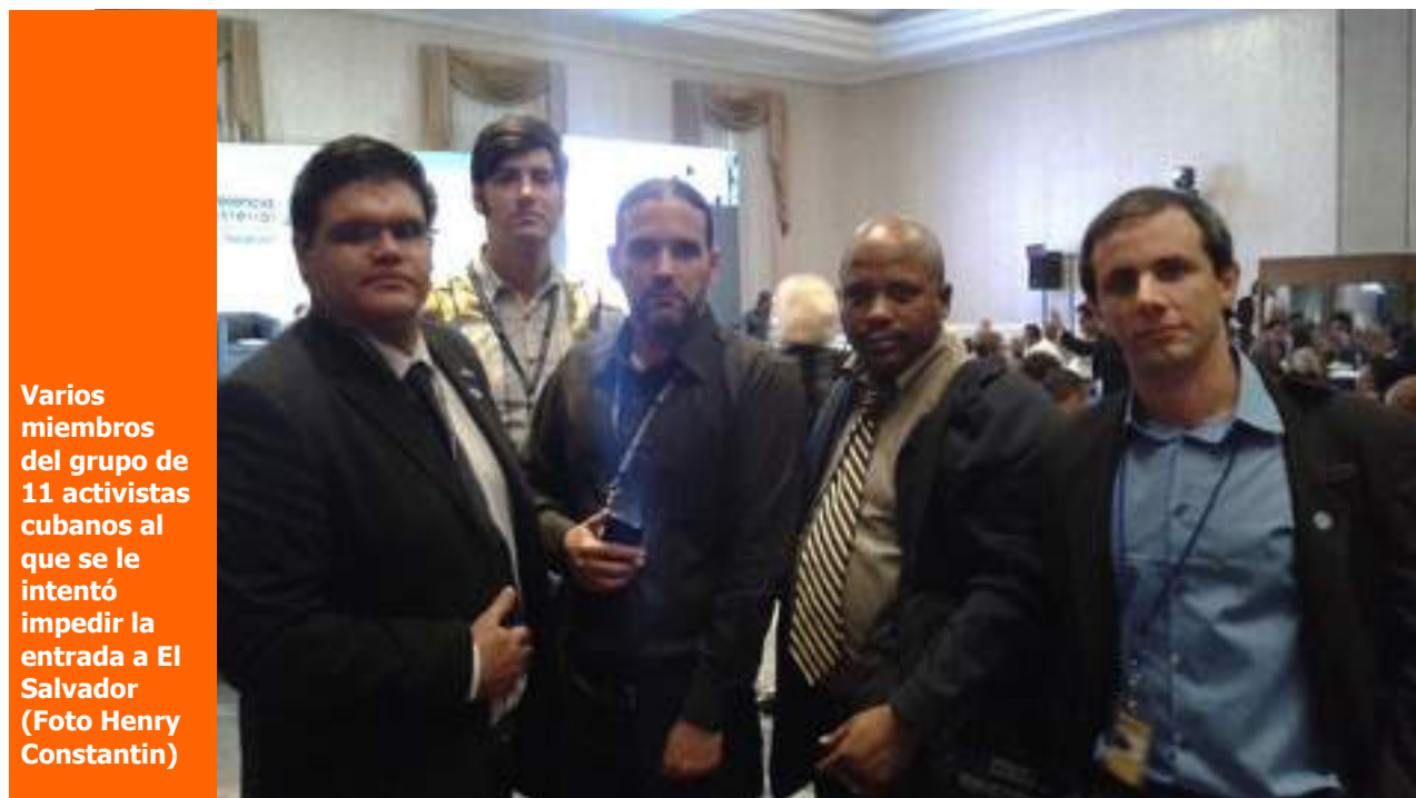
Varios miembros del grupo de 11 activistas cubanos al que se le intentó impedir la entrada a El Salvador