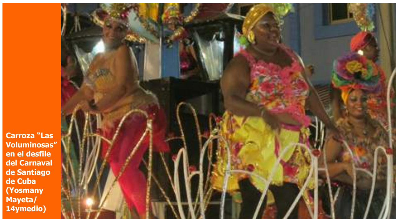
Carroza "Las Voluminosas" en el desfile del Carnaval de Santiago de Cuba