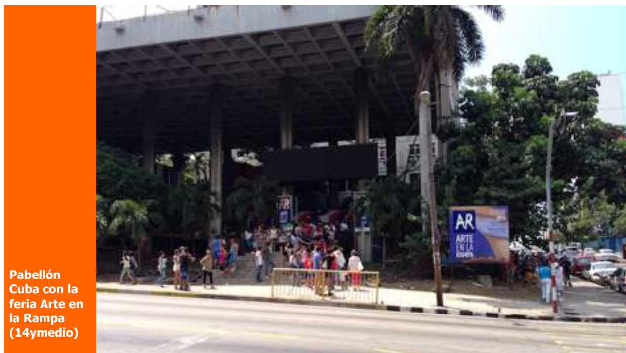
Pabellón Cuba con la feria Arte en la Rampa

Su cuerpo será expuesto durante la mañana de este martes y horas de la tarde en la funeraria de Calzada y K en el Vedado, La Habana.