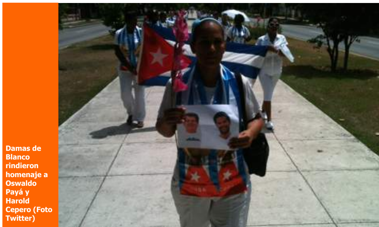
Damas de Blanco rindieron homenaje a Oswaldo Payá y Harold Cepero