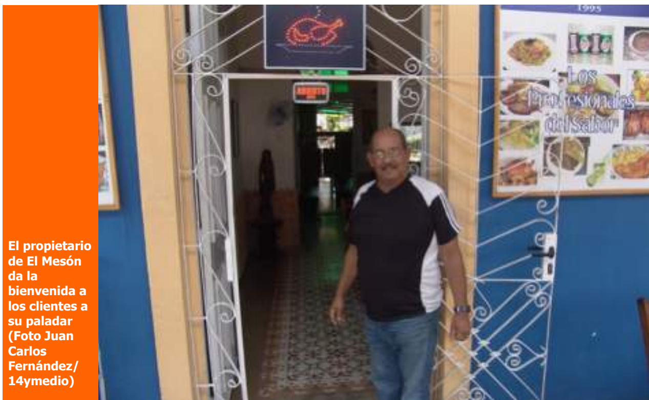
El propietario de El Mesón da la bienvenida a los clientes a su paladar