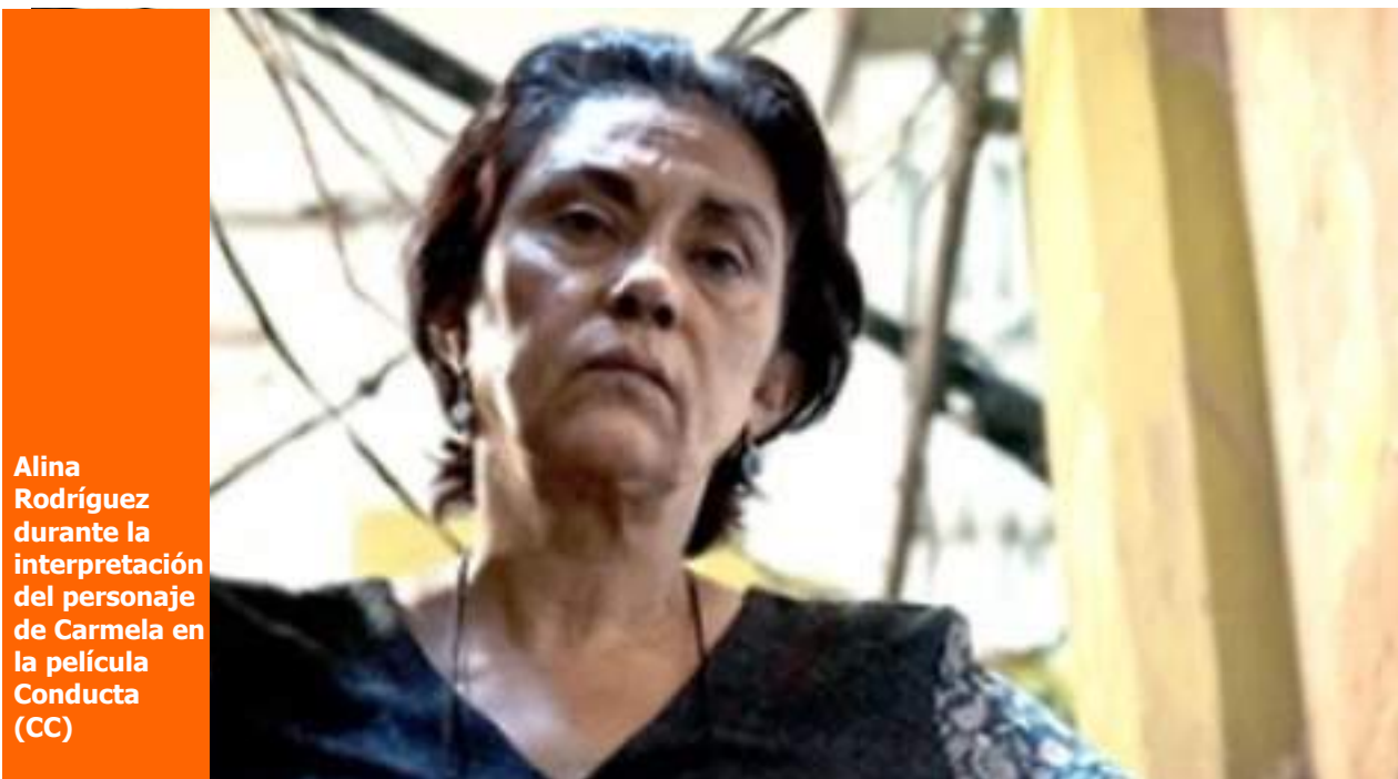
Alina Rodríguez durante la interpretación del personaje de Carmela en la película Conducta (CC)