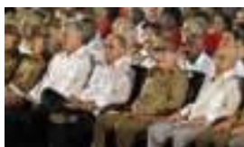
LA MISA REVOLUCIONARIA