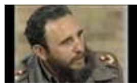
LA FALSA PROFECÍA DE FIDEL CASTRO