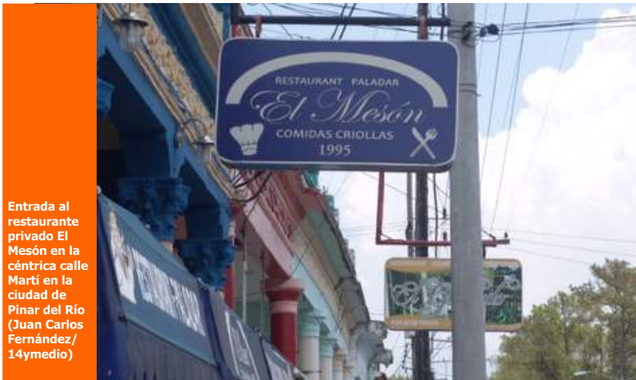
Entrada al restaurante privado El Mesón en la céntrica calle Martí en la ciudad de Pinar del Río