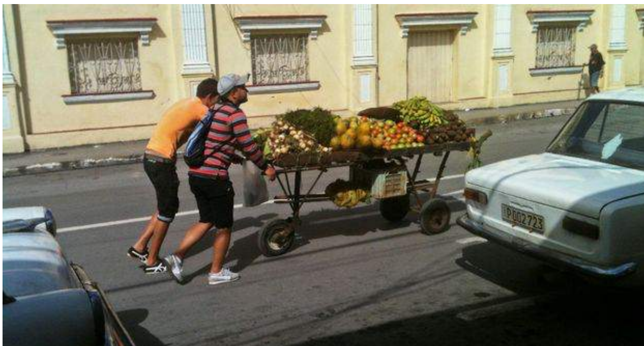
Dos carretilleros llevan sus productos por la calle Colón, a un costado del teatro Milanés en la ciudad de Pinar del Río.