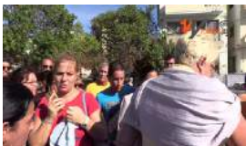
EE UU RESTRINGIRÁ LA EMISIÓN DE VISADOS EN CUBA