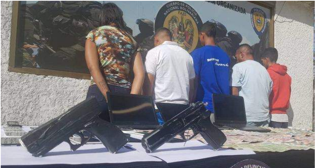
Miembros de la banda que presuntamente asaltó a la brigada médica cubana en Venezuela.