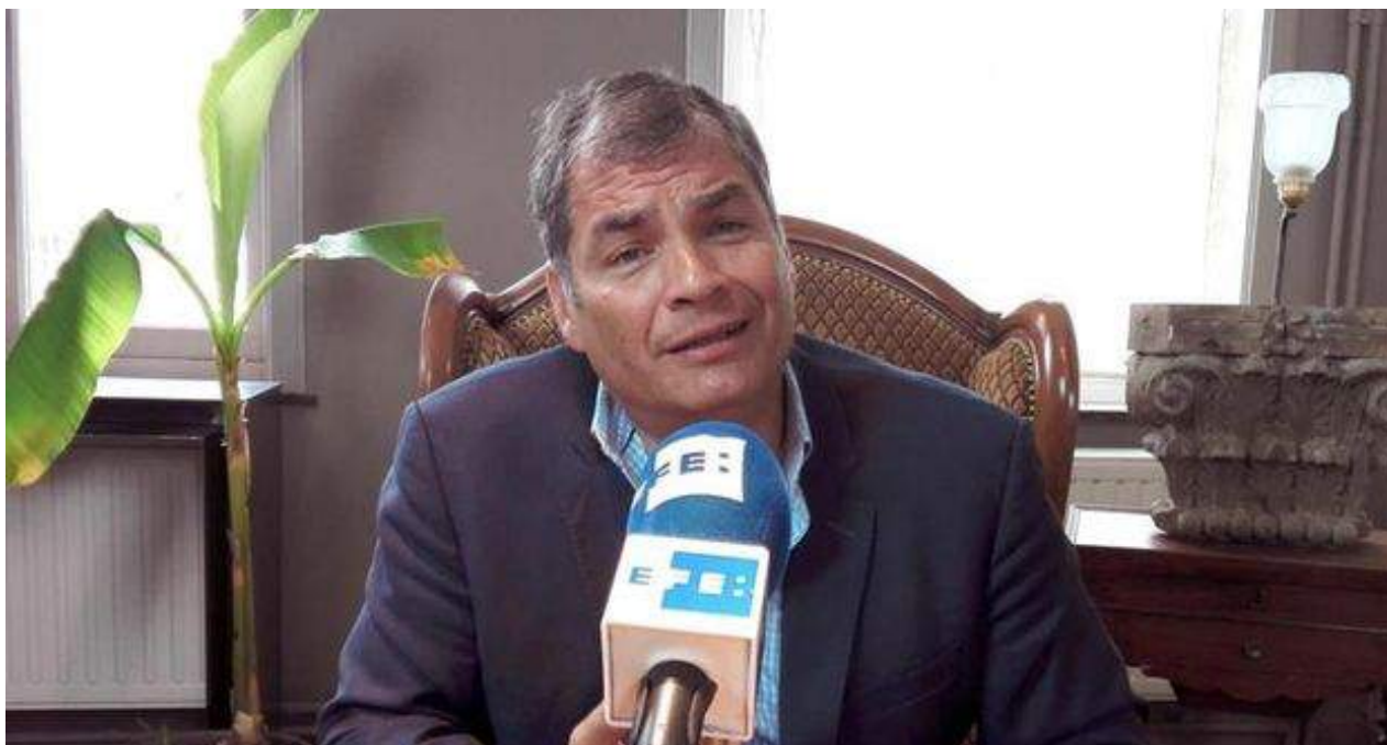
Rafael Correa reside en Bélgica, país del que es su esposa.