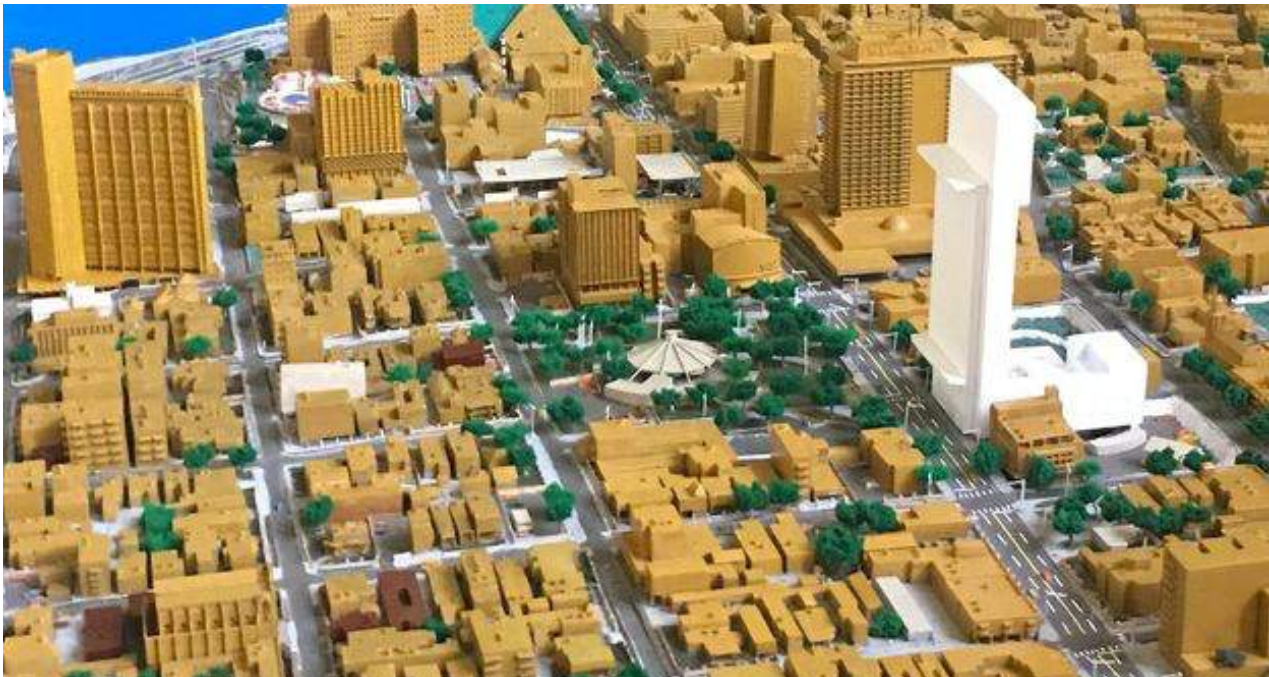
El edificio de 42 plantas proyectado en el Vedado habanero ya se encuentra en la maqueta.