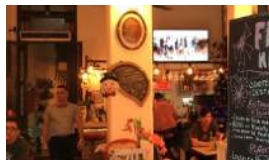
EL GOBIERNO REORDENA EL SECTOR PRIVADO