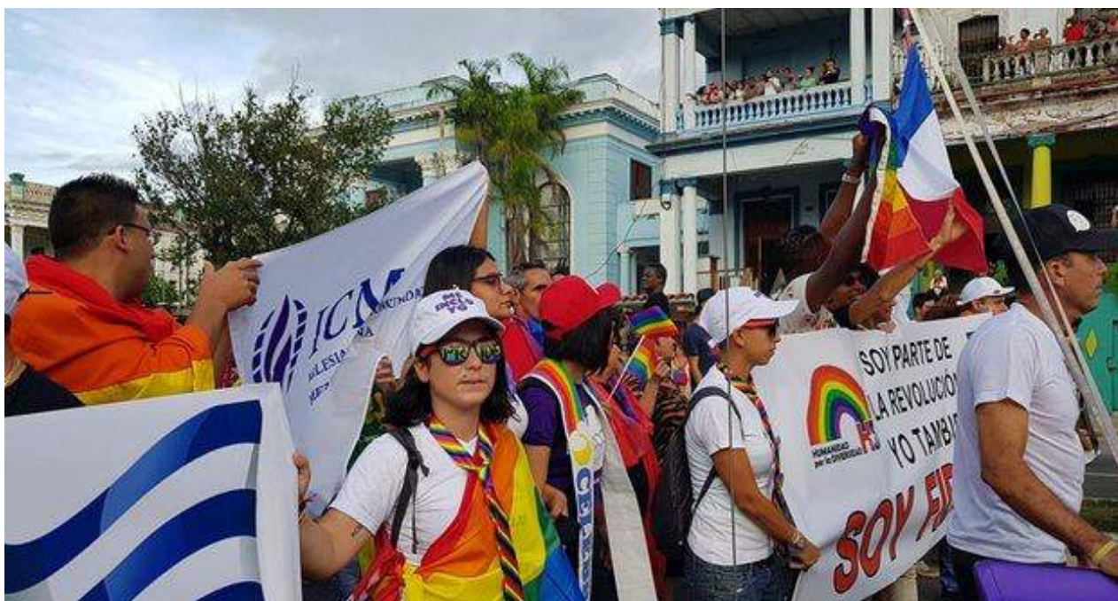
Miembros de la Iglesia de la Comunidad Metropolitana desfilan en la Conga contra la homofobia y la transfobia.