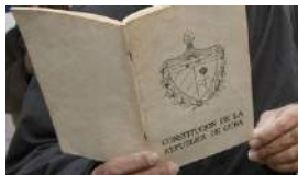
UNA CONSTITUCIÓN AJENA A LA TRANSPARENCIA