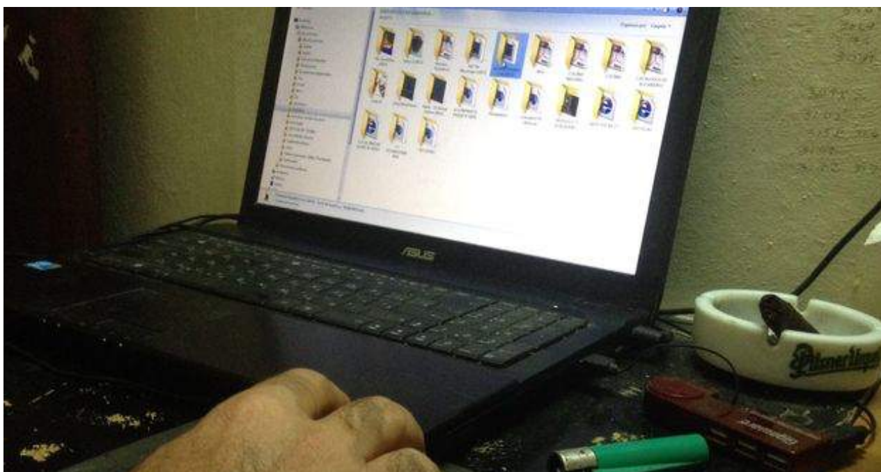
Los gestores del 'paquete' aseguran que 'El Señor de los Cielos' presenta material "difamatorio contra de los principios de nuestra Revolución cubana". (14ymedio)

Una selección con lo mejor de la semana del primer diario independiente hecho en Cuba