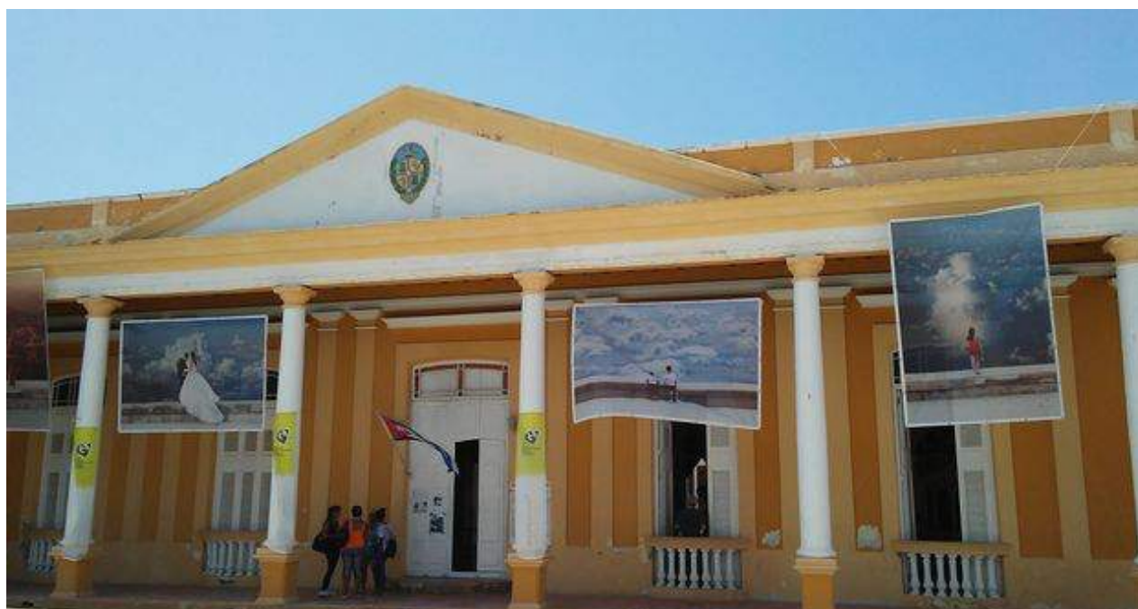
Casa de la Cultura de Gibara, en Holguín.