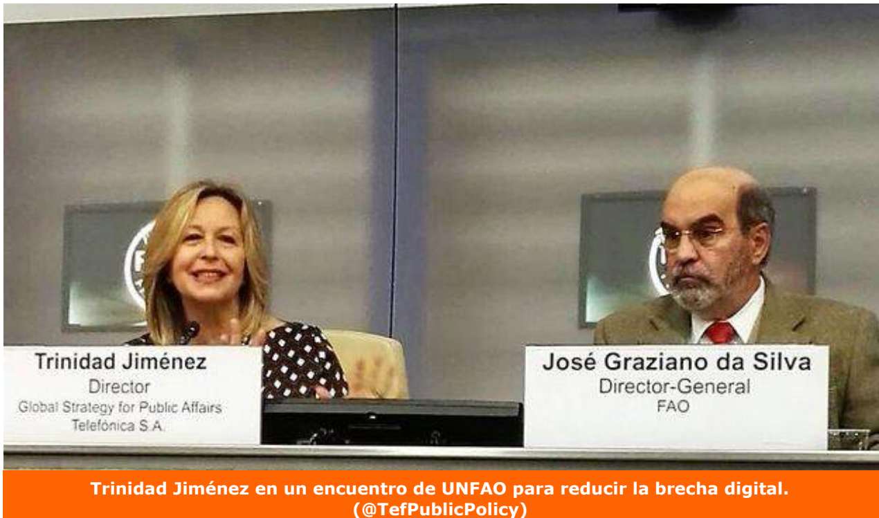
Trinidad Jiménez en un encuentro de UNFAO para reducir la brecha digital.