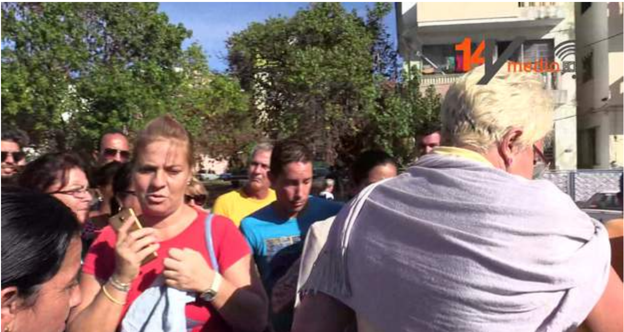
Solicitantes de visa cubanos a la entrada de la embajada de EE UU en La Habana.