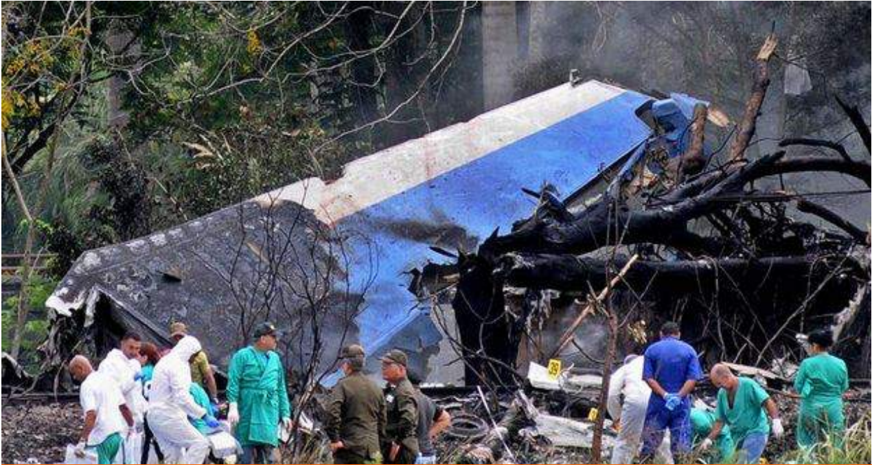
El avión, alquilado por Cubana de Aviación, se estrelló al despegar del aeropuerto de La Habana cuando se dirigía a Holguín.