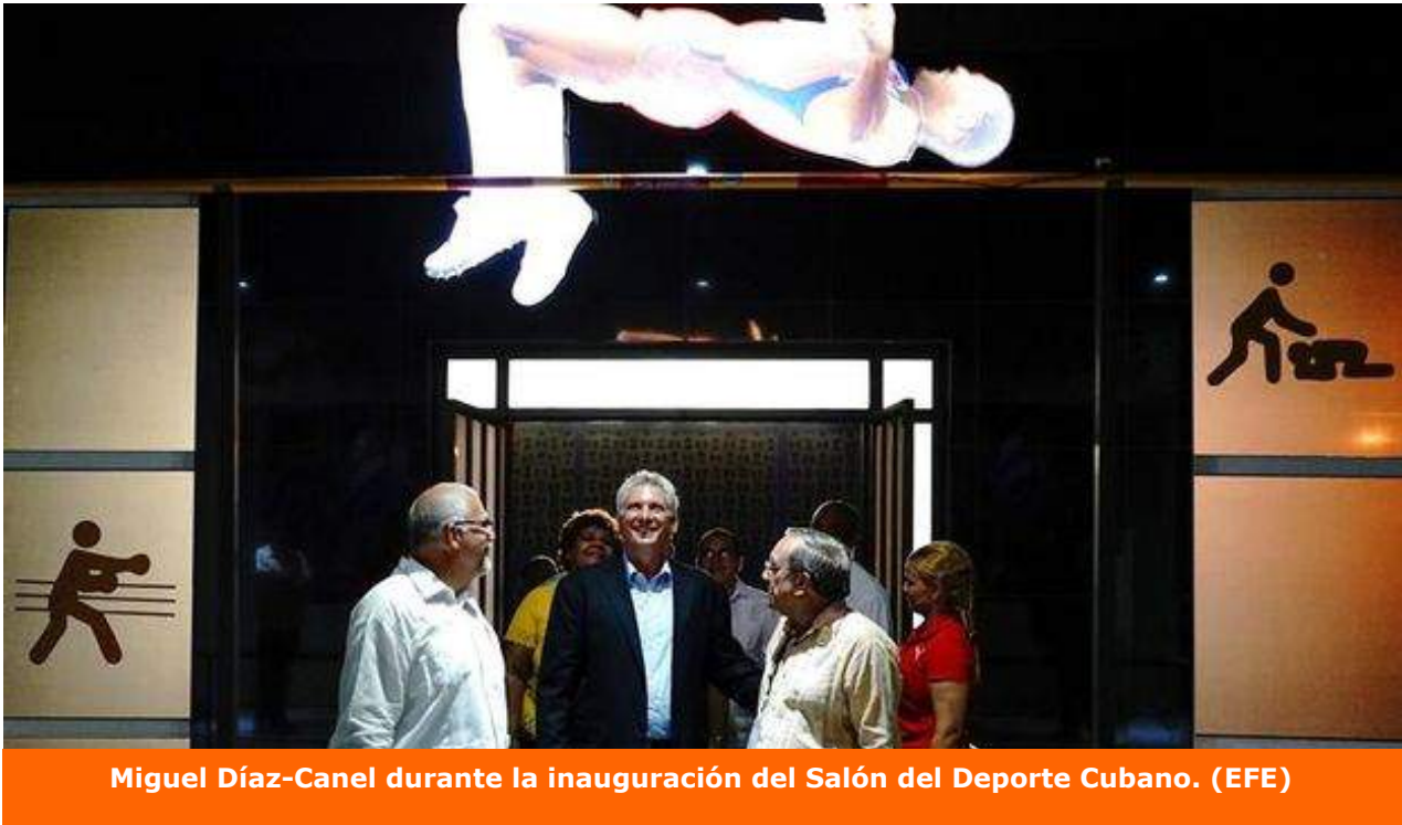
Miguel Díaz-Canel durante la inauguración del Salón del Deporte Cubano.