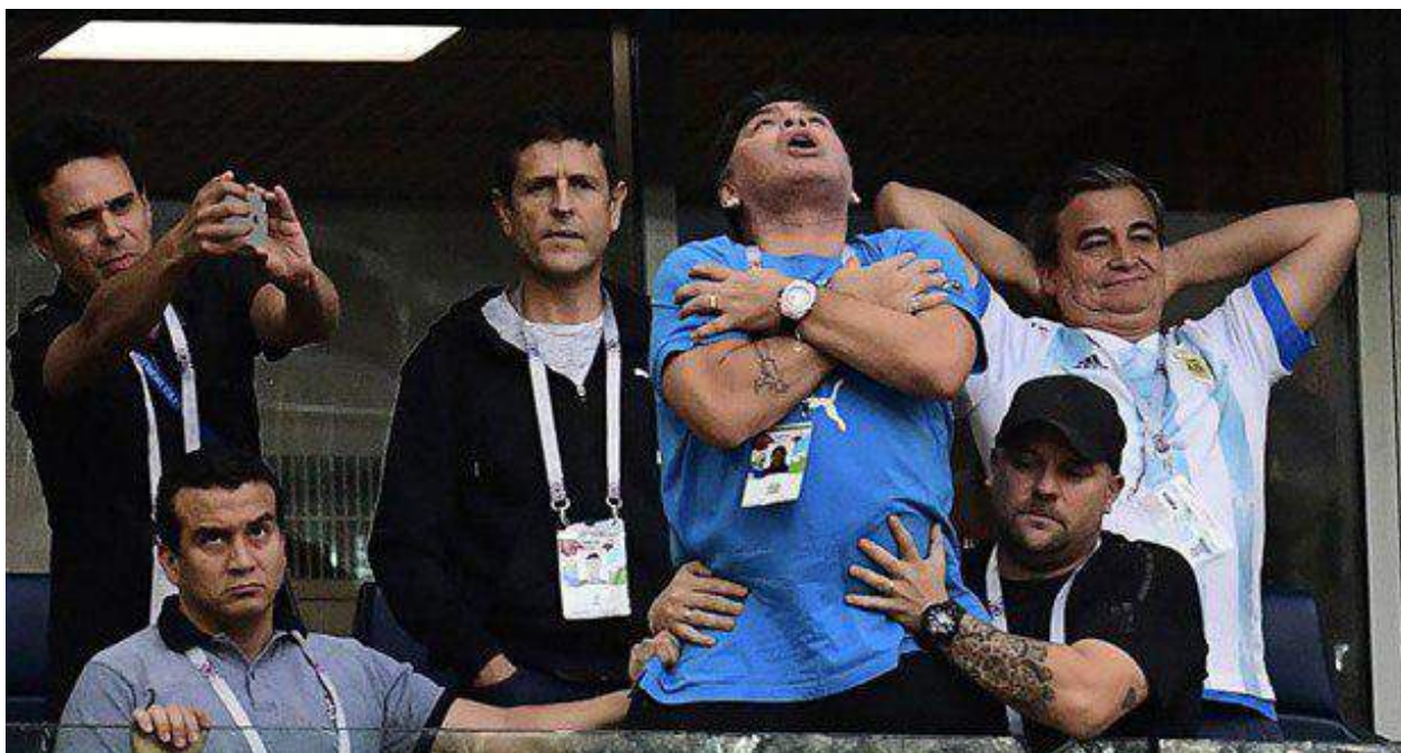
Durante el Mundial de Fútbol, en el juego de Argentina contra Senegal, Maradona casi se cae del palco. (Fotograma)