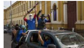
DANIEL ORTEGA Y LAS "FUERZAS DIABÓLICAS"