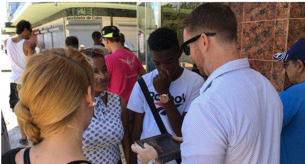
Los metodistas repartieron biblias a los transeúntes tras el ayuno en su iglesia del Vedado.