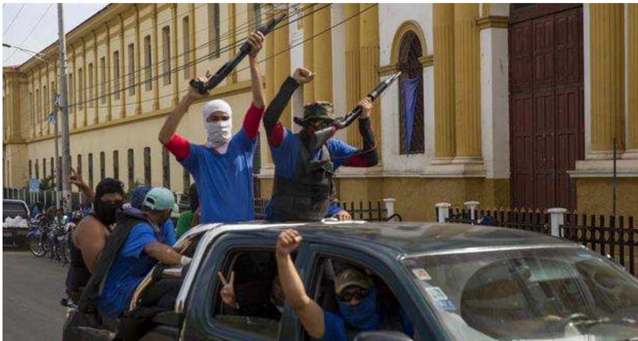
Fuerzas progubernamentales formadas por encapuchados celebran este miércoles en Masaya la toma de control de la ciudad el día anterior.