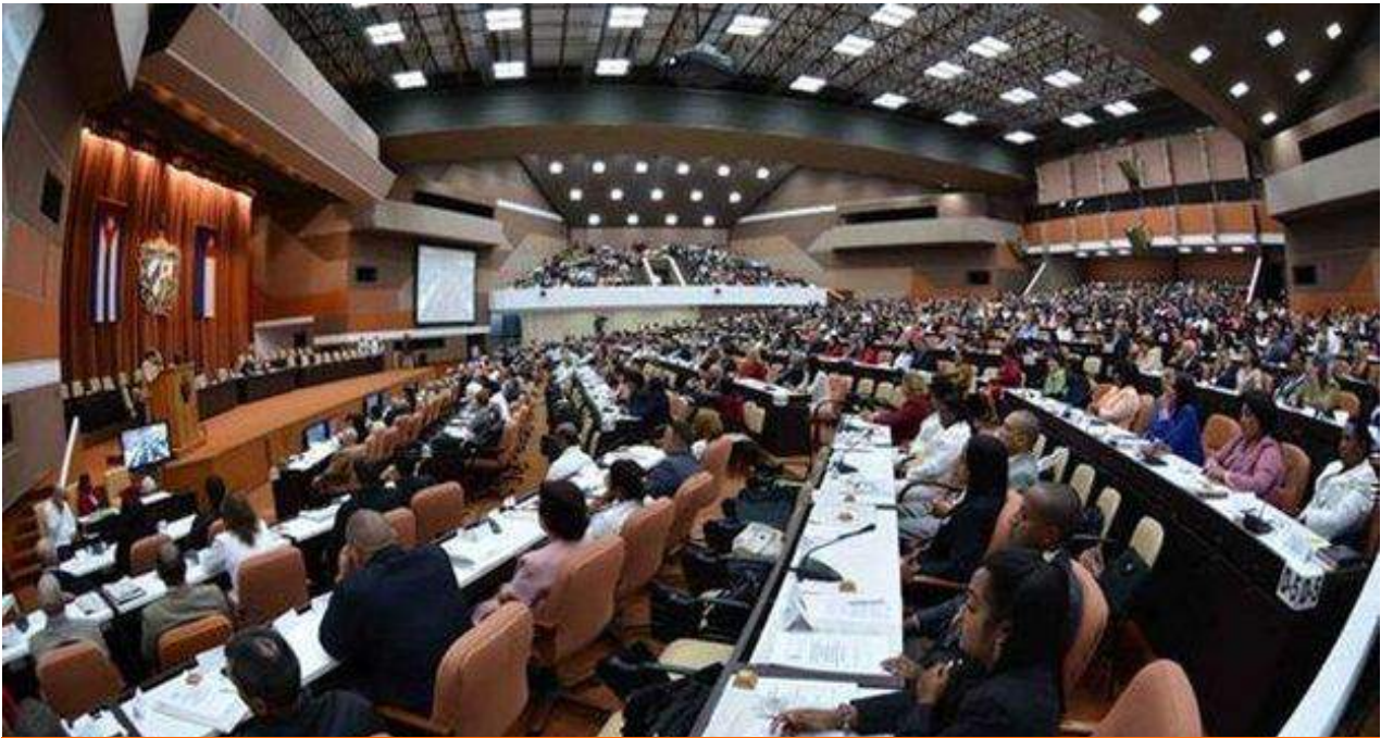
La Asamblea Nacional votará entre el 21 y el 23 de julio el texto.