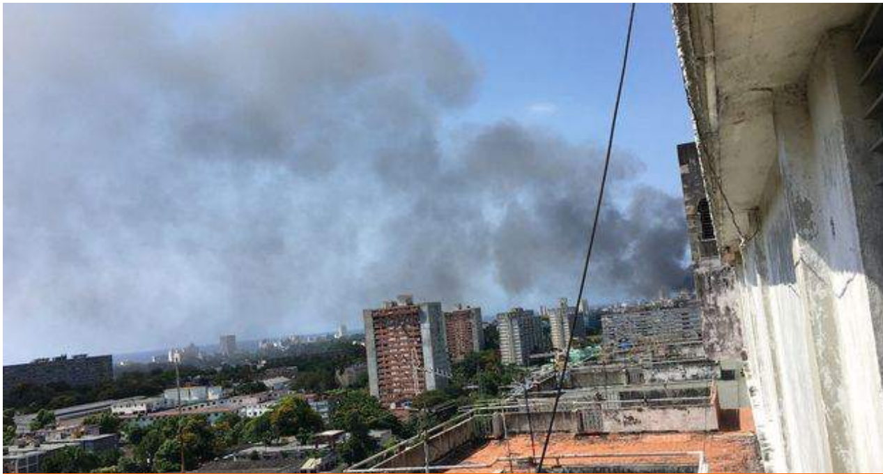
El incendio en el Oncológico de La Habana visto desde la redacción de este diario en el piso 14.