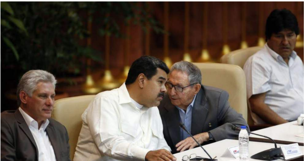
Miguel Díaz-Canel, Nicolás Maduro, Raúl Castro y Evo Morales en lugar preferente durante la clausura del de Foro Sao Paulo.

Una selección con lo mejor de la semana del primer diario independiente hecho en Cuba