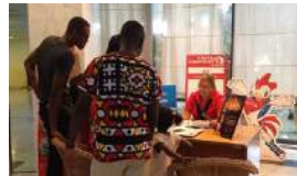
LOS CUBANOS APROVECHAN LA CAÍDA DEL TURISMO