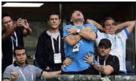
MARADONA, EL SOLDADO DE MADURO