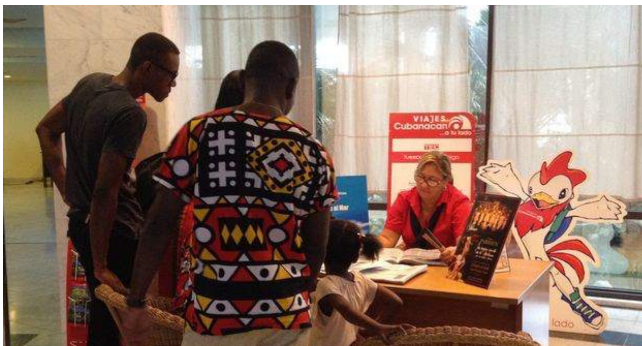
La mayoría de los clientes nacionales son personas con ingresos en divisas. (14ymedio)

La página de Facebook de la Alianza Afro-Cubana publicó algunas imágenes de estos carteles alertando que la intención de esta campaña es "ir con todo contra la legalización del matrimonio igualitario en la reforma constitucional".