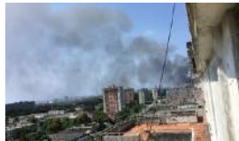
INCENDIO EN EL INSTITUTO DE ONCOLOGÍA