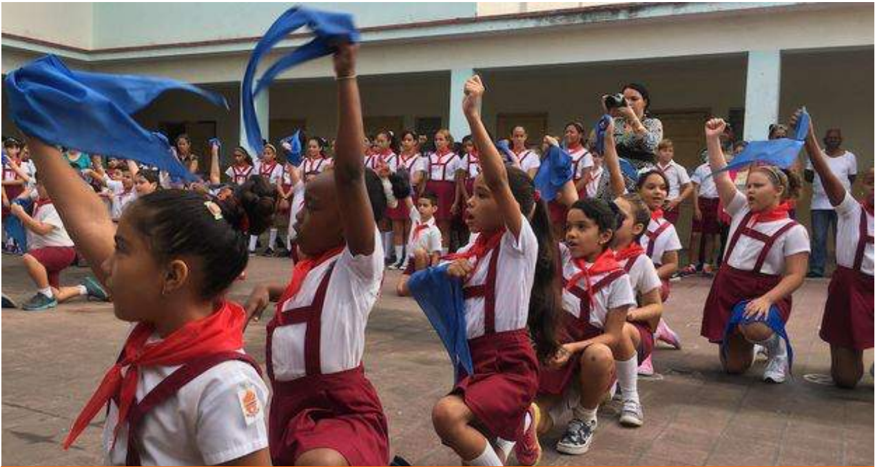
Los niños cubanos en la ceremonia de imposición de la pañoleta.