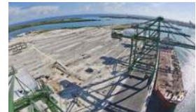
MARIEL, EL HONG KONG CUBANO QUE NO LLEGÓ A SERLO