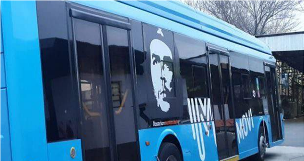
La Línea Q de trolebuses homenajea a Ernesto 'Che' Guevara en Rosario por su 90 aniversario. (@MonicaFein)