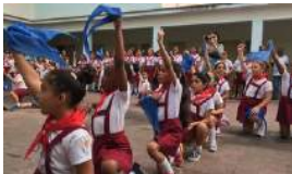
RENOVACIÓN DE VOTOS: LA PAÑOLETA ROJA