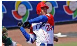
A LA ESPERA DE LOS FRUTOS EN EL BÉISBOL