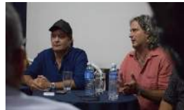
EL FESTIVAL DE GIBARA TENDRÁ UNA SELECCIÓN DE NIVEL