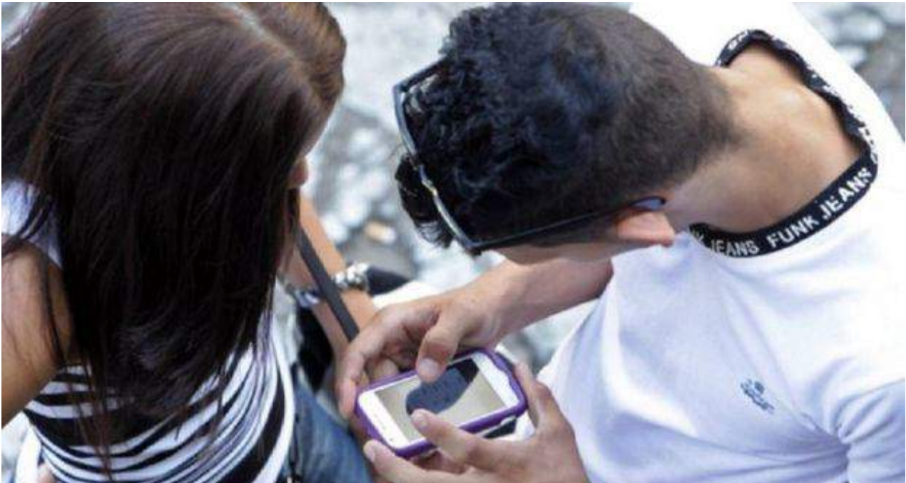
Un usuario de Cubacel utiliza la red móvil cubana.