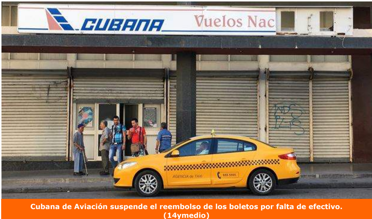
Cubana de Aviación suspende el reembolso de los boletos por falta de efectivo. (14ymedio)