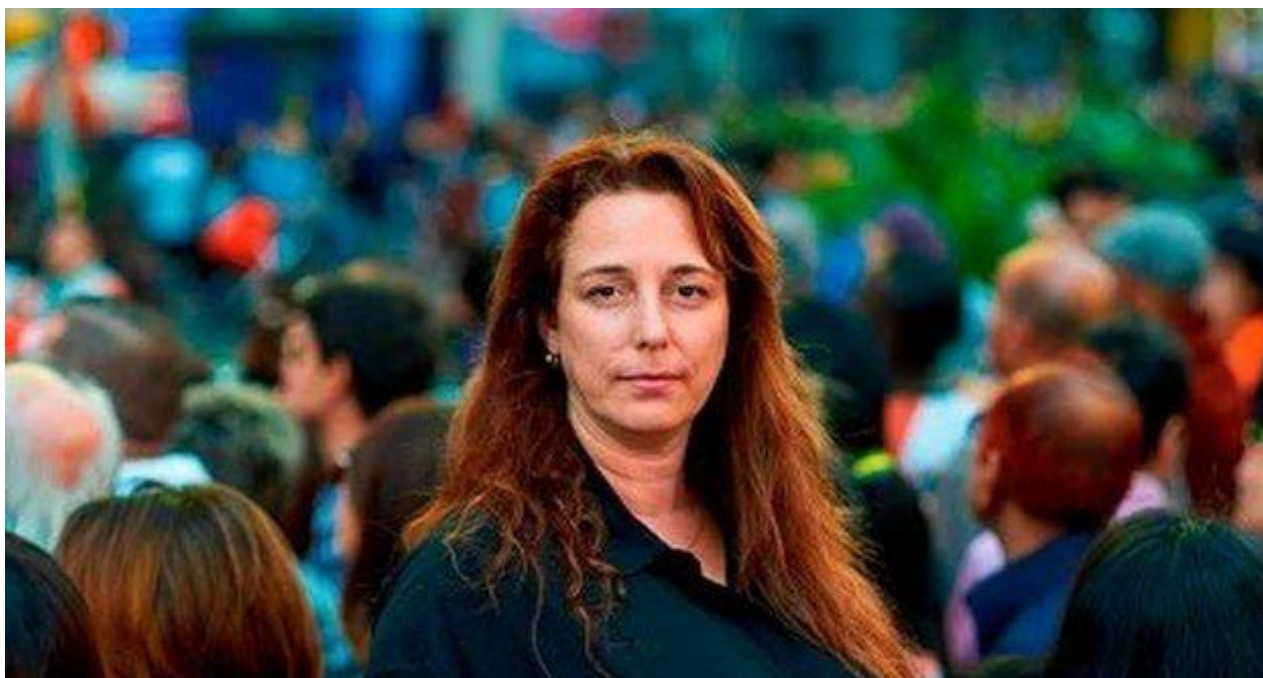
La artista Tania Bruguera, fundadora del Instituto de Artivismo Hannah Arendt.