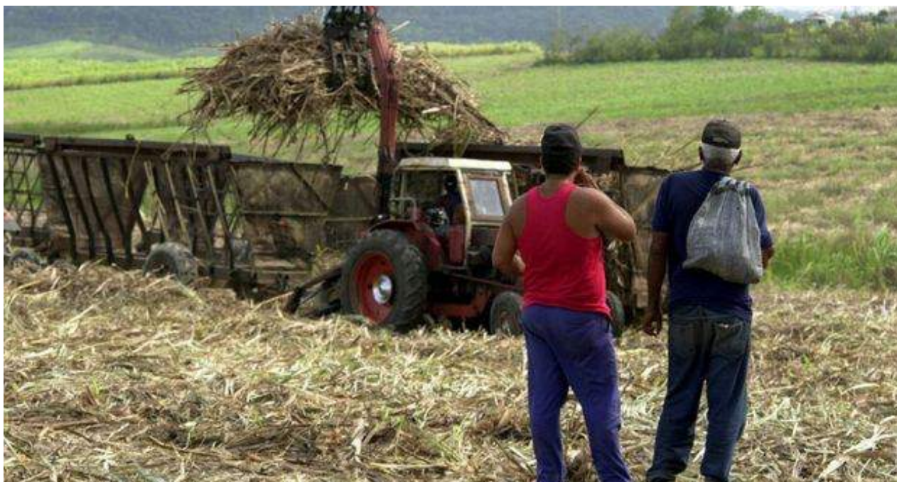
Dos campesinos observan la deteriorada maquinaria con la que se hace la zafra en un campo de caña de azúcar.