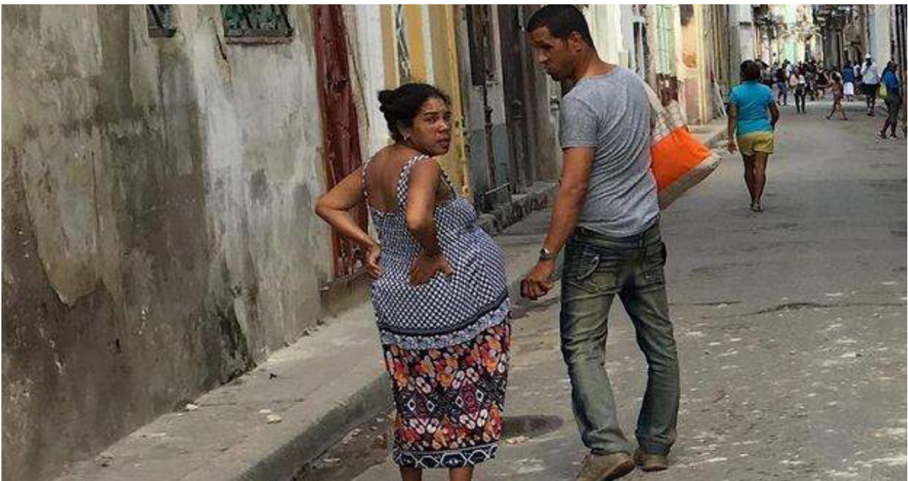
Mientras las tasas de fecundidad en Cuba disminuyen, la tendencia a la baja no ocurre entre las féminas que tienen de 35 a 39 y de 40 a 44 años. (14ymedio)

Una selección con lo mejor de la semana del primer diario independiente hecho en Cuba