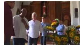
DÍAZ-CANEL VISITA EL SANTUARIO DEL COBRE