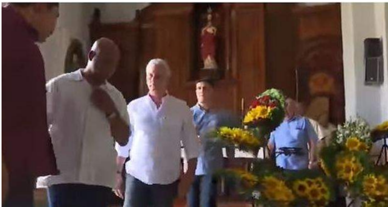
El presidente Miguel Díaz-Canel a su salida del santuario de la Virgen de la Caridad del Cobre este miércoles. (Captura)