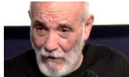
RAFAEL ALCIDES, EL GRAN POETA DEL 'INSILIO' CUBANO