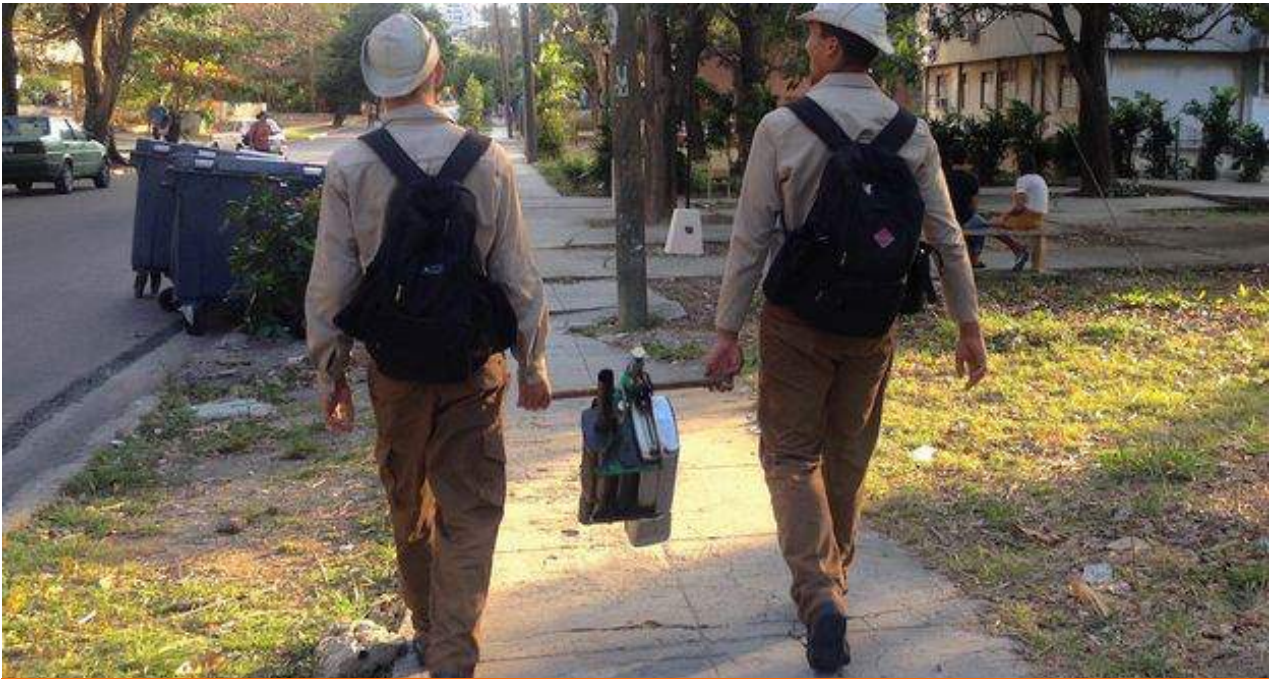
Dos jóvenes del Ejército Juvenil del Trabajo con la 'motomochila' de fumigación.