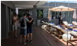
BAJA OCUPACIÓN EN EL KEMPINSKI SEGÚN SUS TRABAJADORES