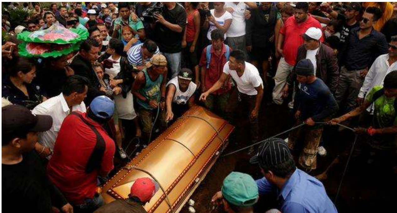
Sepelio de la familia Pavón, asesinada en un incendio intencionado en las afueras de Managua.