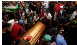
NICARAGUA: "ME MATARON A TODA MI FAMILIA"