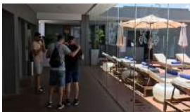
BESOS SÍ, BESOS NO, UN VIDEOCLIP POR LA DIVERSIDAD