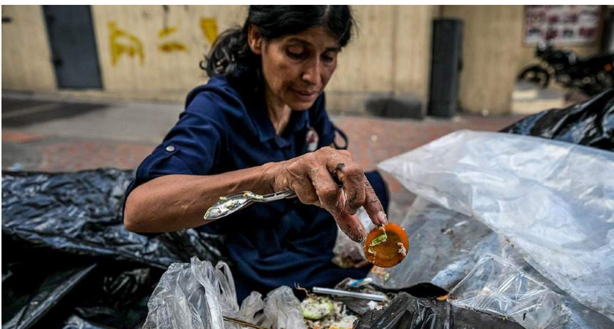
Buscar algo que comer en la basura se ha convertido en una alternativa para algunos venezolanos.

Una selección con lo mejor de la semana del primer diario independiente hecho en Cuba