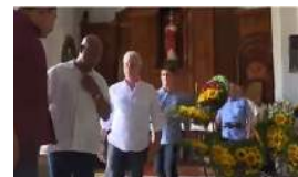
ETECSA PRIORIZA EL TURISMO Y LAS GRANDES CIUDADES