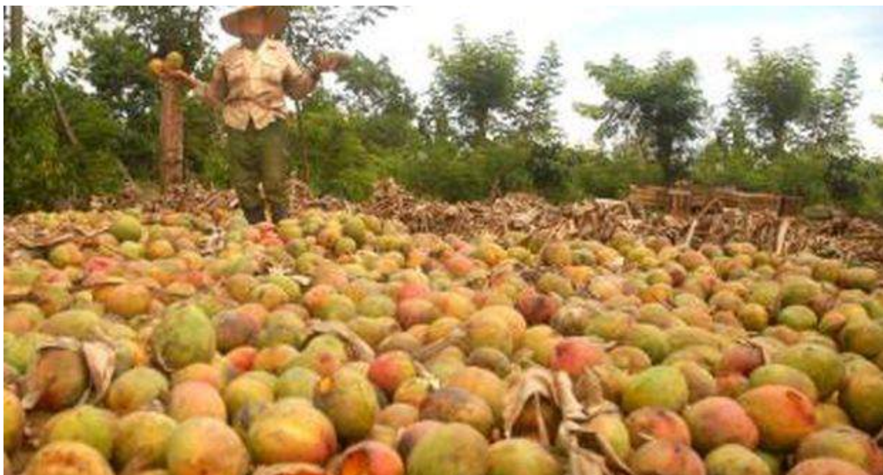
Cosecha de mango perdida en Artemisa.