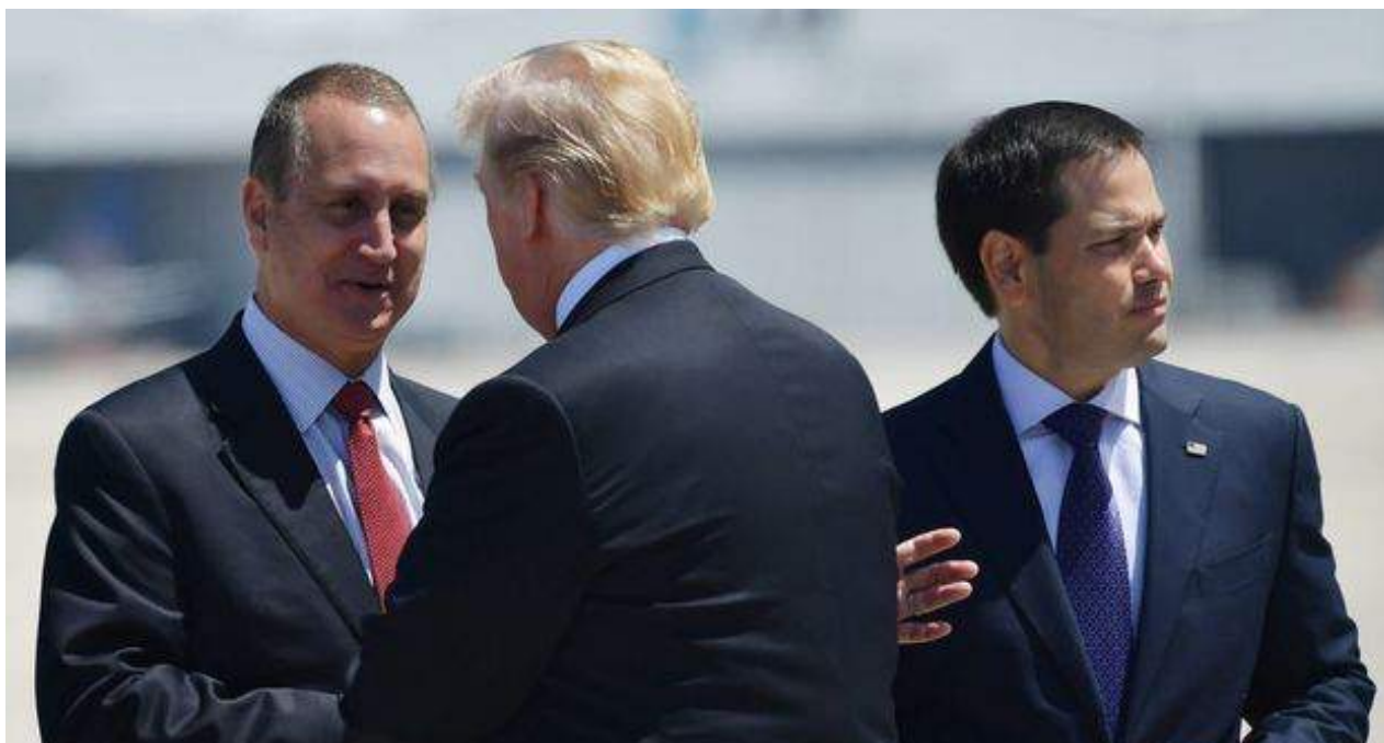
El congresista Mario Díaz-Balart saluda al presidente Donald Trump, junto al senador Marco Rubio.