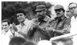
NICARAGUA: NOSOTROS, LOS CULPABLES