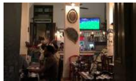
CUBA VIVE AL RITMO DEL MUNDIAL DE FÚTBOL