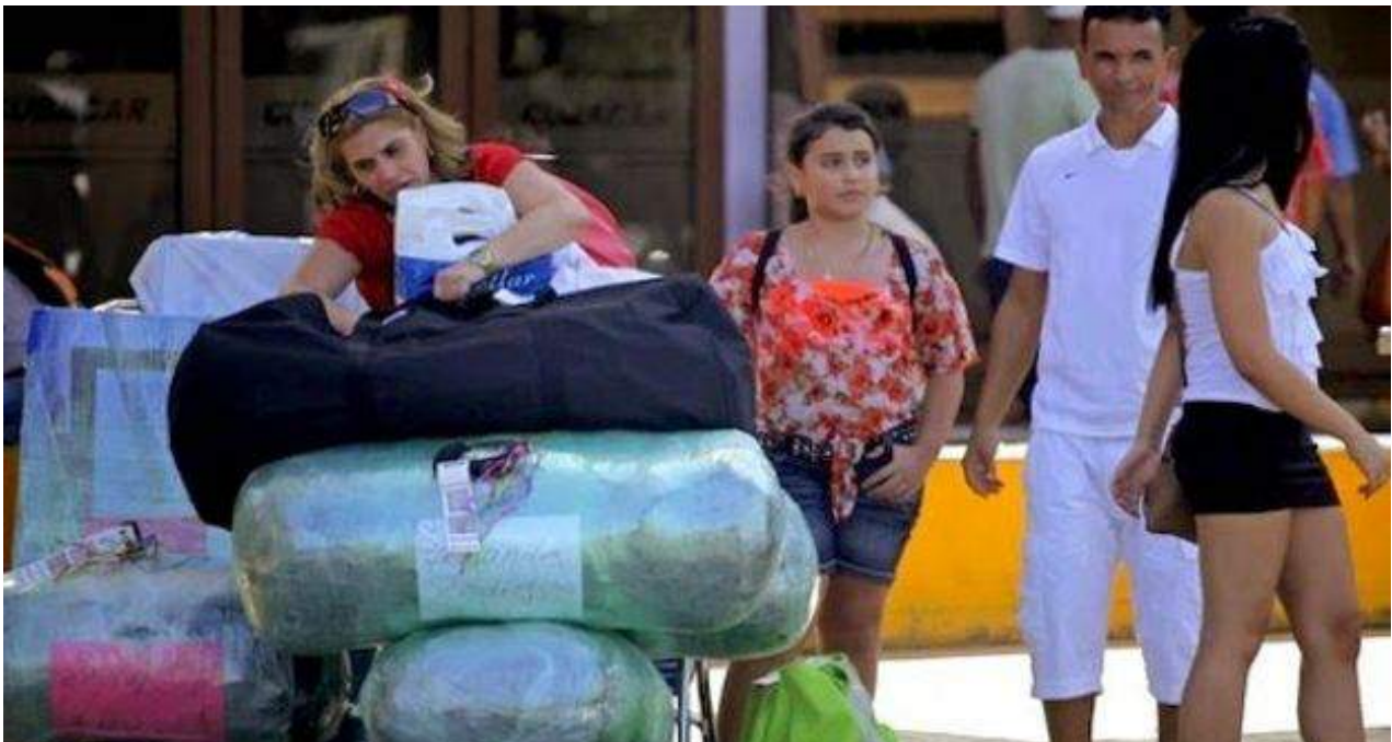
Viajeros cubanos llegan al aeropuerto internacional de La Habana cargados de bultos.