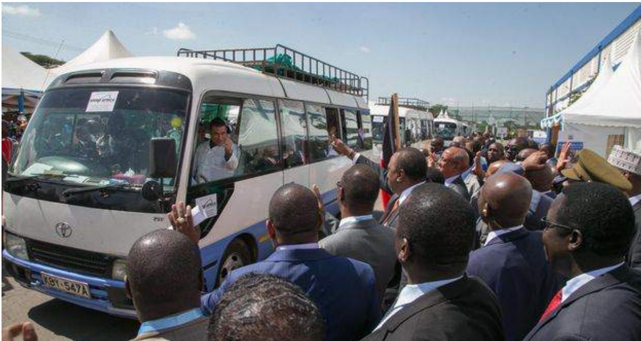
El presidente Uhuru Kenyatta acudió al acto y, posteriormente, publicó imágenes del momento en su cuenta de Twitter.