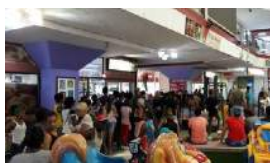
LA REBELIÓN DE LOS USUARIOS EN CUBA