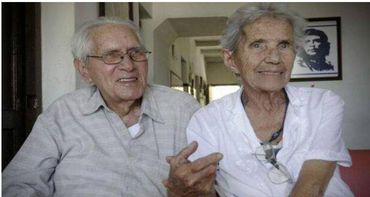
El actor Salvador Wood, fallecido este sábado en La Habana.