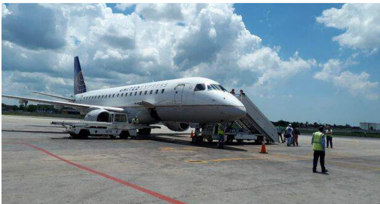
Cuando el avión de United tocó tierra en Nueva York, la mayoría estadounidense de pasajeros decía adiós a una era.

Una selección con lo mejor de la semana del primer diario independiente hecho en Cuba