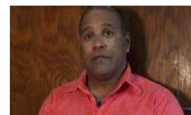
"SI REGRESAS TE VAS A ARREPENTIR"