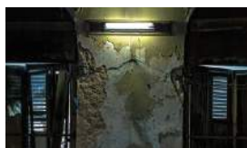
SNET PIDE UNA LICENCIA PARA SEGUIR OPERANDO