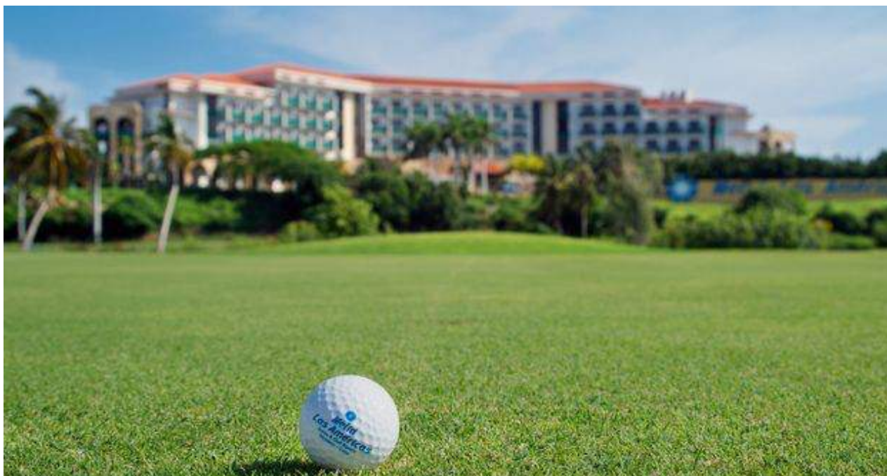
Campo de golf de uno de los hoteles Meliá en Cuba.