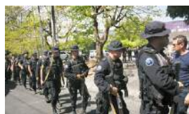
AGENTES CUBANOS ASESORAN EN NICARAGUA