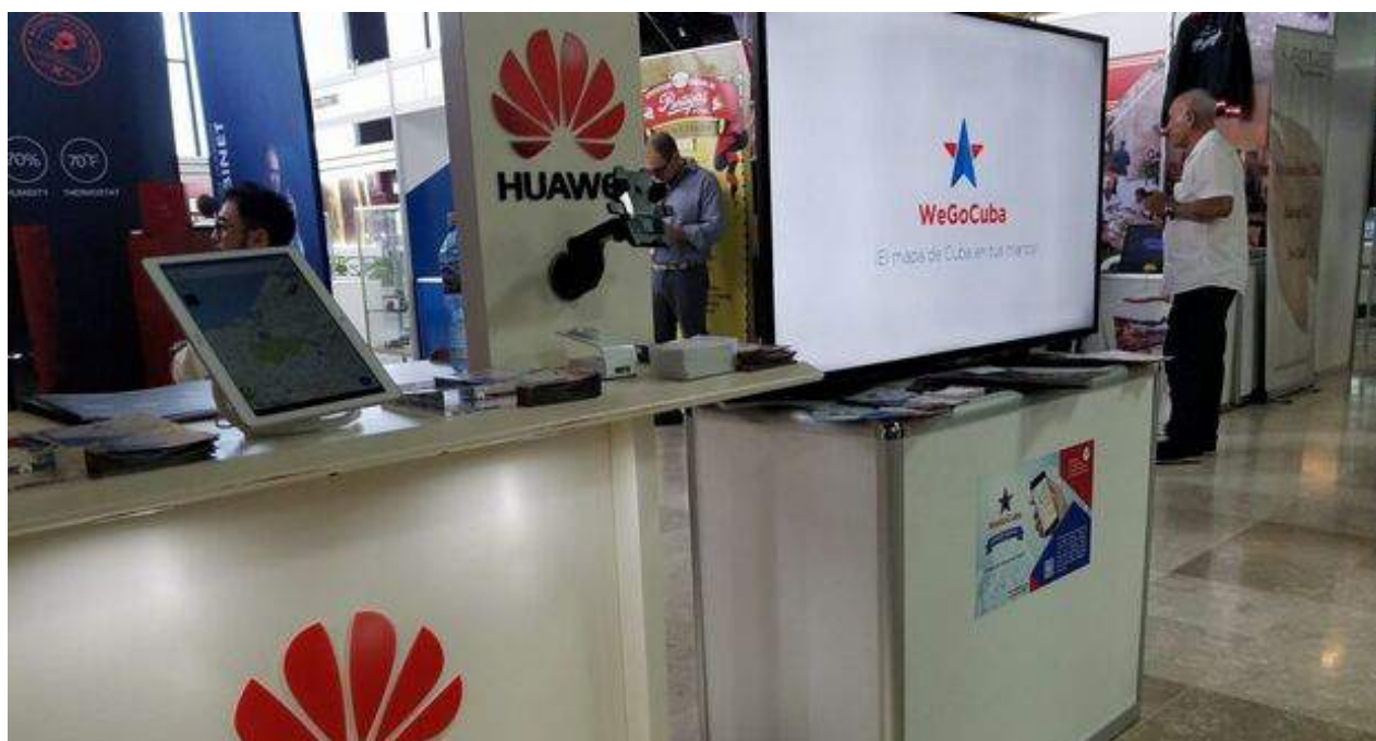
Huawei tiene una presencia bastante extendida en Cuba.