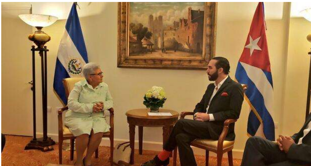
Gladys Bejarano transmitió a Nayib Bukele "los mejores deseos del Presidente de Cuba para los próximos años de Gobierno".