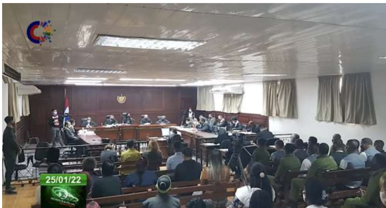
Juicio contra los manifestantes del 11J de La Güinera, celebrado entre el 17 y el 18 de enero. (Captura)