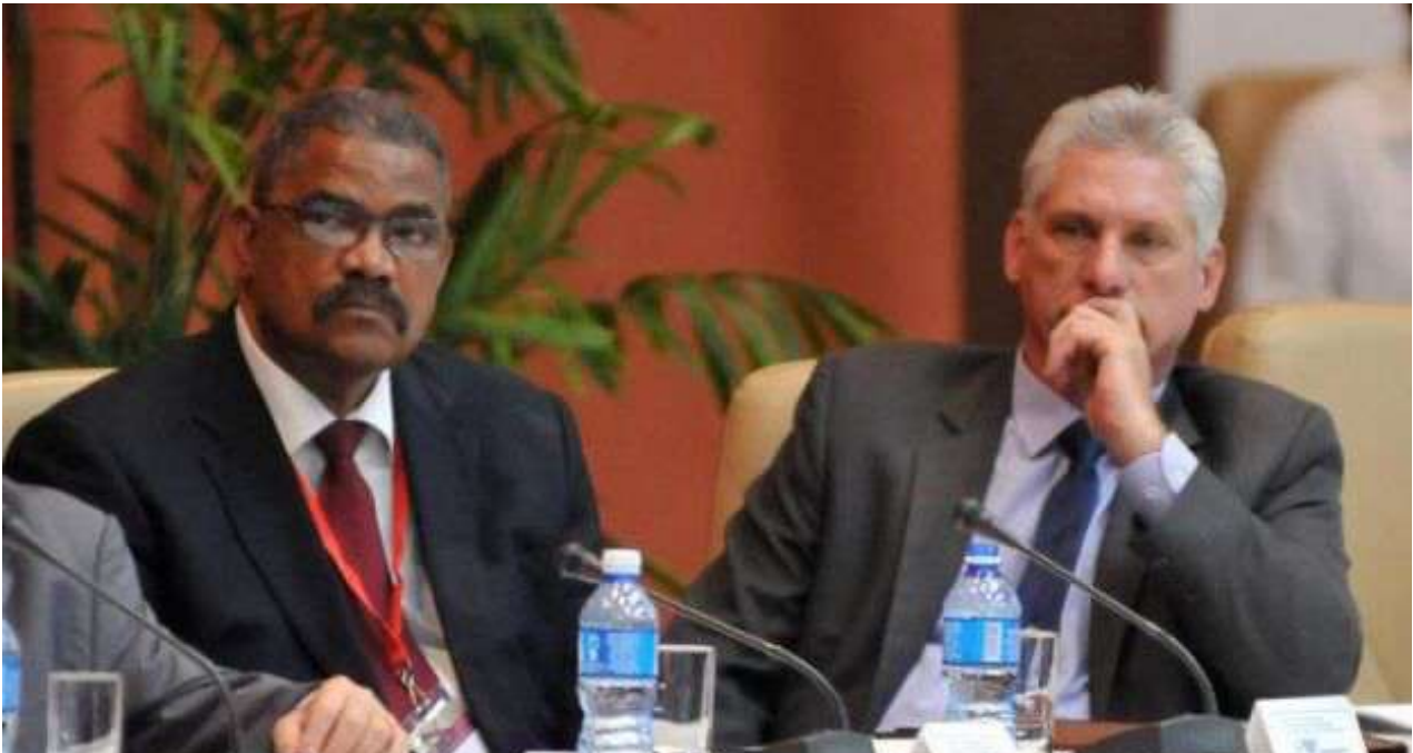
El presidente del Tribunal Supremo de Cuba, Rubén Remigio Ferro, junto al de la República, Miguel Díaz-Canel.