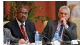
OPINIÓN: '¿QUIÉN MANDA HOY EN CUBA?'