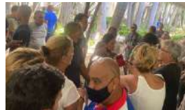
POLÉMICA VENTA DE ENTRADAS PARA VER A PABLO MILANÉS