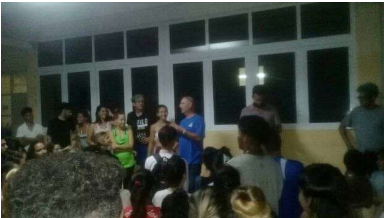
Los funcionarios trataron de apaciguar a los residentes que protestaron la noche de este martes.

Una selección con lo mejor de la semana del primer diario independiente hecho en Cuba