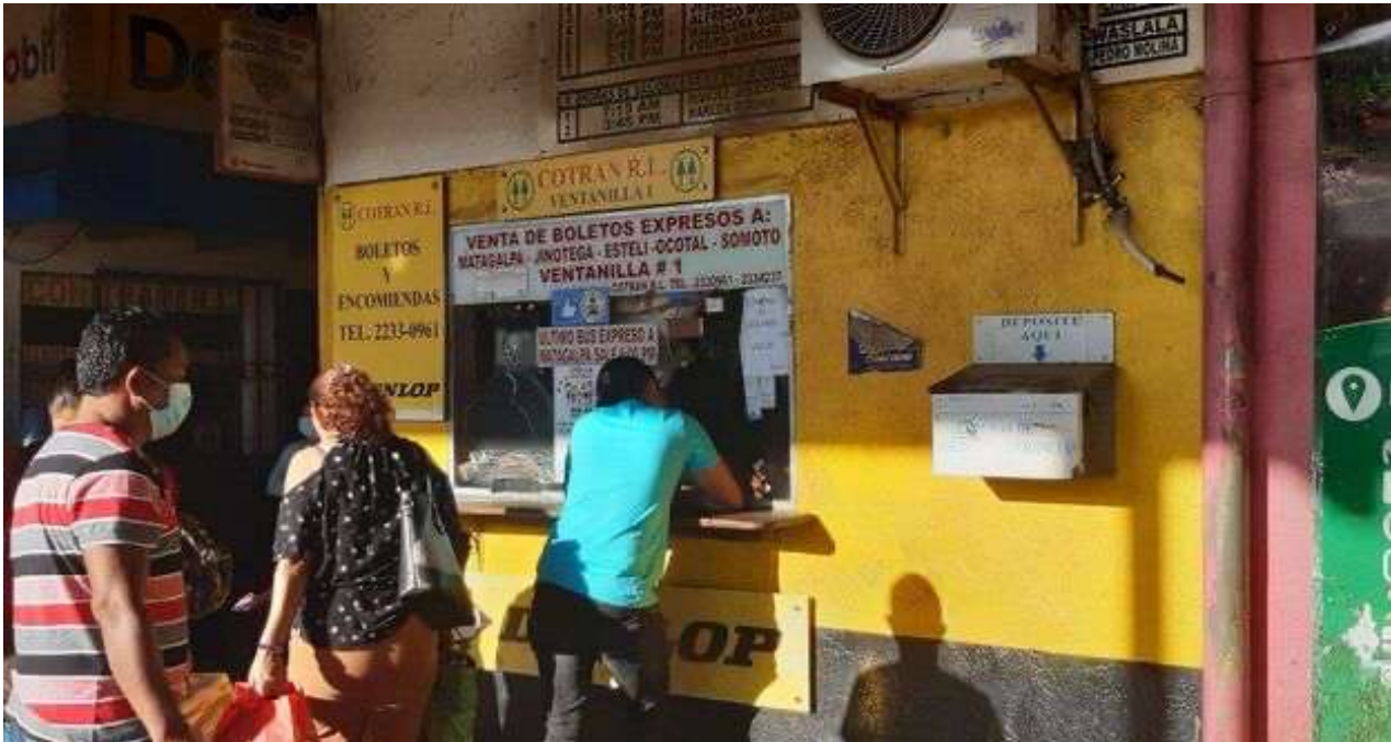
Terminal de Managua desde donde salen los ómnibus hacia el norte del país. (14ymedio)