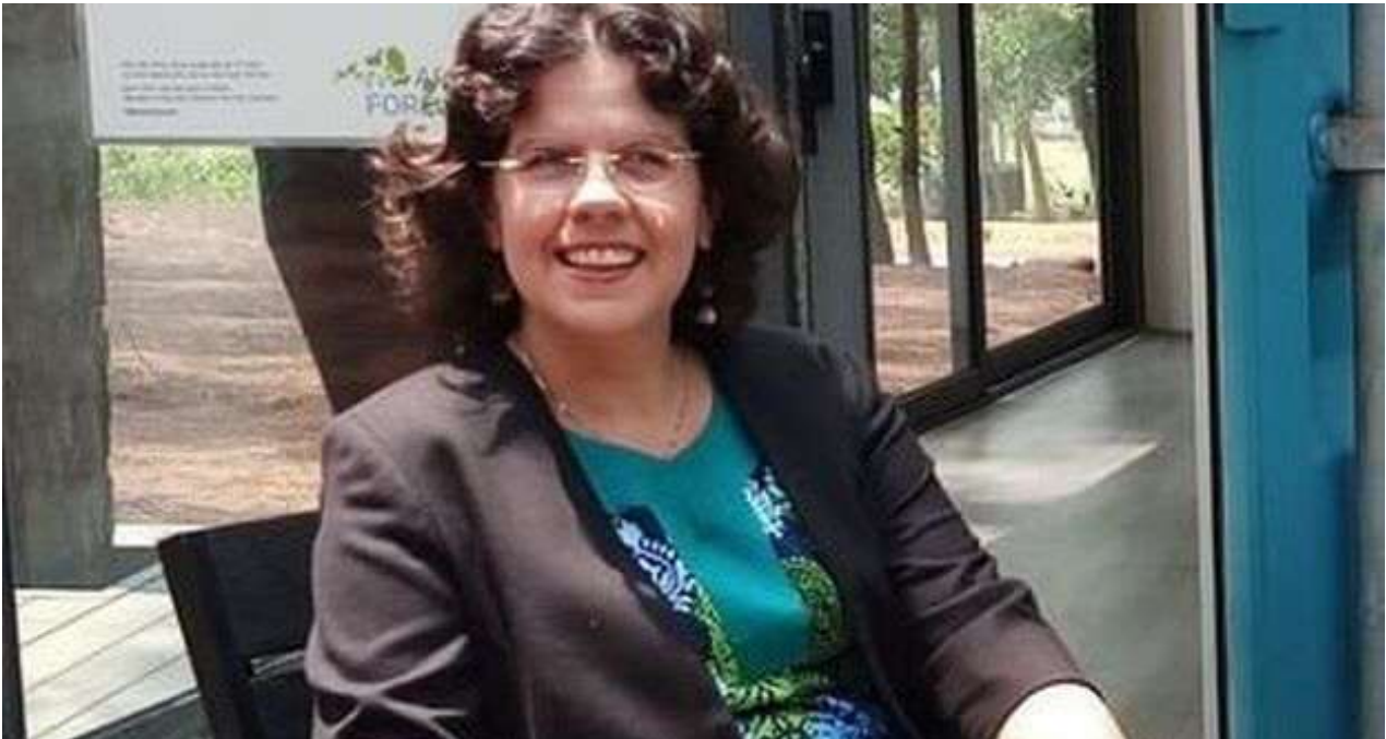
Lianys Torres Rivera, embajadora de Cuba en Estados Unidos.