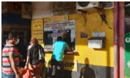
RÉCORD HISTÓRICO DE LLEGADAS DE CUBANOS A EE UU