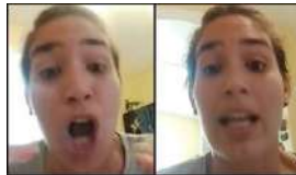
UN PUEBLO AL BORDE DEL ATAQUE DE NERVIOS