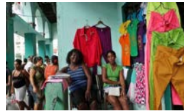
LOS REBELDES DE LA ROPA