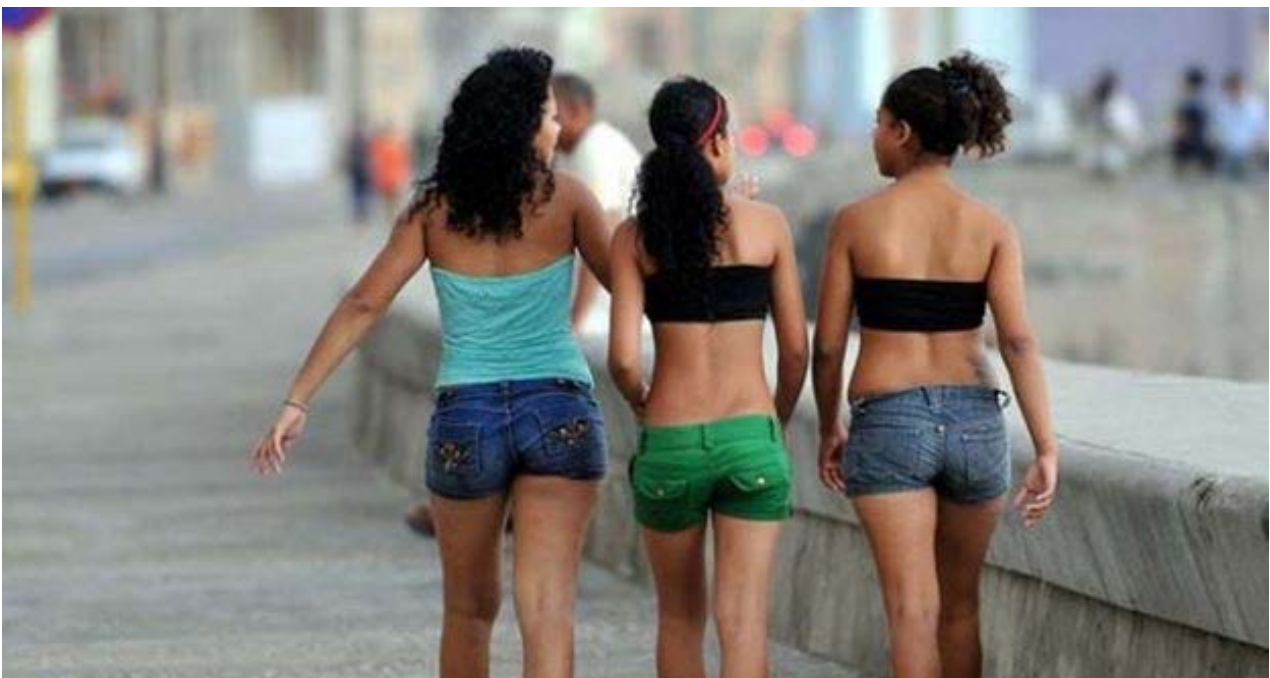
El Gobierno sigue negando la existencia de prostitución infantil en Cuba más allá de casos aislados. (EFE)

Marcia está a la espera de un paquete "importante". Cuenta que una famosa cantante le encargó un vestido para una noche especial. "Estoy contando los días para que llegue, porque si todo sale bien ganaré una excelente cliente", dice, convencida de que así logrará tener su propio "círculo de gente famosa" a la que comprará "ropa de marca y a pedido".