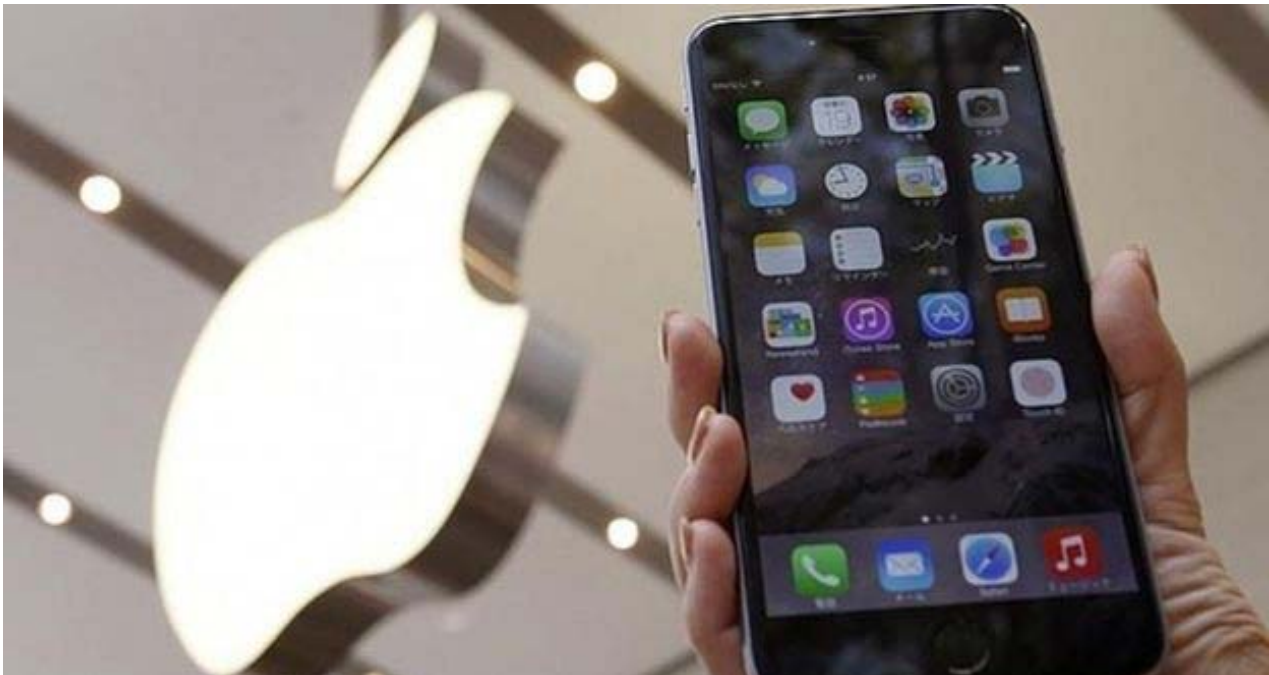
Un iPhone de la empresa Apple.