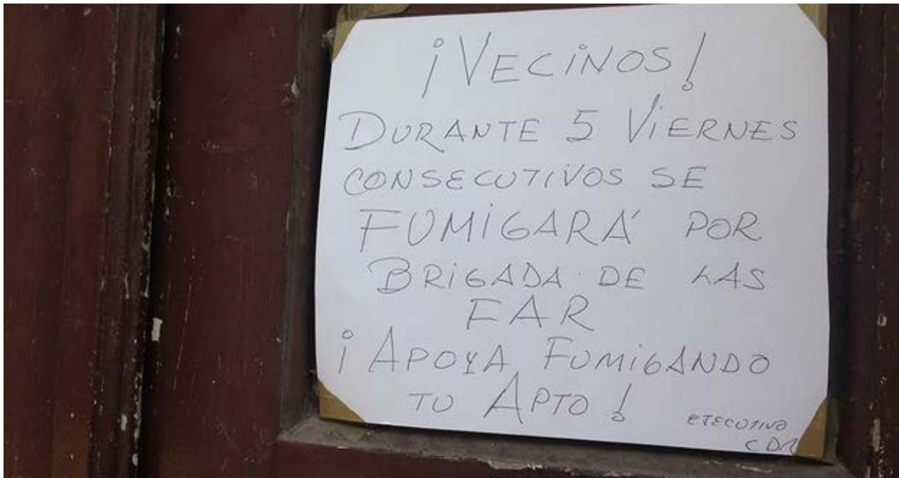
Cartel de aviso de la fumigación. (14ymedio)

La disputa sobre la privacidad y la seguridad seguirá por largo tiempo, porque es la eterna tensión entre los límites del espacio social y el espacio personal. El choque entre los intereses de cualquier nación y esa parte frágil, pero imprescindible, que nos hace individuos.