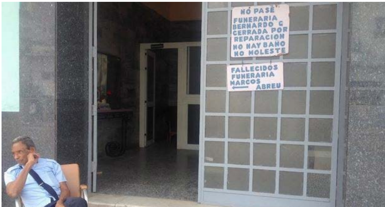
Funeraria Bernardo García cerrada por reparación.