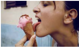
MUJERES, SIEMPRE POSTERGADAS