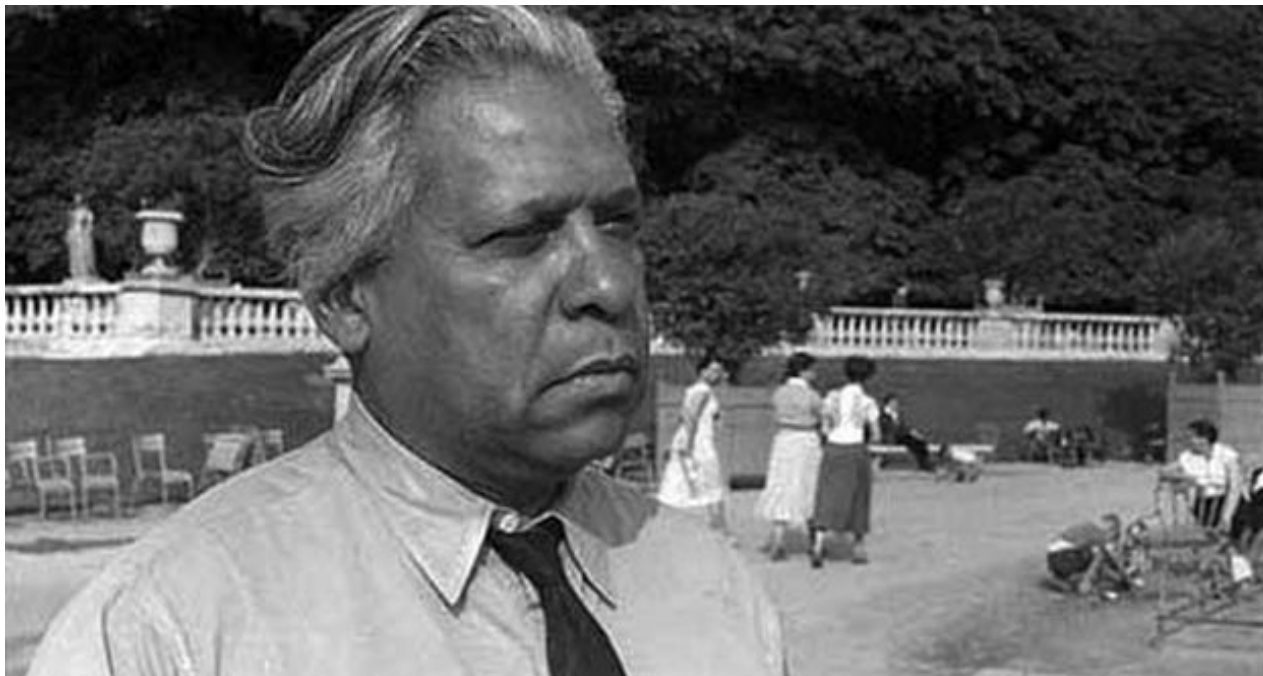
Nicolás Guillén en París, en 1956.