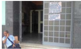
FÉRETROS DE SEGUNDA