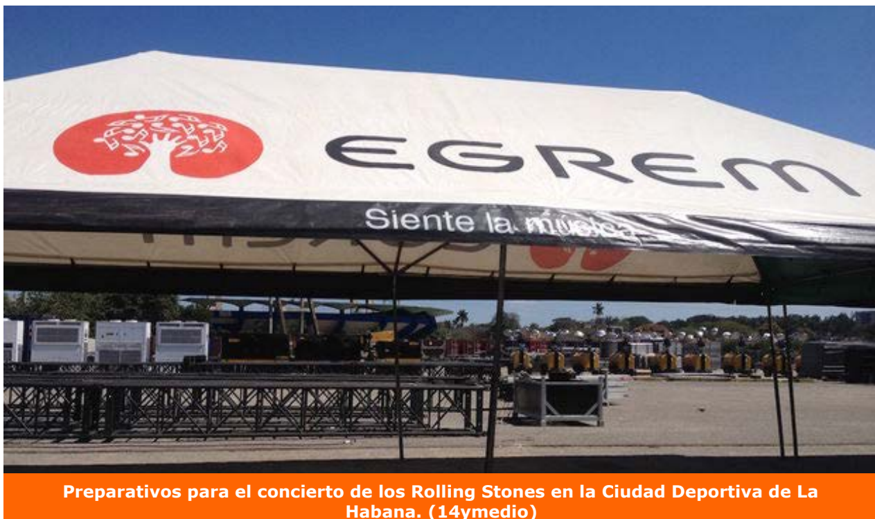
Preparativos para el concierto de los Rolling Stones en la Ciudad Deportiva de La Habana.