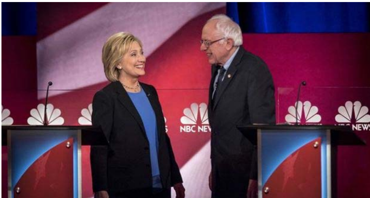
Clinton y Sanders se saludan al comienzo del debate demócrata este jueves.