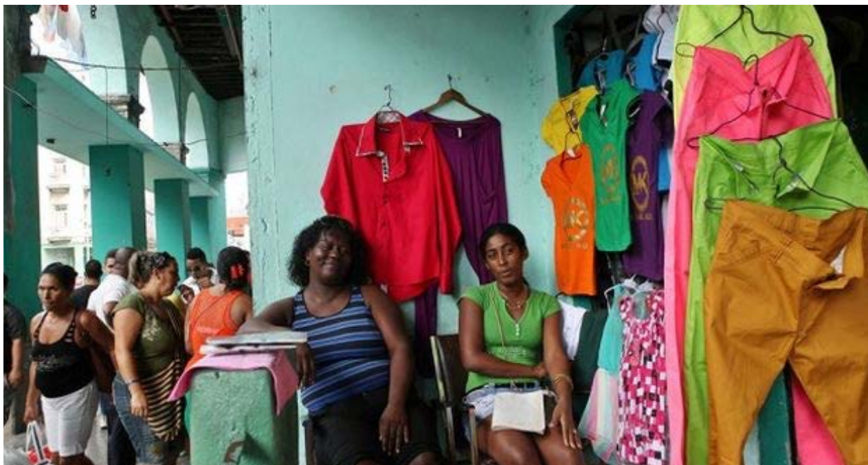
Tienda de ropa en La Habana.