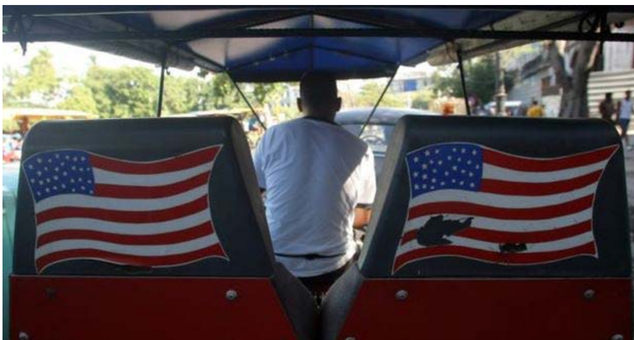
Un hombre conduce por las calles de La Habana un bicitaxi con la bandera de Estados Unidos.

En el contexto de la Guerra Fría, el Gobierno norteamericano tendría que haber sido muy ingenuo si no hubiera observado con creciente preocupación cómo se desarrollaban los acontecimientos apenas 90 millas al sur. De los discursos conciliadores y humanistas de 1959, el lenguaje del líder y voz de la Revolución fue modificando el tono. Pero no solo los discursos se volvieron más agresivos y antiyanquis .