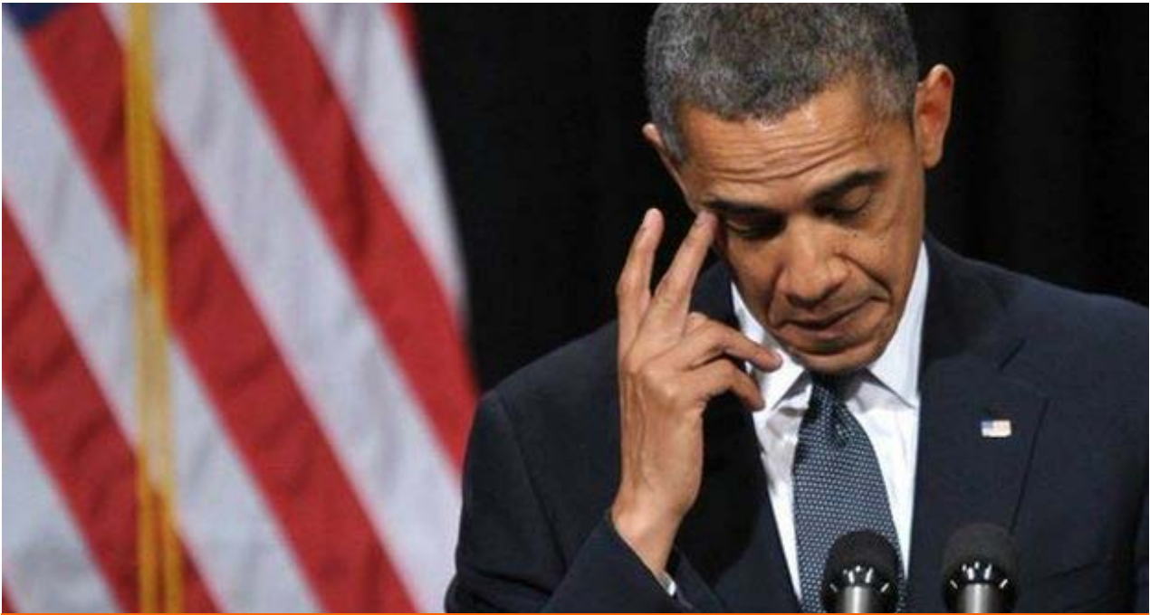
El presidente estadounidense, Barack Obama, este febrero.