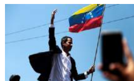
REGRESO TRIUNFAL DE GUAIDÓ A VENEZUELA