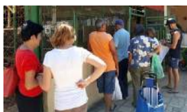
EL FANTASMA DEL PERÍODO ESPECIAL AMENAZA A CUBA