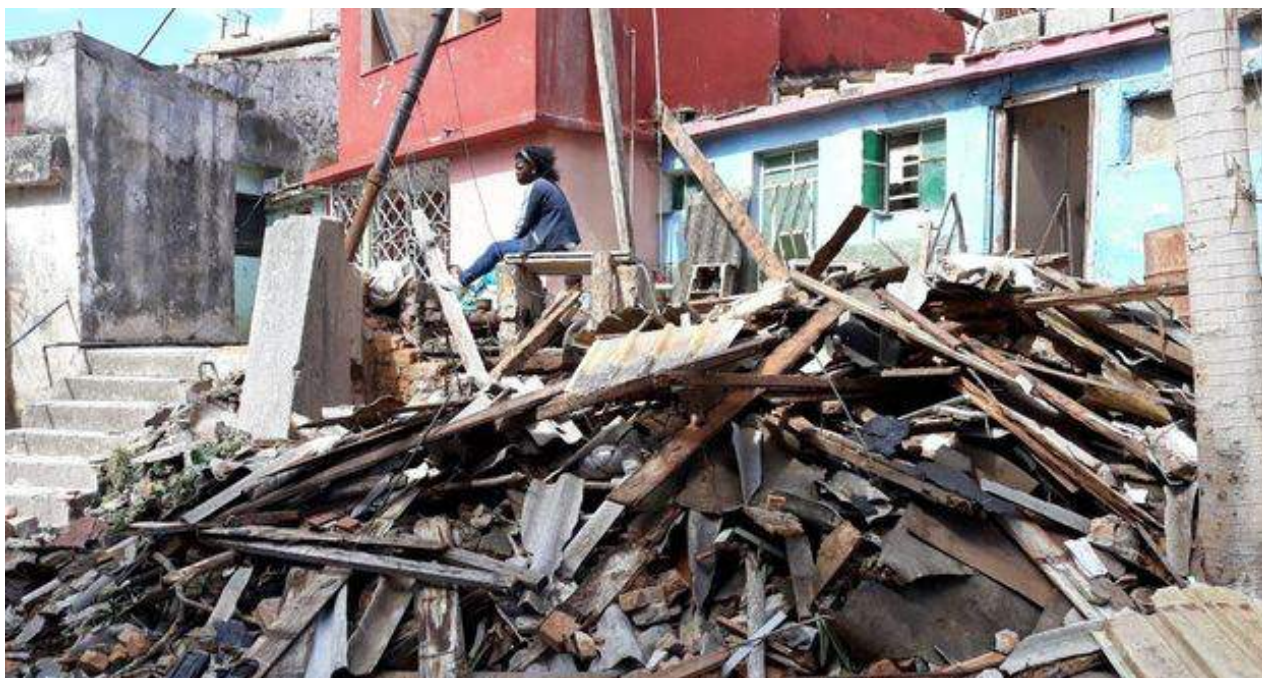
El tornado ha agravado más si cabe la situación de la vivienda en La Habana. (14ymedio)