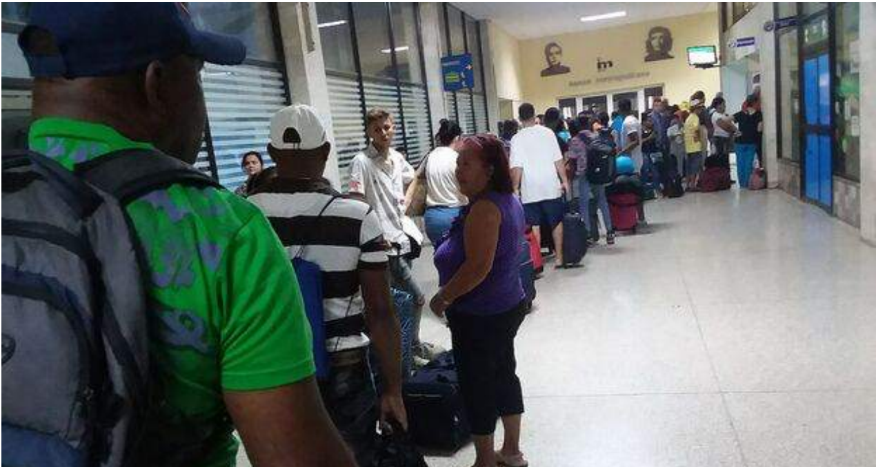
Pasajeros en la terminal central de ómnibus de La Habana, en la cola para pagar el exceso de equipaje.