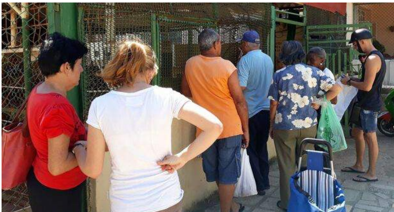
El empeoramiento de la economía se observa incluso en la falta de productos subsidiados de primera necesidad como el pan y los huevos.