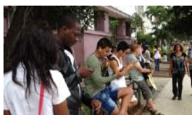
LA 4G LLEGA POR FIN A LA CAPITAL CUBANA