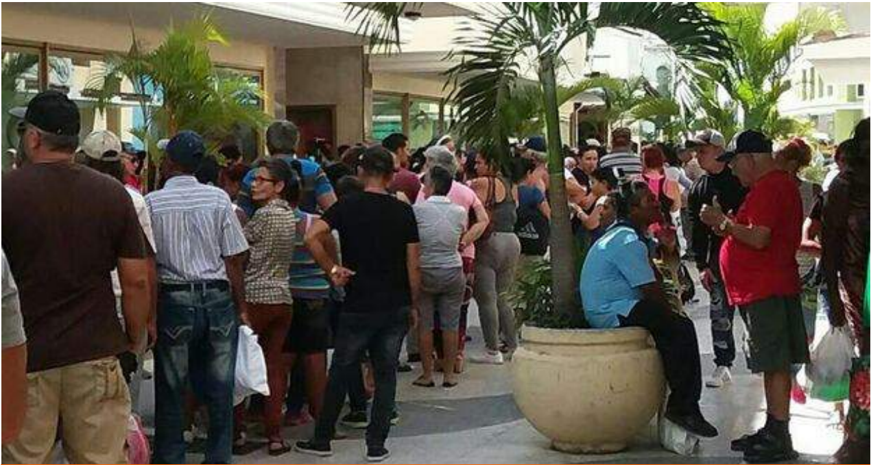
Cola para comprar aceite de comer en Camagüey, tienda El Encanto. (Inalkis Rodríguez)