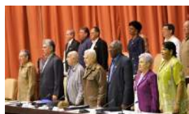
REFLEXIONES SOBRE LAS LEYES QUE VIENEN