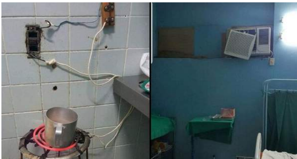
El Hospital General Docente Intermunicipal Mártires del 9 de Abril en Sagua la Grande, Villa Clara.

Una selección con lo mejor de la semana del primer diario independiente hecho en Cuba