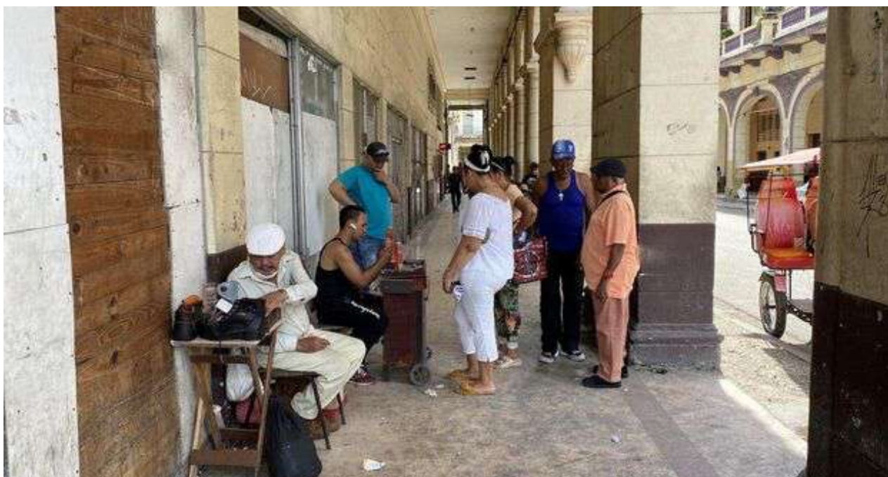
El virus ataca más a las personas mayores y también es más letal.

Una selección con lo mejor de la semana del primer diario independiente hecho en Cuba