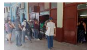
CUBA Y LA FALSA NORMALIDAD ANTE EL COVID-19