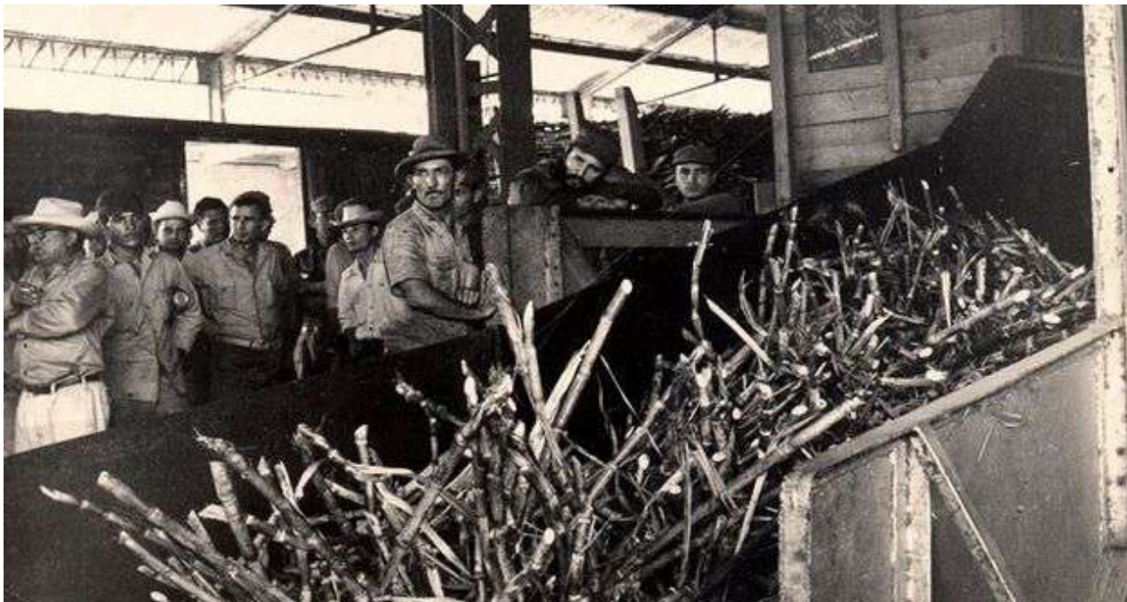
Pero a mediados de marzo de 1970 se llegó a un punto de no retorno en la zafra.