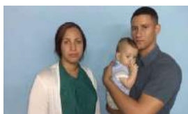
RETRASAN LA SENTENCIA CONTRA FERRER