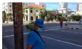
CATORCE BULOS SOBRE EL CORONAVIRUS