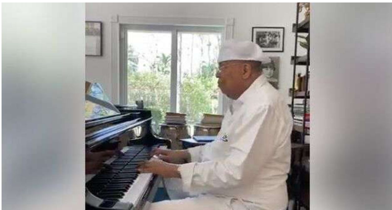
Chucho Valdés toca el piano para sus seguidores en Facebook tras cancelar una presentación pública.