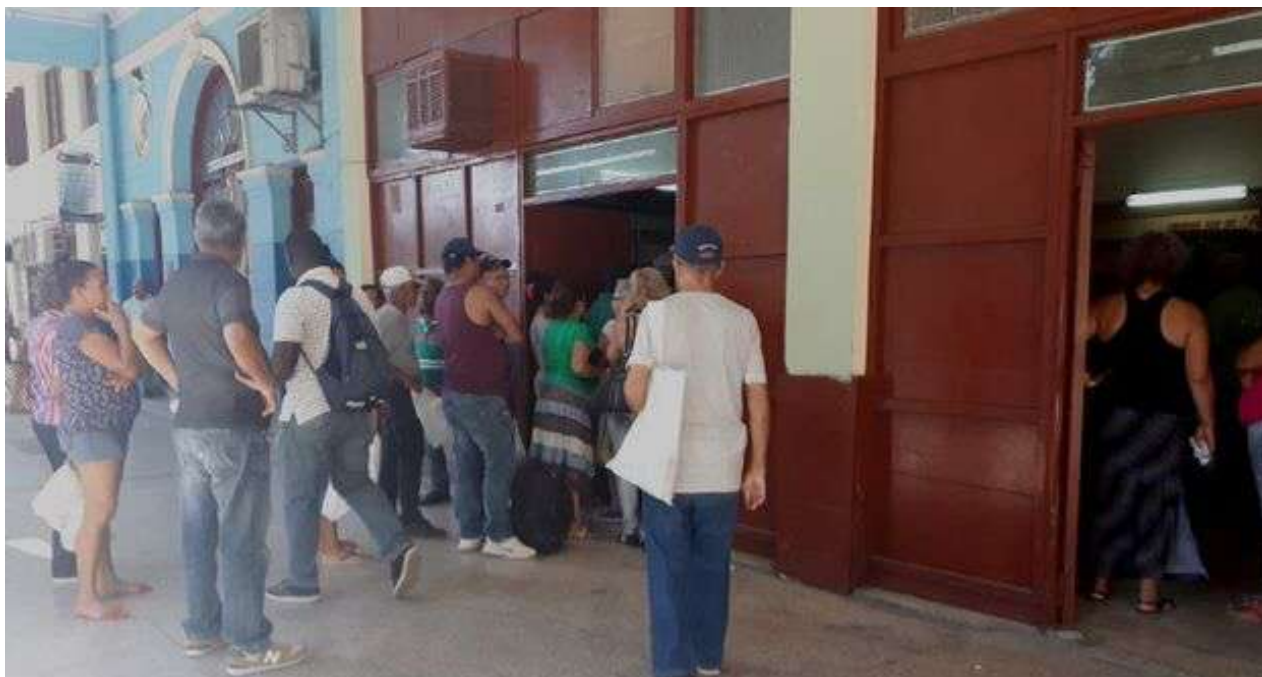
Las personas siguen aglomerándose sin distancia suficiente entre sí.