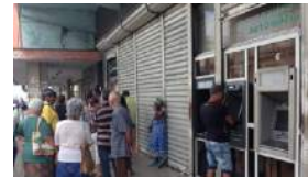
DÓNDE GUARDAN LOS CUBANOS EL DINERO