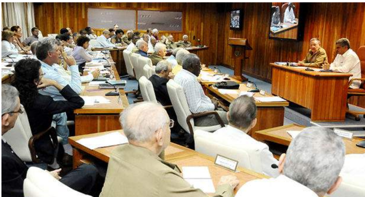
Consejo de ministros durante una reunion el pasado septiembre.