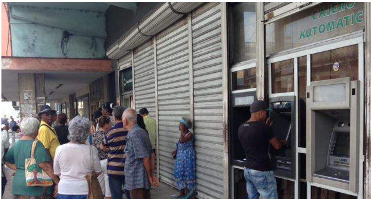
Un hombre intenta sacar dinero en un cajero automático a las afueras de un Banco Metropolitano en La Habana.

"Los rendimientos del sector están estancados o han decrecido ligeramente" advierte el informe, que pronostica que en la medida en que la agricultura "no aumente sus rendimientos y explote su potencialidad productiva, la economía tendrá que asumir importantes erogaciones para poder suplir su demanda interna".