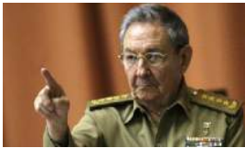
EL 'RAULISMO' APURA LAS TAREAS PENDIENTES