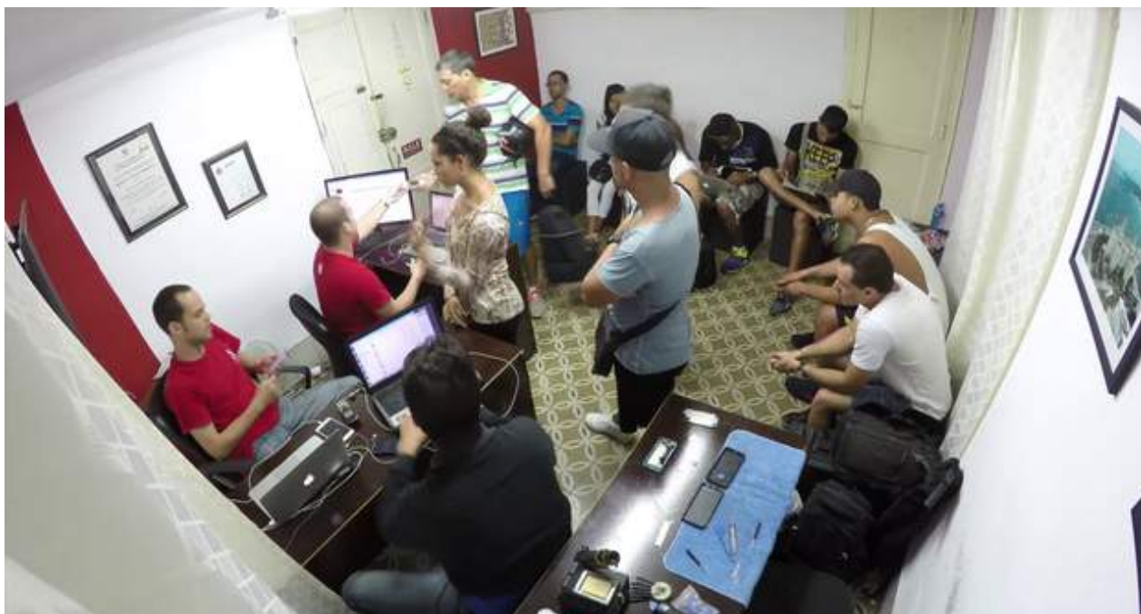
Taller Adictos al iPhone, en la calle Paseo entre 13 y 15, en La Habana.