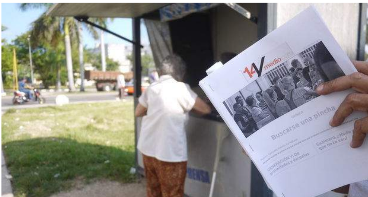
Un hombre lee la versión impresa de '14ymedio' que circula en formato PDF dentro de Cuba.