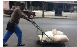
LOS RIESGOS DEL DELITO ECONÓMICO