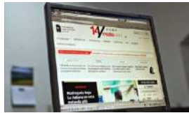
LECTORES OPINAN SOBRE '14YMEDIO' EN SU TERCER AÑO