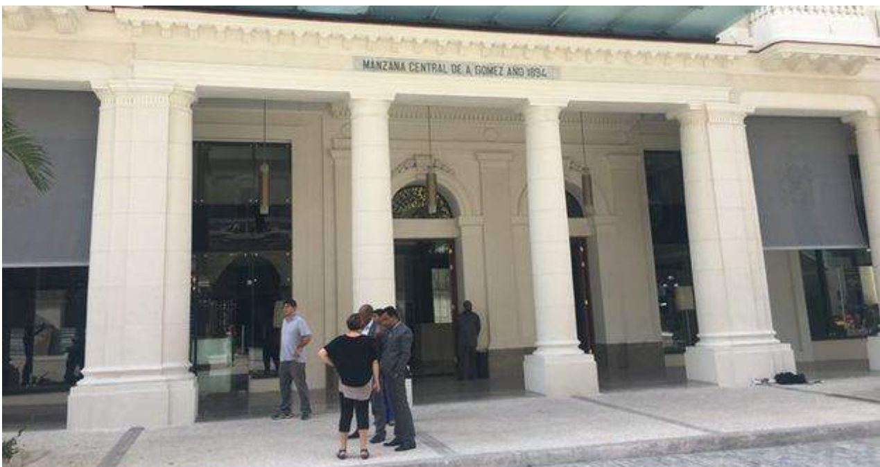
Pese a la apertura este lunes del Gran Hotel Manzana Kempinski La Habana, será oficialmente inaugurado en junio. (14ymedio)

Una selección con lo mejor de la semana del primer diario independiente hecho en Cuba