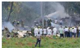
PEDIMOS TRANSPARENCIA CON LA TRAGEDIA AÉREA