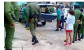
DOS MUJERES SON ASEINADAS EN CIENFUEGOS