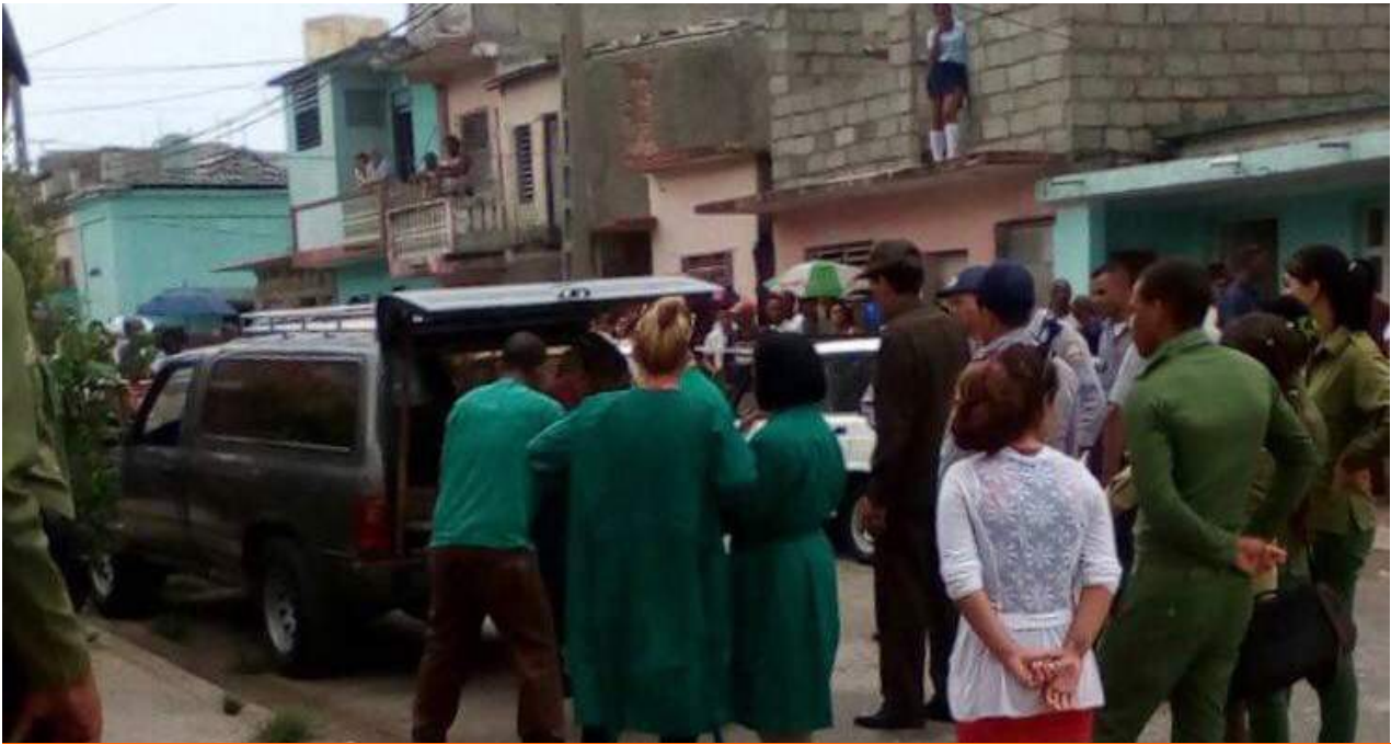
Una madre y su hija murieron atacadas con arma blanca.