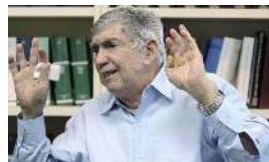
MUERE EN MIAMI LUIS POSADA CARRILES