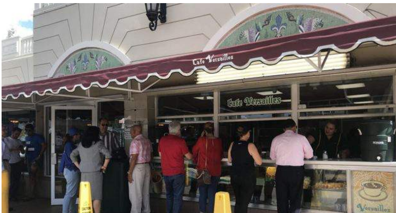
El café Versailles en Miami este miércoles.