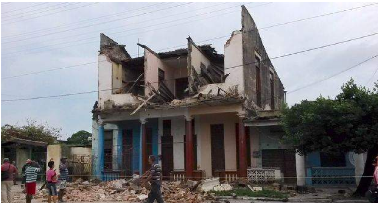
Fuertes lluvias han azotado el occidente cubano en la última semana.