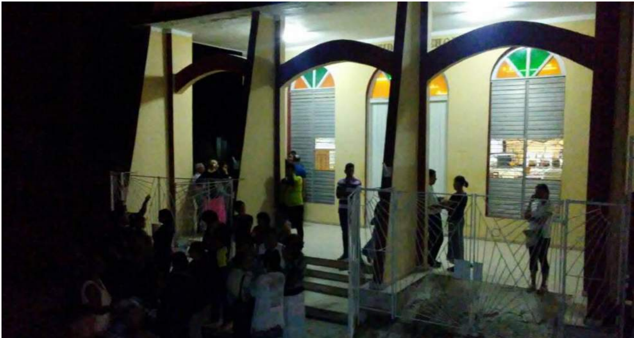
Diez parejas de miembros de la Iglesia del Nazareno, en Holguín, murieron en el accidente del vuelo de Cubana de Aviación.