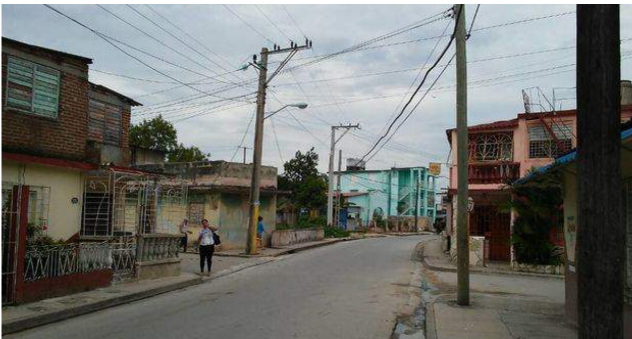
Las calles de Holguín amanecieron en un denso silencio.

Una selección con lo mejor de la semana del primer diario independiente hecho en Cuba