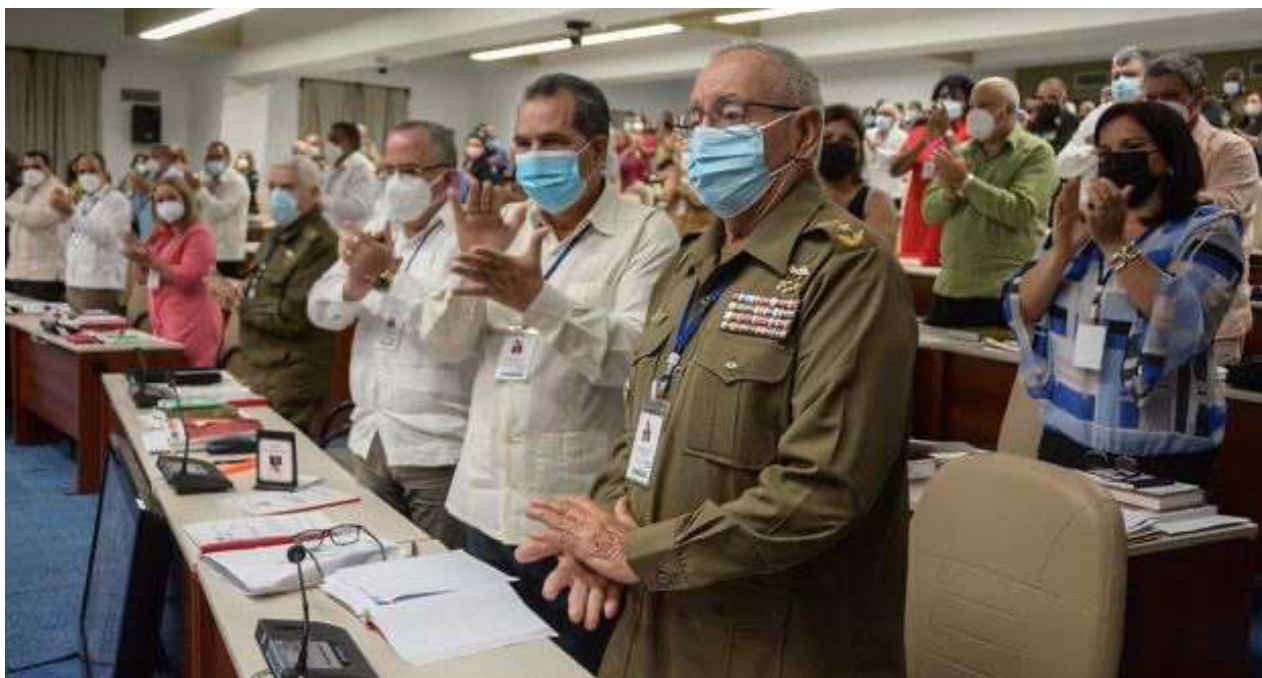
El general de Cuerpo de Ejército Ramón Espinosa Martín, flamante miembro del Buró Político del Comité Central.