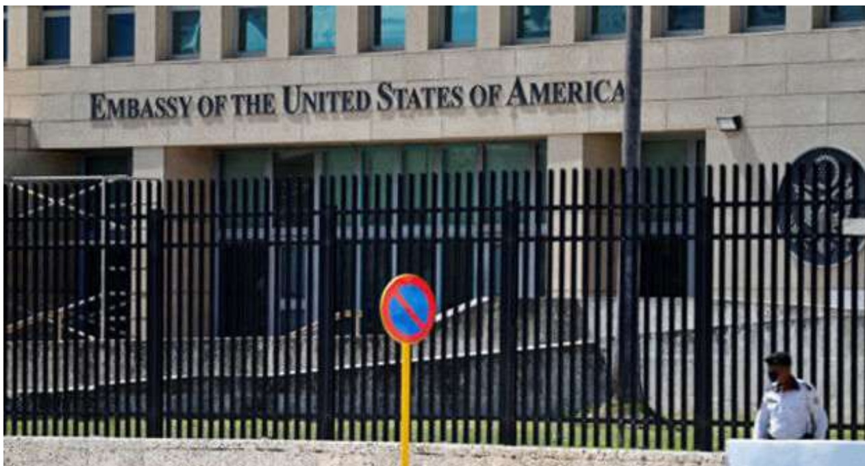
Foto de archivo del exterior de la Embajada de Estados Unidos en La Habana.