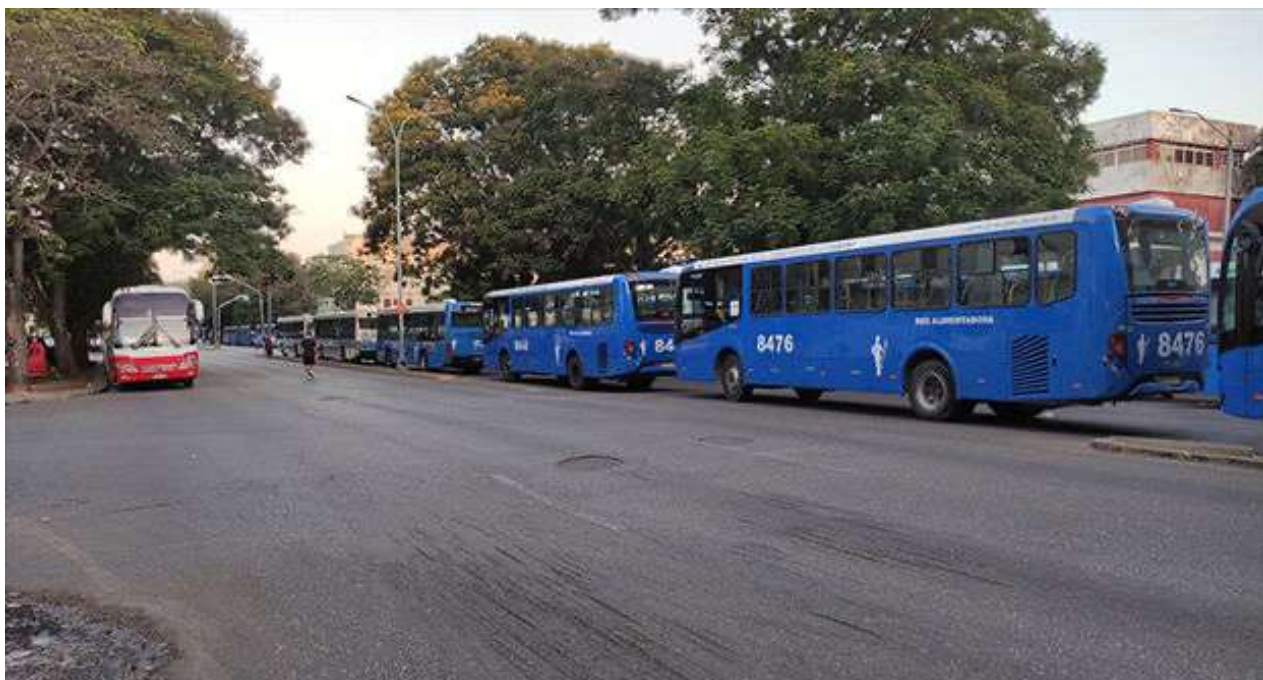
Guaguas en la avenida Carlos III y Rancho Boyeros, que trasladaron a los asistentes de la concentración del 1 de mayo. (14ymedio).