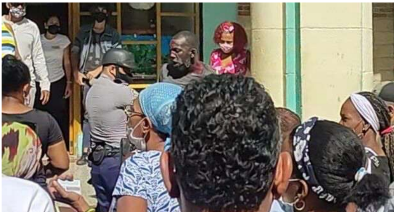
El ladrón fue capturado en la calle Galiano, en Centro Habana.