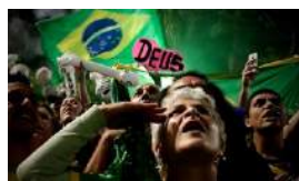
BOLSONARO COSECHA EL FRACASO DEL PT