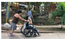
CUIDAR A ANCIANOS PARA TENER UNA CASA