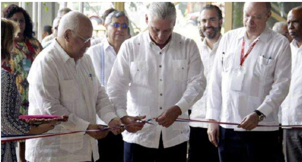
Díaz-Canel inauguró este lunes la 36 edición de la Feria Internacional de La Habana (Fihav).