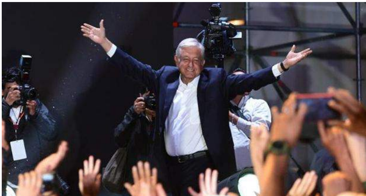
Andrés Manuel López Obrador asumirá la presidencia de México 30 días antes que Bolsonaro. (@PartidoMorenaMx)