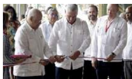
CUBA BUSCA INVERSORES ARRIESGADOS