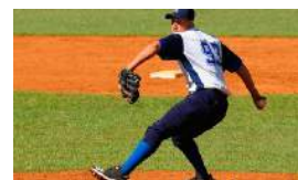
COMIENZA LA SEGUNDA FASE DE LA SERIE NACIONAL