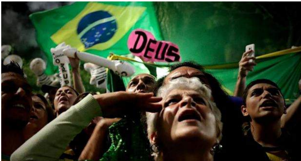
Seguidores de Jair Bolsonaro celebran su victoria en Sao Paulo.