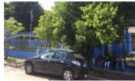
EL CONSULADO DE URUGUAY SE LLENA DE INTERESADOS