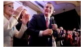
LA MAYORÍA DE CUBANOAMERICANOS RETIENE SU ESCAÑO