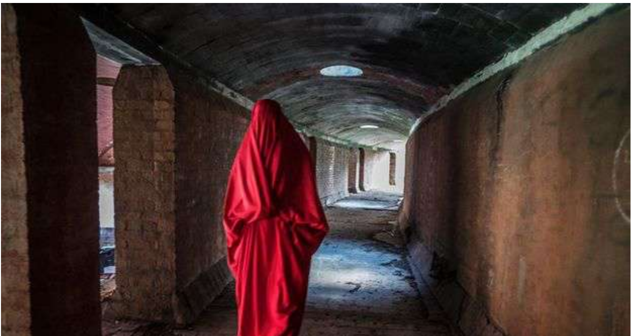
'Patriotismo 36-77' se produjo en gran medida gracias a una recaudación de fondos en la plataforma Verkami. (Pedro Coll)

Una selección con lo mejor de la semana del primer diario independiente hecho en Cuba