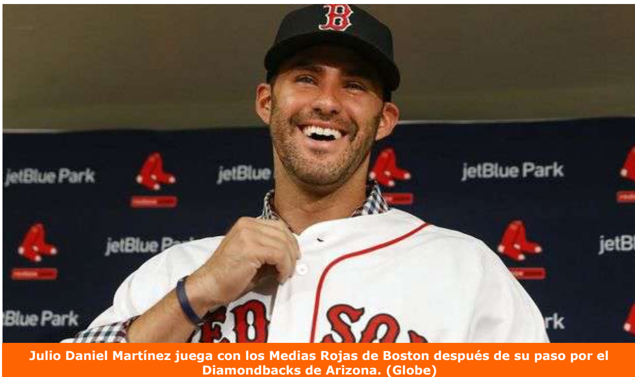
Julio Daniel Martínez juega con los Medias Rojas de Boston después de su paso por el Diamondbacks de Arizona.