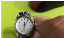
LLEGA LA POLÉMICA SOBRE EL CAMBIO DE HORARIO