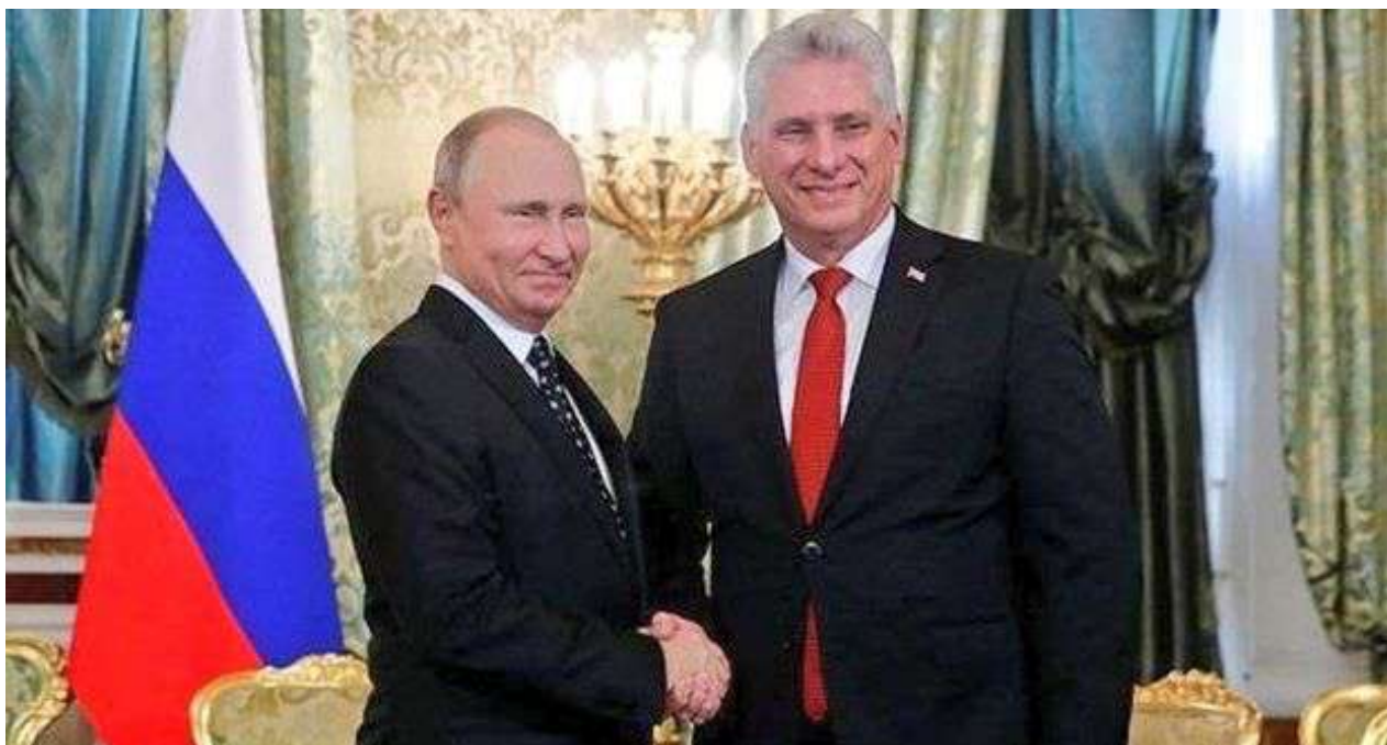
Miguel Díaz-Canel fue recibido por Vladímir Putin en su visita a Rusia.