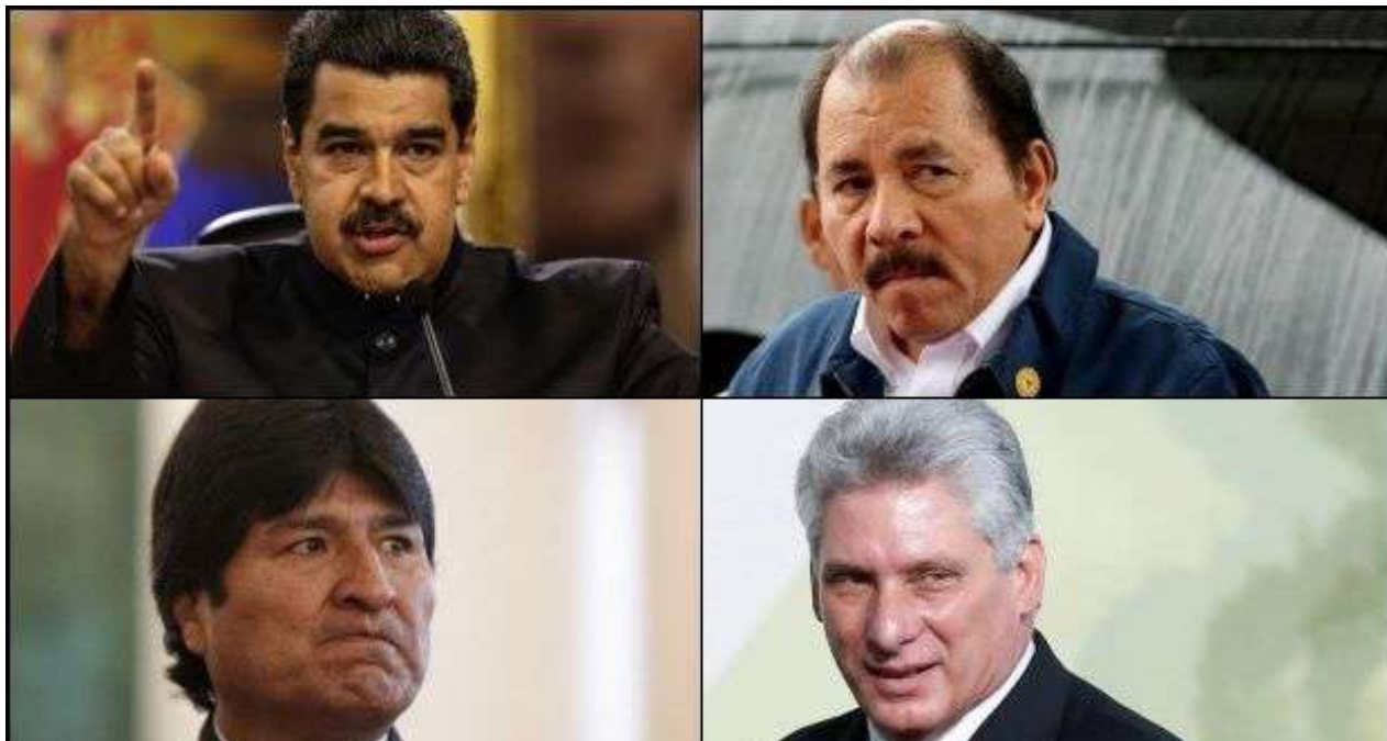
John Bolton delineó lo que será la política latinoamericana de Donald Trump. (Collage)