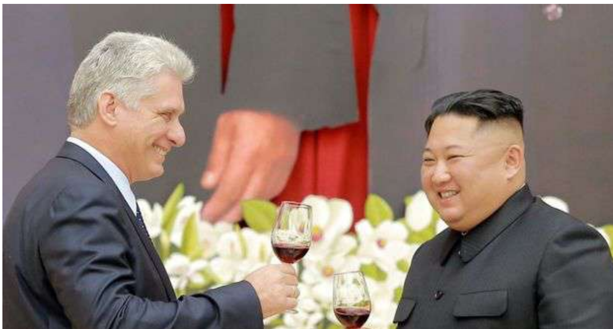
Miguel Díaz-Canel y Kim Jong-un brindan durante el banquete en Pyongyang.