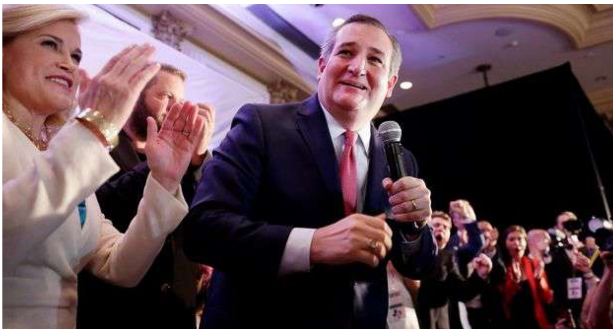
El republicano de padre cubano Ted Cruz mantuvo su escaño por Texas.