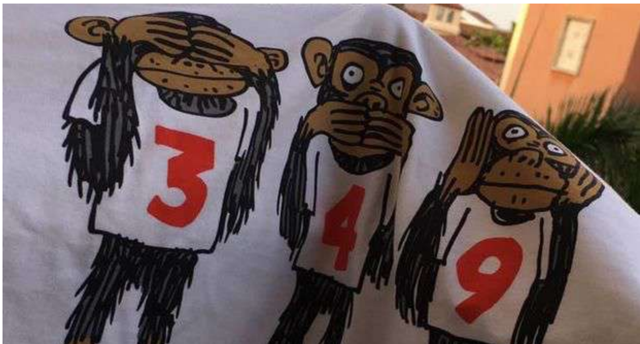
Pulóveres contra el Decreto 349 requisados por la Aduana cubana en el Aeropuerto Internacional José Martí de La Habana. (14ymedio)