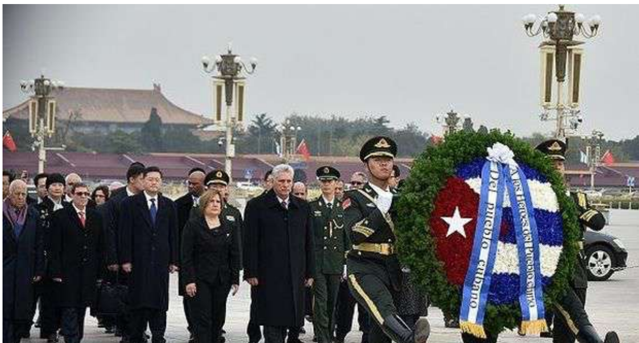
Díaz-Canel realizó una ofrenda floral en el Monumento de los Héroes del Pueblo en la Plaza de Tiananmén.