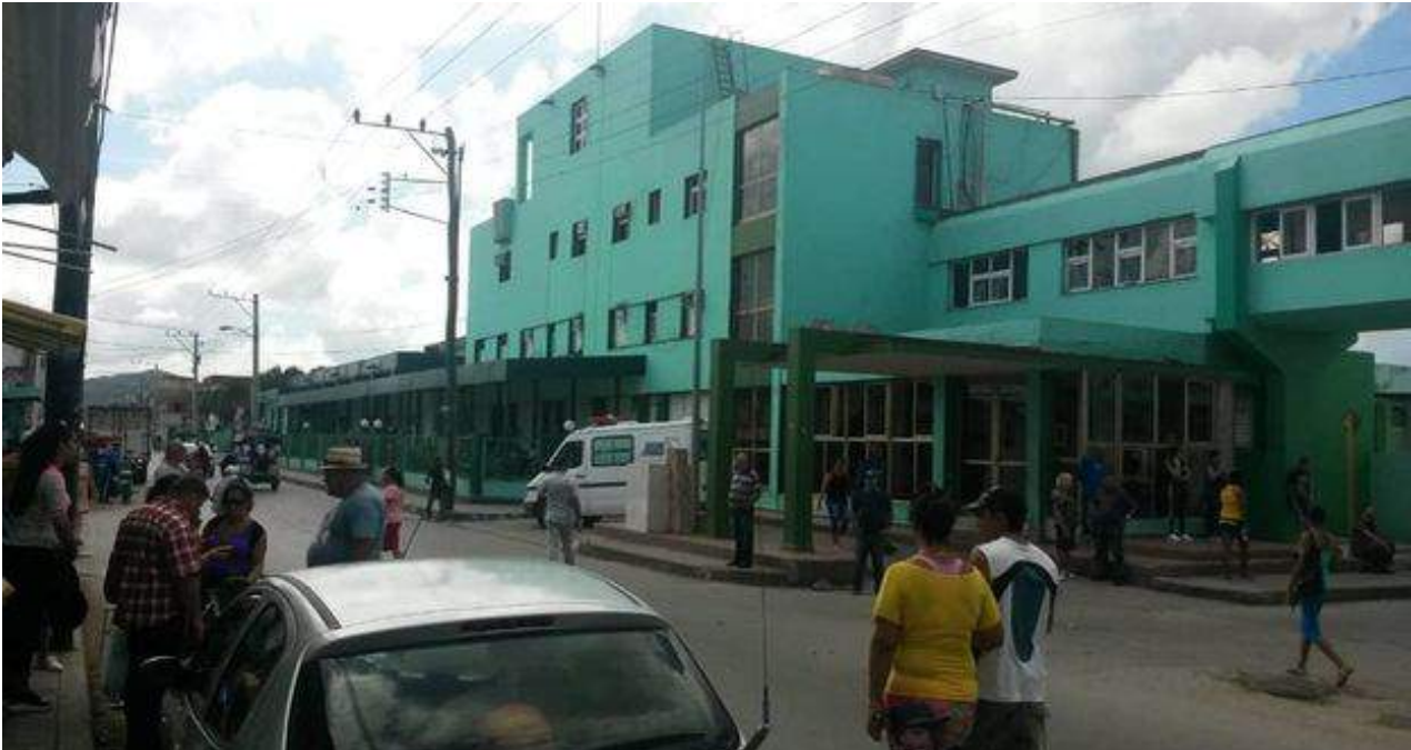
Cardiocentro Ernesto 'Che' Guevara en la ciudad de Santa Clara.