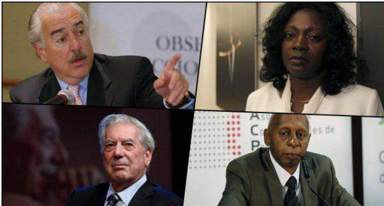
De izquierda a derecha y de arriba a abajo: Andrés Pastrana, Berta Soler, Mario Vargas Llosa y Guillermo Fariñas. (Collage)