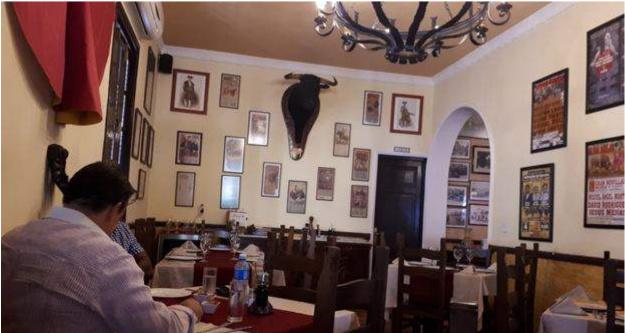
Tapas y Toros, una paladar de comida española en La Habana que este miércoles era un hervidero de preguntas sobre la visita de Pedro Sánchez. (14ymedio)