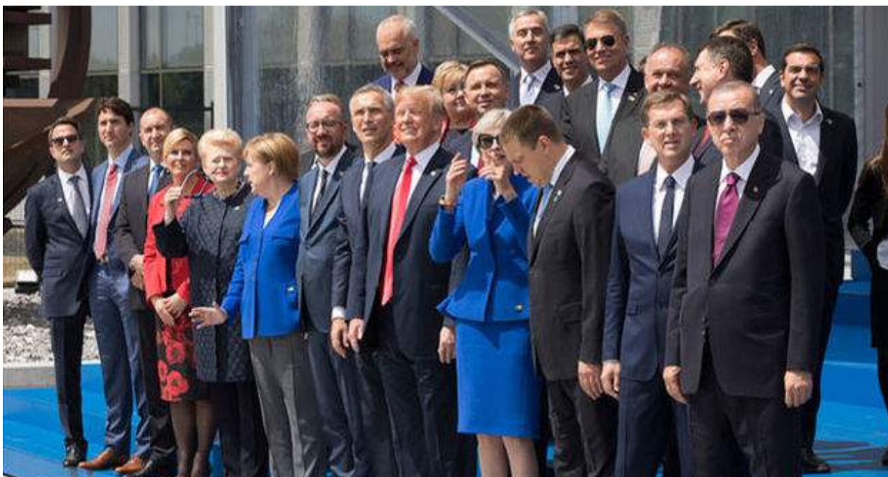
Donald Trump asistió a la última cumbre de la OTAN, otro de los organismos en los que se siente incómodo. (NATO)