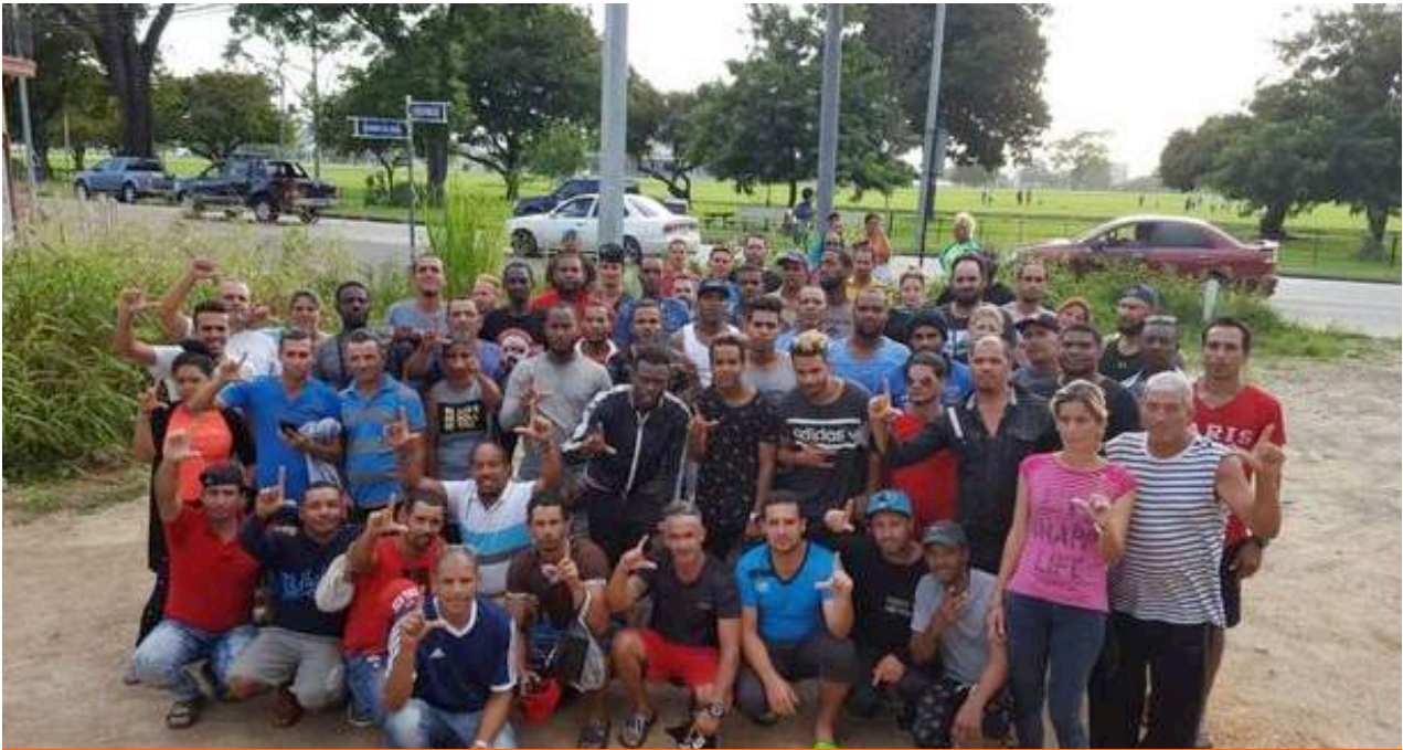
Los 78 cubanos están ahora pendientes de una reunión de su abogada con funcionarios de Naciones Unidas.