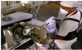
SIN HARINA PARA LOS NEGOCIOS PRIVADOS