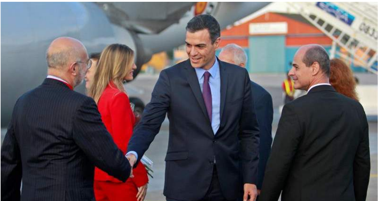
Durante su visita Sánchez se reunirá con empresarios y representantes de las numerosas empresas españolas presentes en Cuba.

Una selección con lo mejor de la semana del primer diario independiente hecho en Cuba