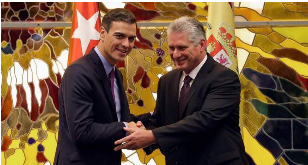
El presidente del Gobierno español, Pedro Sánchez, junto a Miguel Díaz-Canel tras la firma del memorando para las reuniones anuales en el futuro.