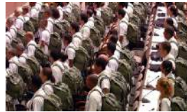
CUBA HACE POLÍTICA CON LAS BATAS BLANCAS