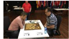
MAESTROS DEL AJEDREZ SE QUEJAN AL INDER