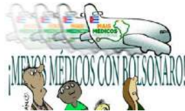
LA CRUZADA DE LA PRENSA OFICIAL CONTRA BOLSONARO