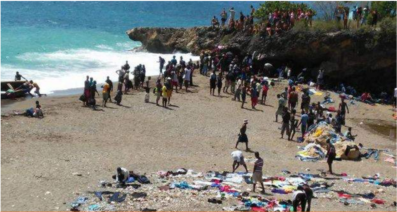
Vecinos de Baracoa secan sus pertenencias al sol tras el paso del huracán Matthew.