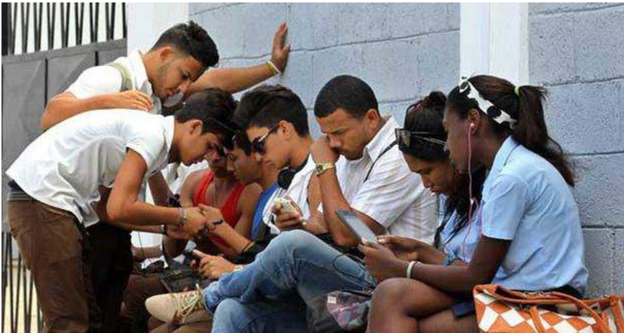
Un grupo de jóvenes se conecta a internet en una zona wifi de La Habana. (EFE)

Como toda propuesta artística la imagen resulta provocativa y polisémica. ¿Qué resulta más apropiado en la Cuba de hoy: descongelar el ambiente o comportarse como un pingüino?