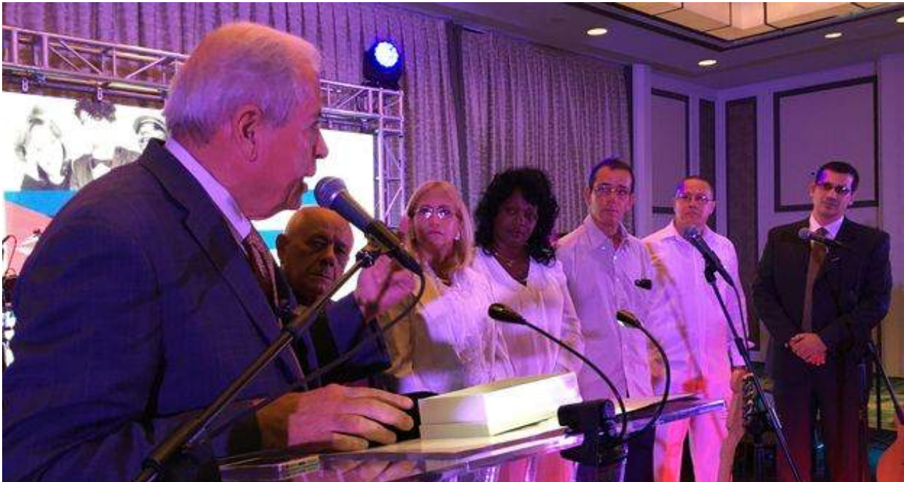
El alcalde de Miami, Tomás Regalado, improvisó un discurso al entregarle las llaves de la ciudad al Foro de Derechos y Libertades. (14ymedio)