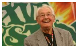
MUERE EL CINEASTA WAJDA