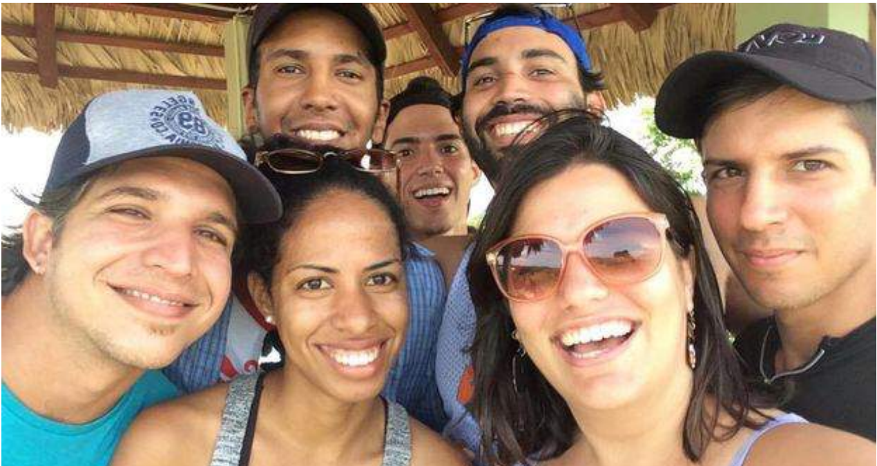
El equipo de Periodismo de Barrio antes de partir para Baracoa.

están aplastadas contra el suelo, como si un gigante hubiera pasado sobre ellas.