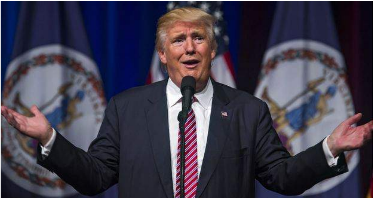
El candidato republicano a la presidencia de Estados Unidos, Donald Trump.