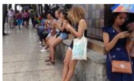
EL ROBO DE SALDO EN ZONAS WIFI