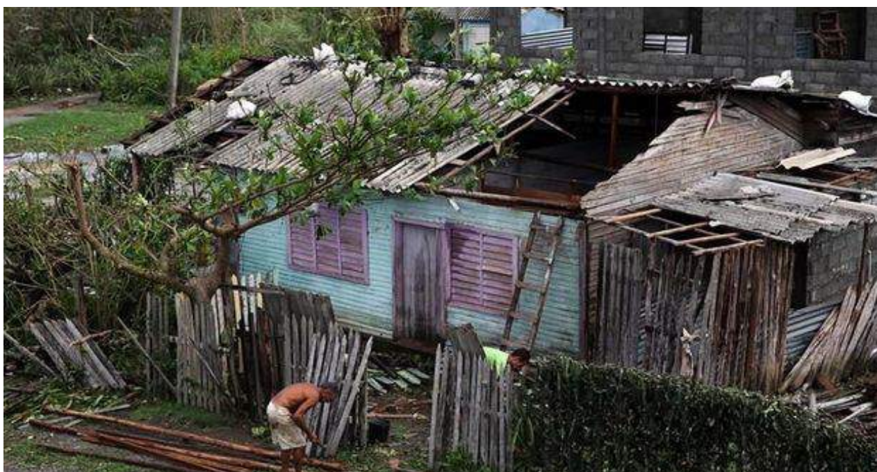
Las afueras de Baracoa tras el paso del huracán Matthew. (EFE)

Una selección con lo mejor de la semana del primer diario independiente hecho en Cuba