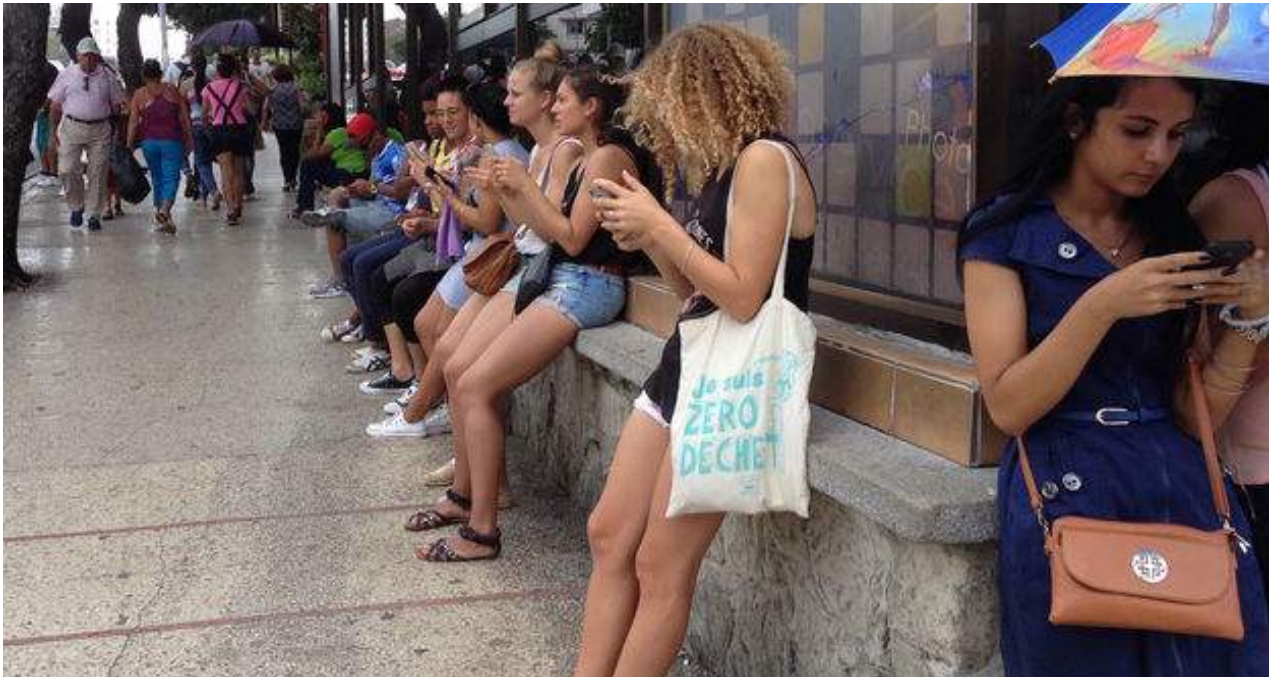
Zona wifi en La Rampa.