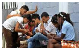
LOS NIETOS DE LA REVOLUCIÓN