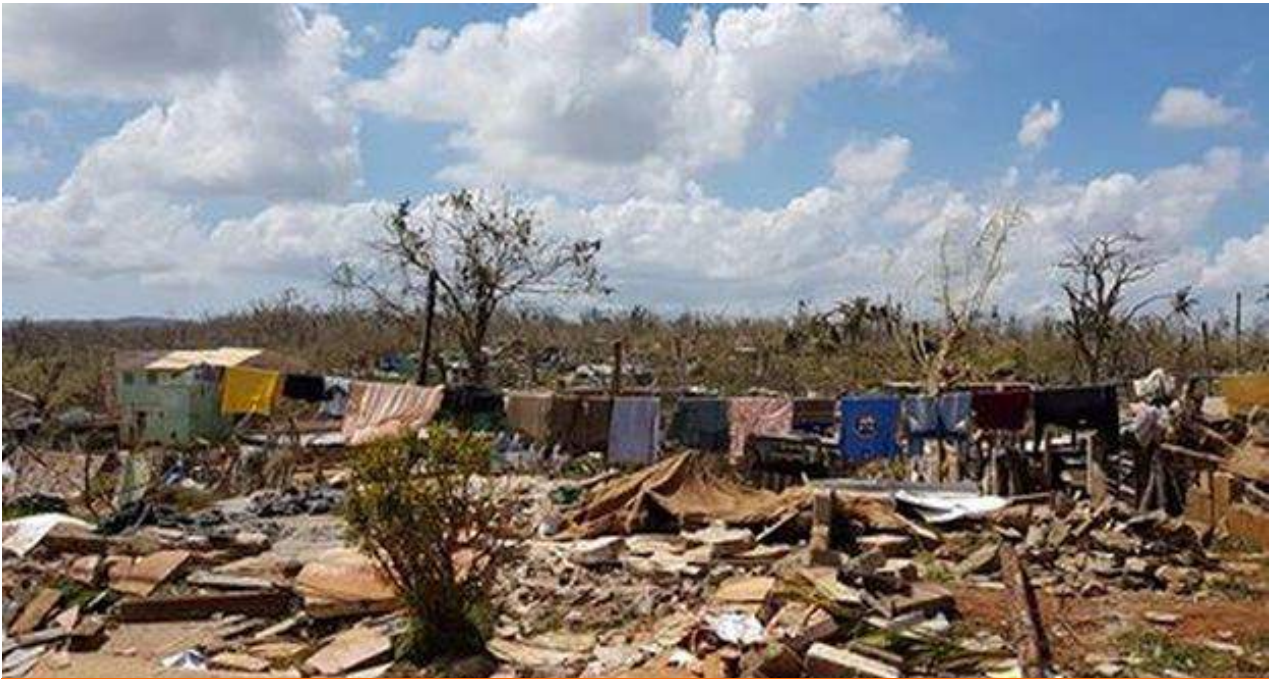
Baracoa después de Matthew.