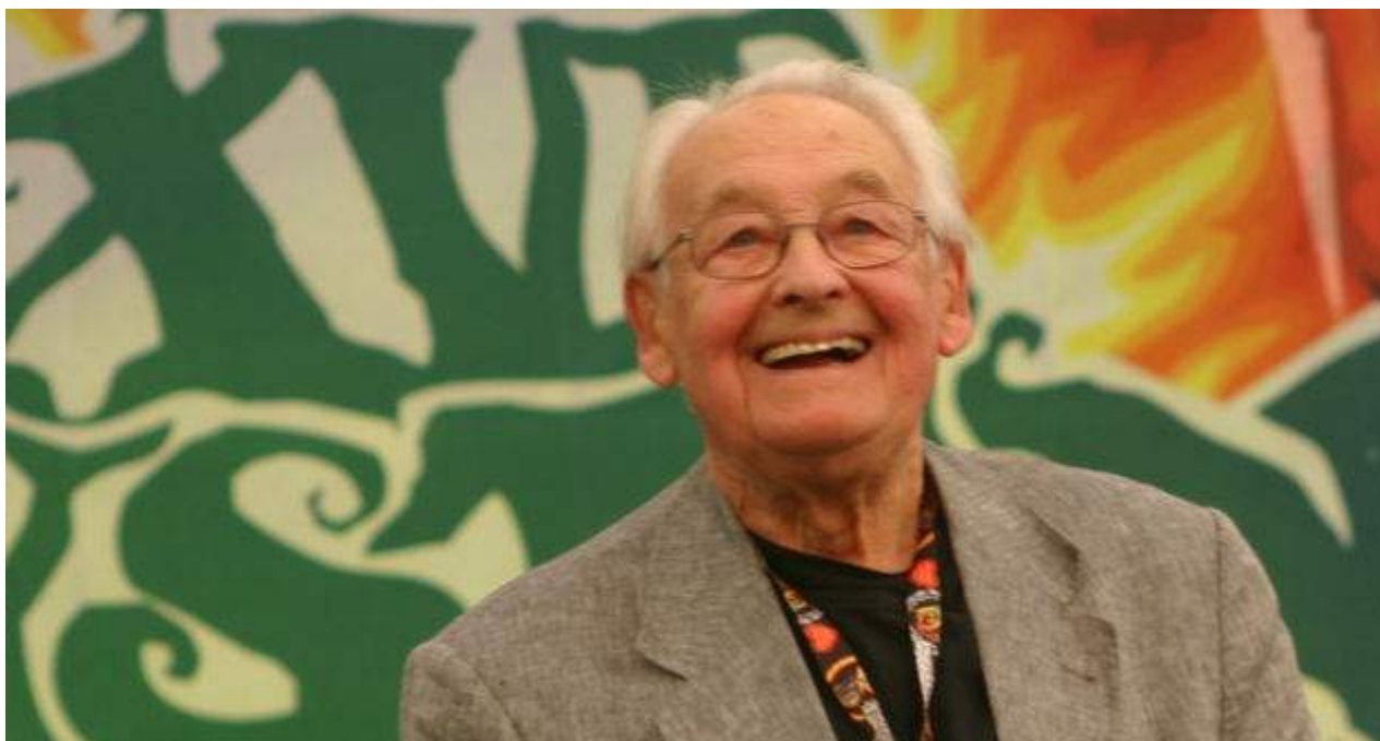
El director de cine polaco Andrzej Wajda.