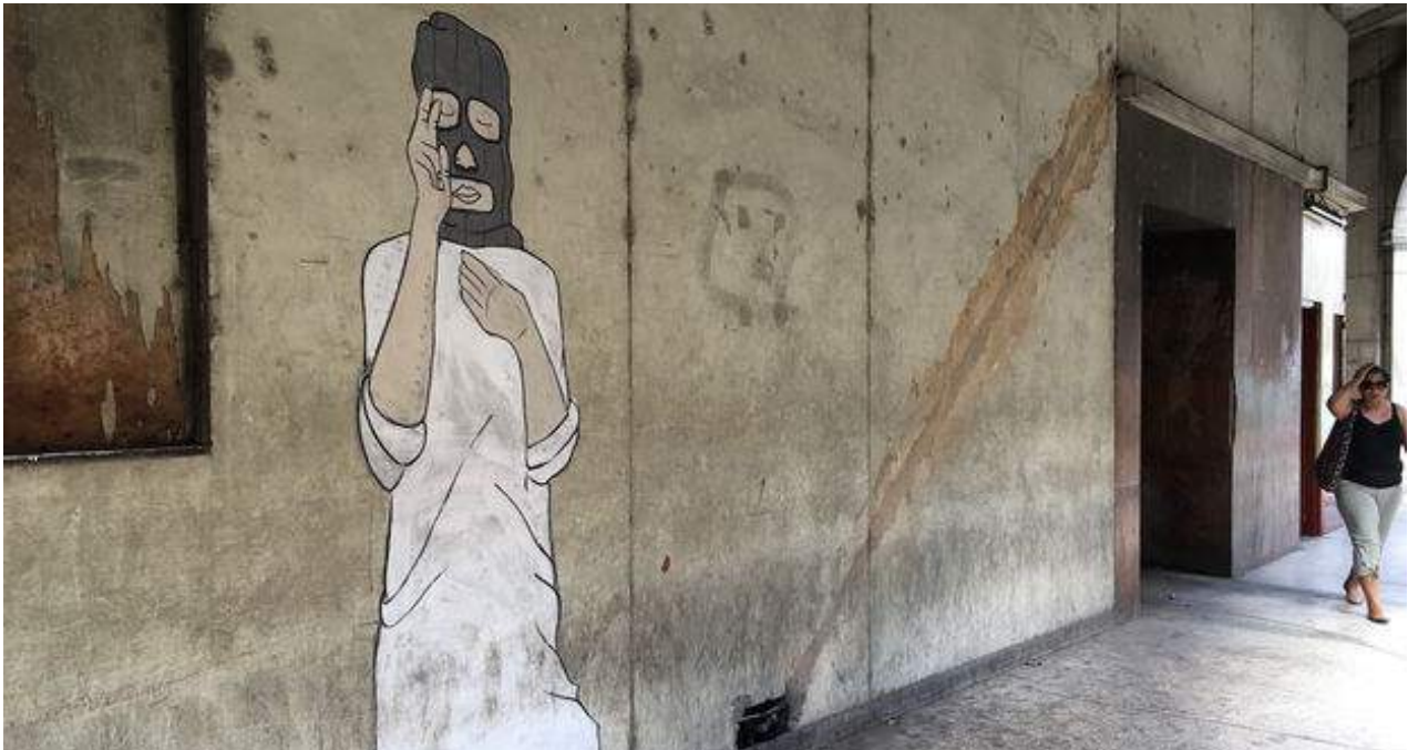
Grafiti de 2+2=5 en un muro de La Habana.