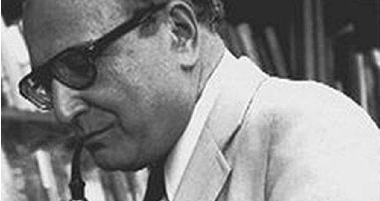
El sociólogo político Seymour Martin Lipset.

La historia ha demostrado que los populismos no consiguen sus propósitos y que al final reinan la miseria y la corrupción. Pero al liberalismo contemporáneo también le quedan asignaturas pendientes. El libro que lo explique detalladamente, exento de propaganda ideológica, está por escribir.