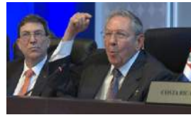
EL 'RAULISMO' FRENA EN SECO