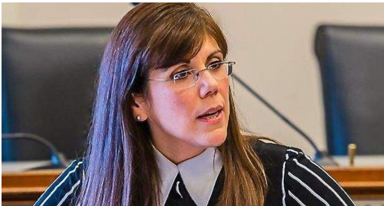
La experta cubanoamericana en política exterior y seguridad nacional cubanoamericana Yleem Poblete.