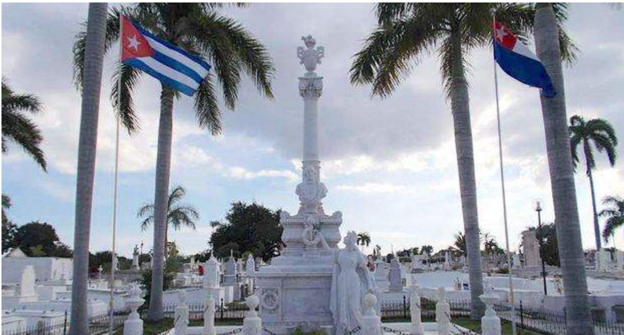
Panteón de Carlos Manuel de Céspedes en el cementerio de Santa Ifigenia, en Santiago de Cuba.