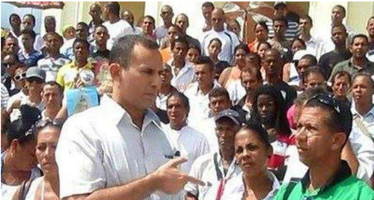
José Daniel Ferrer, líder de la organización opositora Unión Patriótica de Cuba (Unpacu), depuso este viernes su huelga de hambre.