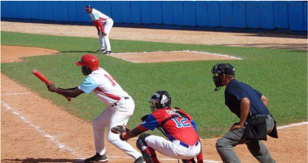
Los Tigres de Ciego de Ávila siguen en cabeza de la clasificación.