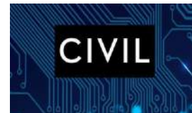
14YMEDIO SE UNE A UNA PLATAFORMA BLOCKCHAIN