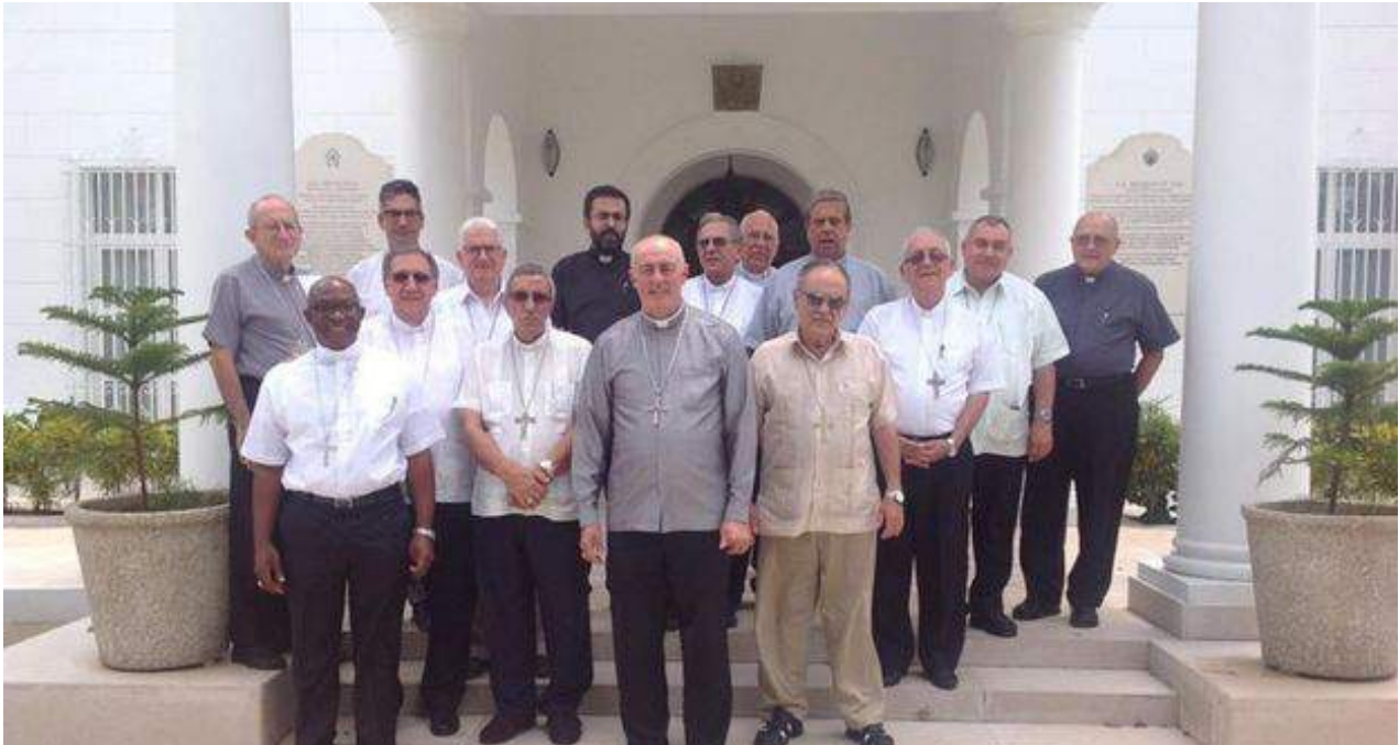
Los obispos cubanos trasladarán su opinión oficial sobre la reforma constitucional. (COCC)

Según reseñó la televisión estatal recibió diversas distinciones "por sus aportes a la defensa de la patria, su trayectoria y fidelidad a la causa revolucionaria". Al morir era militante del Partido Comunista, cuyo Comité Central integró desde 1980 hasta 2011