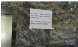
EL DENGUE SE EXTIENDE POR LA HABANA