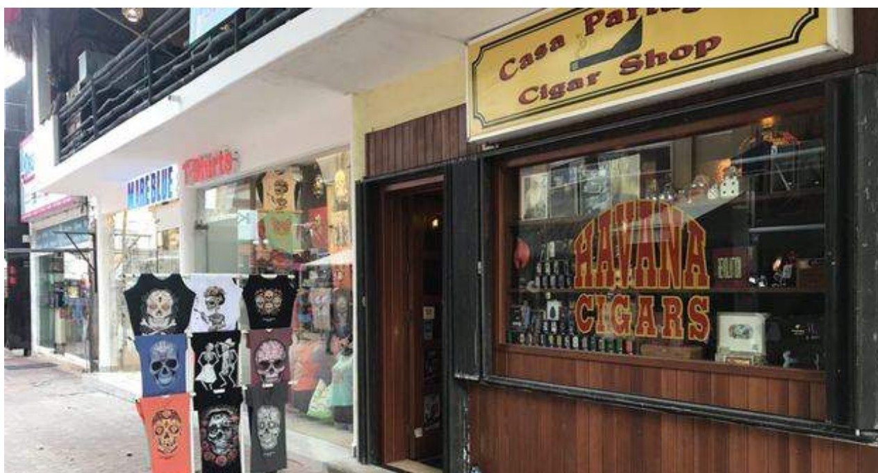
No es difícil encontrar en Cancún comercios con ron o tabacos. (14ymedio)

Una selección con lo mejor de la semana del primer diario independiente hecho en Cuba