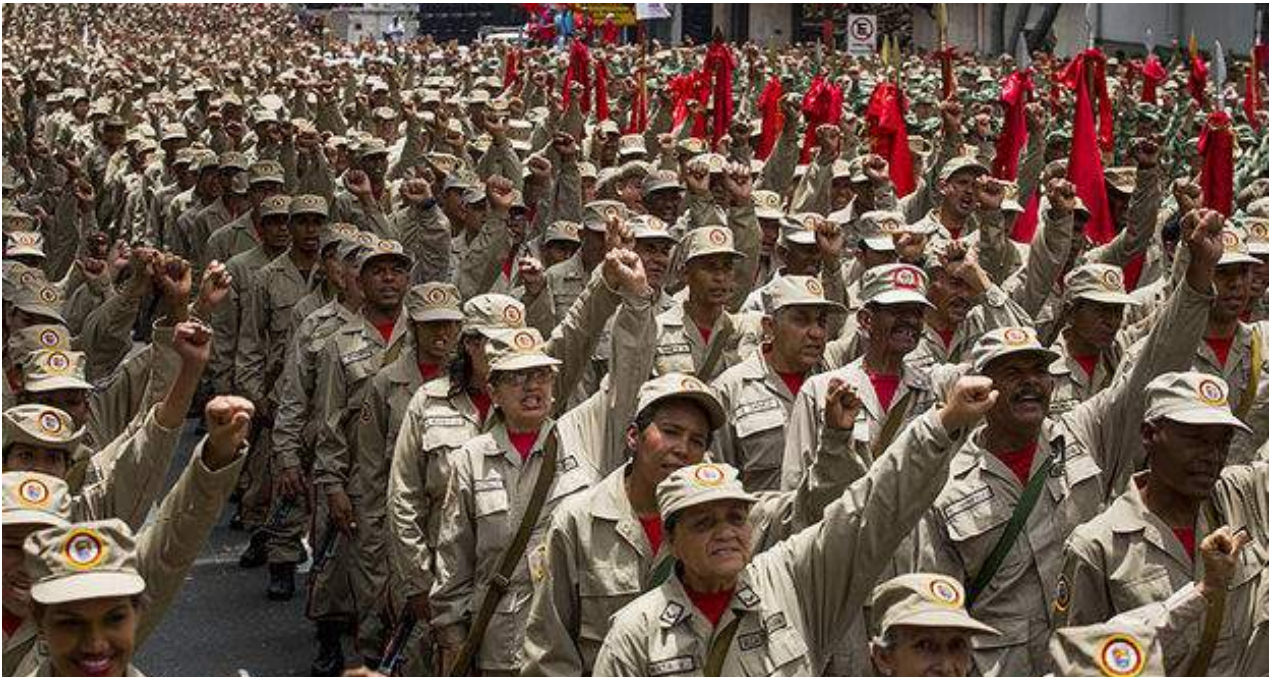
Soldados que rechazan la pretensión de convertirlos en campesinos de cuartel, sin que haya nadie que pueda brindar asesoría de cómo producir alimentos.