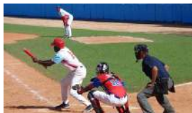
LA PARADOJA DE LA 58 SERIE NACIONAL