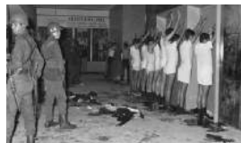
EL SILENCIO CUBANO ANTE TLATELOLCO