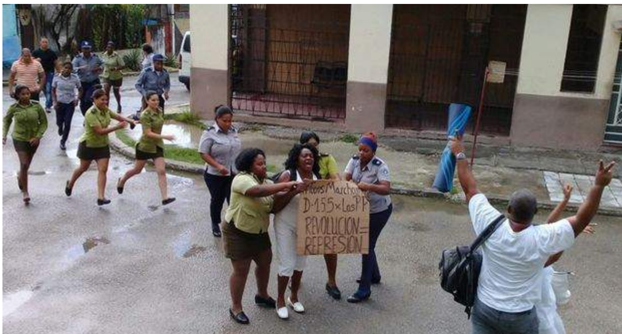
Berta Soler, líder de las Damas de Blanco, fue detenida durante una manifestación en La Habana. (Damas de Blanco)