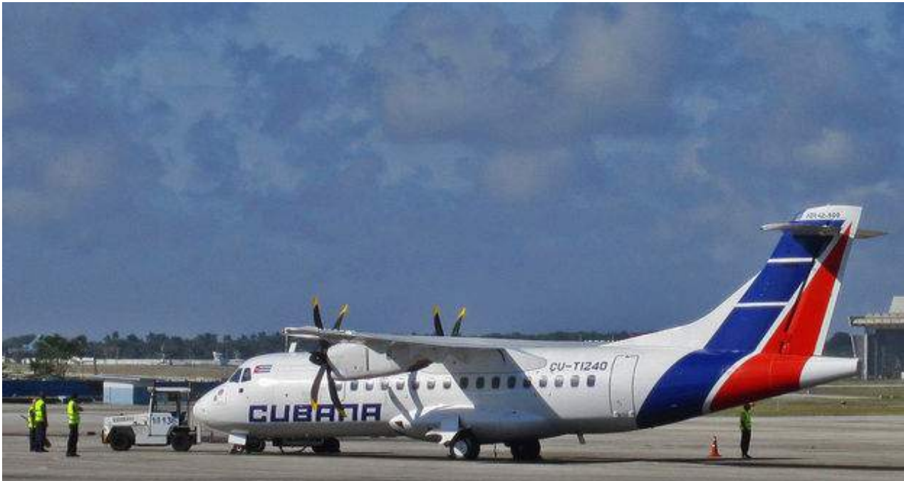
La reapertura de los itinerarios se cubrirá con aviones modelo ATR 72-500.