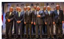
CUBA, VENEZUELA Y NICARAGUA SON "ESTADOS CRIMINALES"