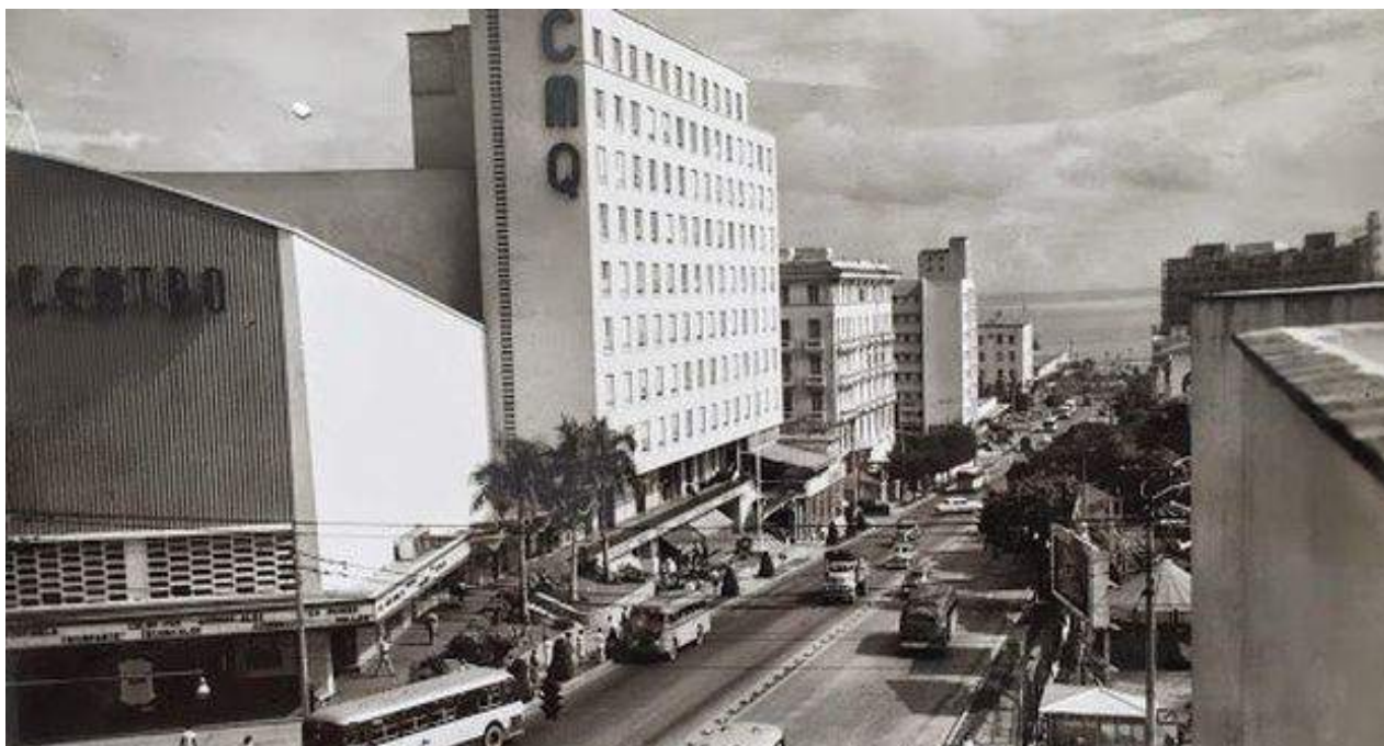
La Rampa y la calle 23 en tiempo de La Habana republicana. (CC)