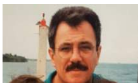
FALLECE EL EXAGENTE FLORENTINO ASPILLAGA