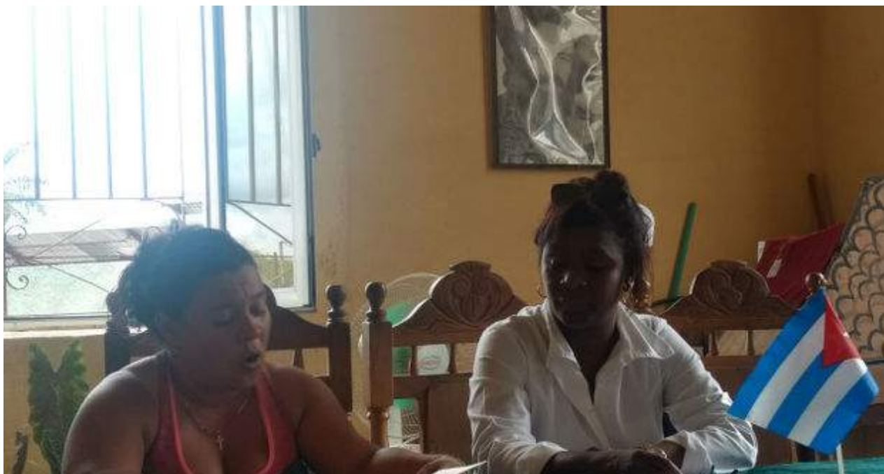
Debate en un hogar de ancianos en Camagüey el pasado 16 de octubre.