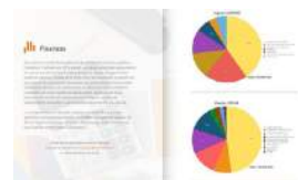
CARTA A LOS MIEMBROS DE 14YMEDIO