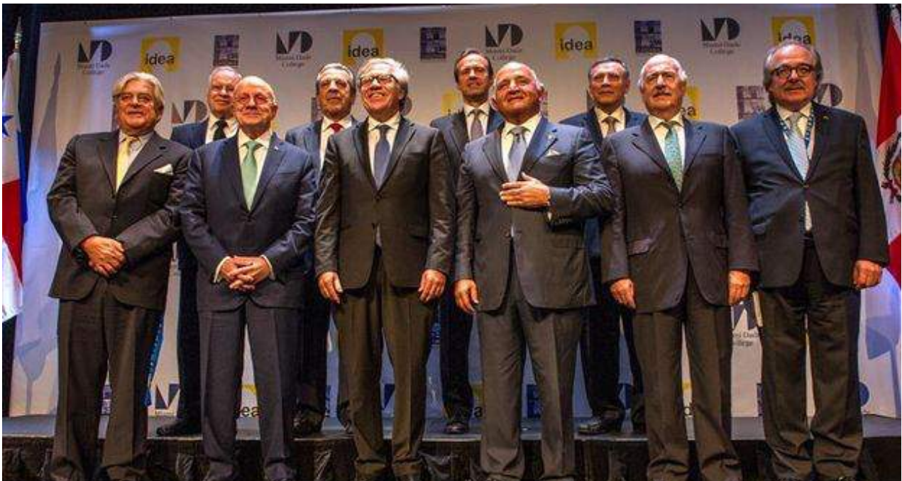
El foro, organizado por IDEA, contó con la presencia del secretario general de la OEA, Luis Almagro, y de expresidentes latinoamericanos.