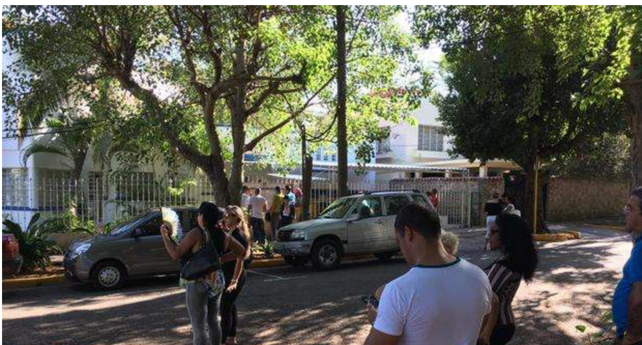
Los curiosos se acercaron a la embajada panameña para interesarse por el nuevo carné de compras.

Una selección con lo mejor de la semana del primer diario independiente hecho en Cuba