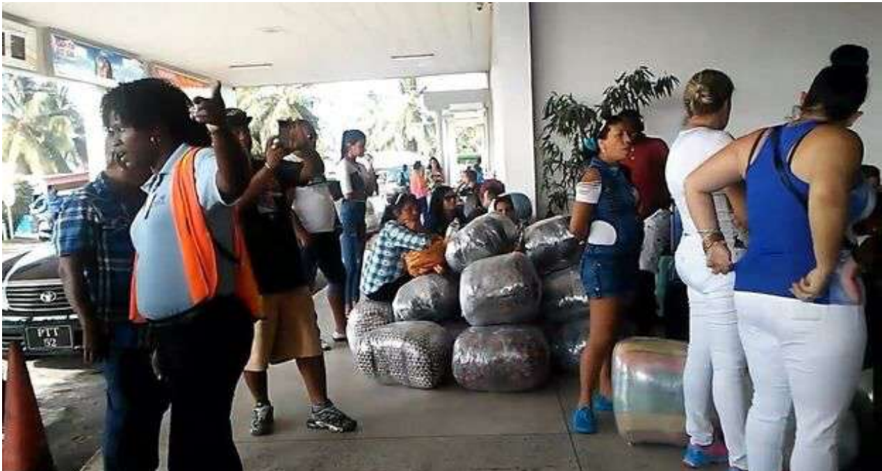
Mulas en el aeropuerto de Georgetown, Guyana.