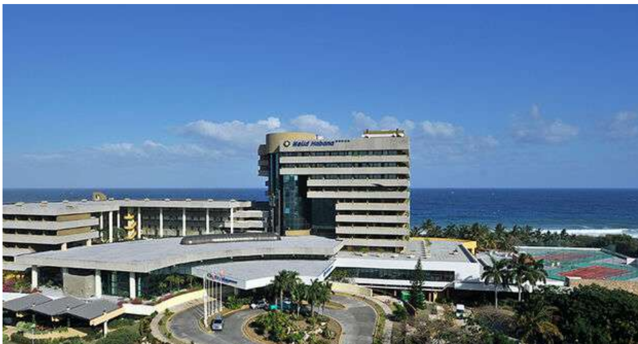
El Hotel Meliá Habana fue inaugurado el 30 de septiembre de 1998 por Fidel Castro.