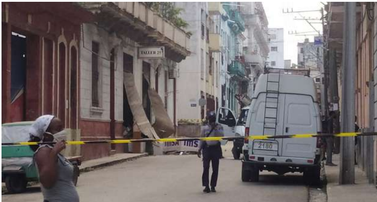
El desplome de un edificio en las calle Lucena y San Rafael, en Centro Habana, deja sin techo a varias familias.