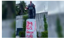
CONMIGO NO CUENTEN, POR YOANI SÁNCHEZ