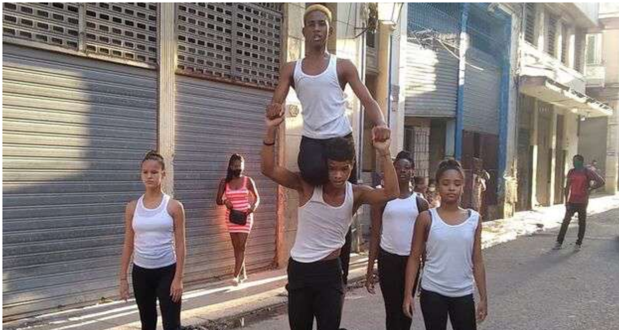
Acto de repudio disfrazado de "jornada cultural" a cargo de las autoridades municipales de La Habana Vieja.