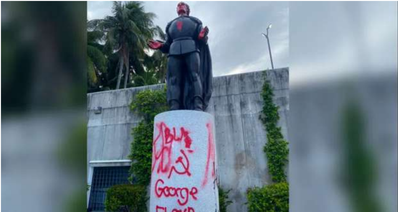
Estatua de Cristóbal Colón vandalizada en Miami.