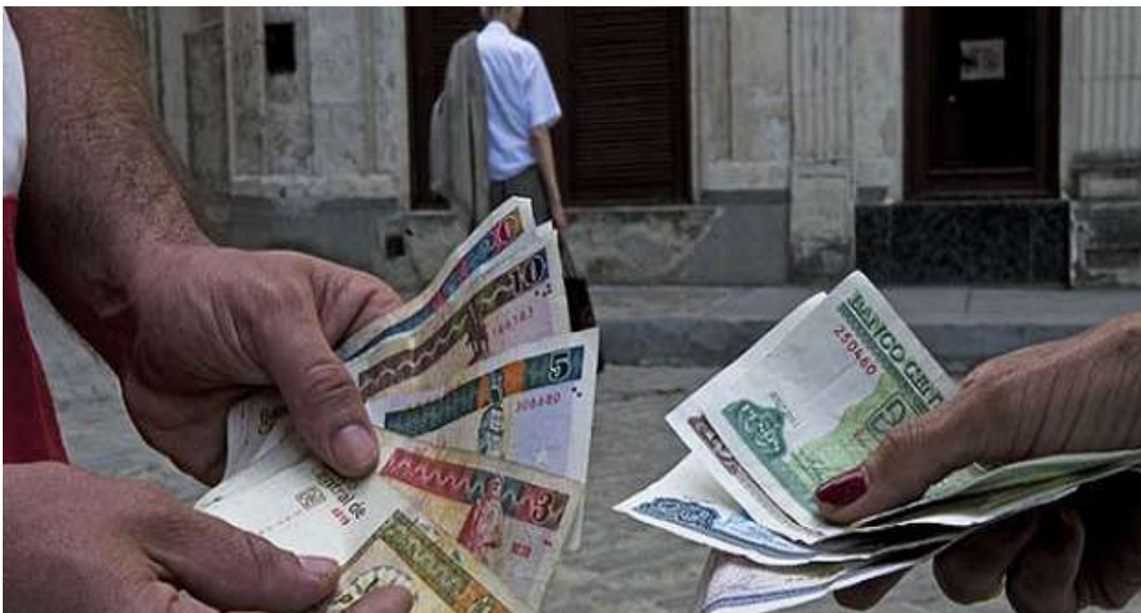
La incertidumbre ante el fin del CUC sigue entre los cubanos.

"En los puntos de venta de Pastorita ya no hay nada. Ni jabón, ni desodorante, nada. Pareciera que las tiendas TRD [donde se compra en CUC] pasaron a ser propiedad de Ciego Montero porque lo único que tienen es agua", se lamenta.