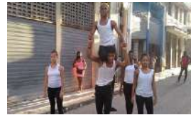
EMPLEADOS DE CULTURA EN UN ACTO DE REPUDIO