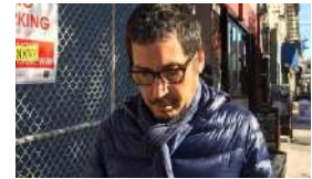
"EL MURO DE BERLÍN NO SE CAYÓ SOLO"