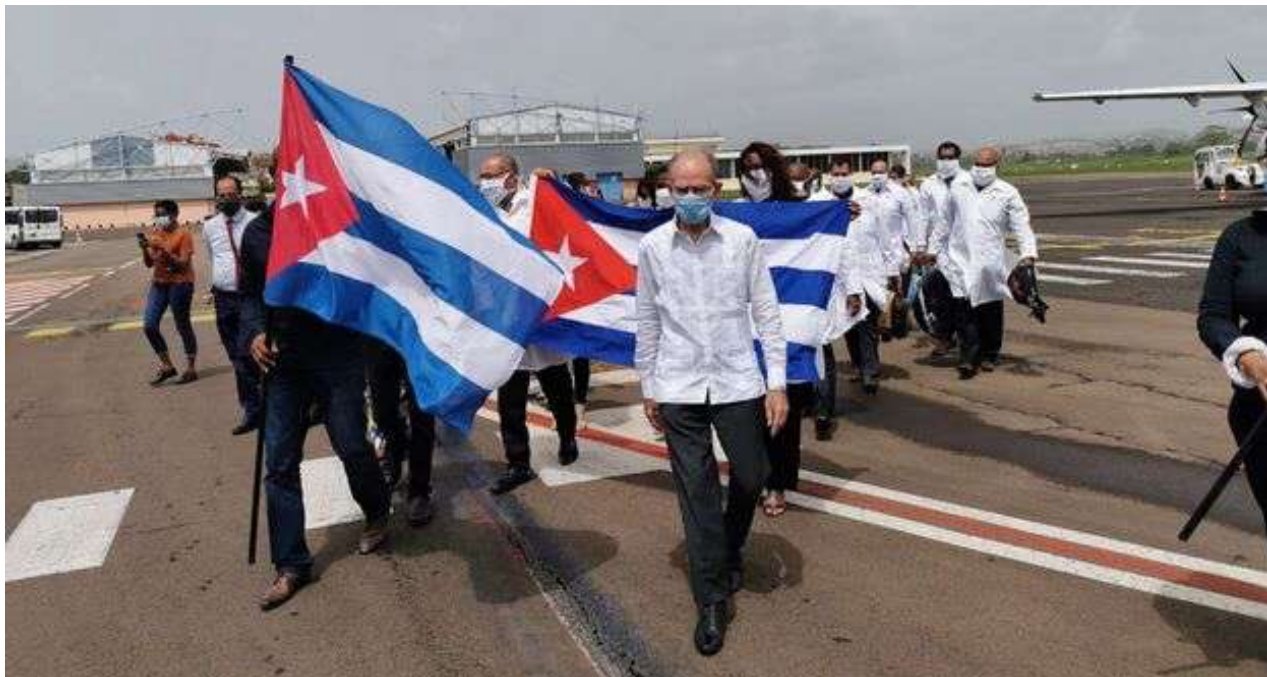
La misión de médicos cubanos a su llegada al aeropuerto de Martinica, el pasado junio. (Twitter/@CTM_Martinique)