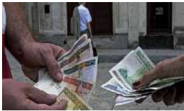
EL ACTA DE DEFUNCIÓN DEL CUC