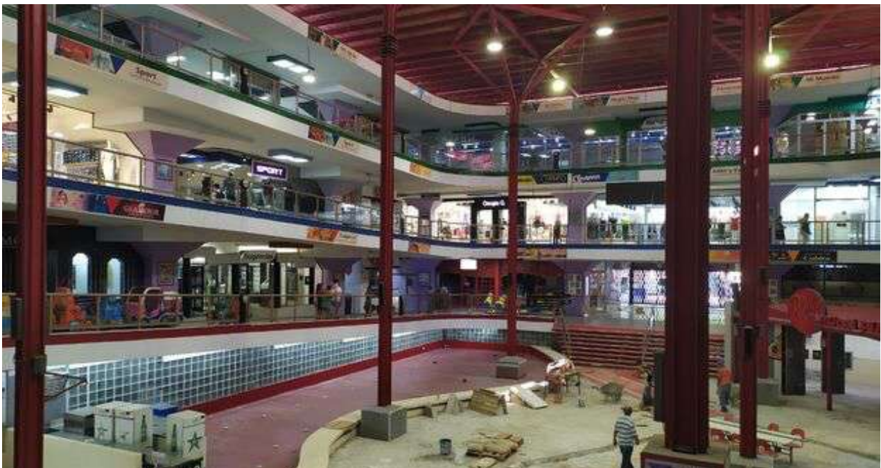
Como muchos vecinos temían, la Plaza Carlos III reabrió sus puertas con venta exclusiva en MLC.

Una selección con lo mejor de la semana del primer diario independiente hecho en Cuba