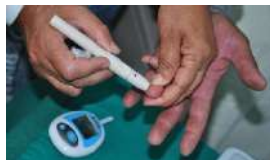
LOS DIABÉTICOS SE QUEDAN SIN GLUCÓMETROS