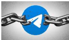
BLOQUEADO TELEGRAM EN CUBA