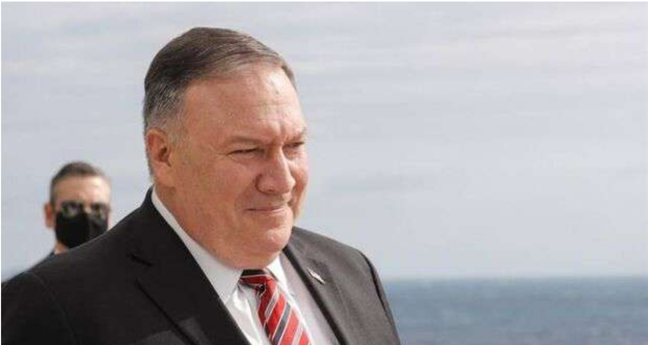
El secretario de Estado de EE UU, Mike Pompeo.