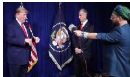
DONALD TRUMP CONVERSA CON ALEX OTAOLA