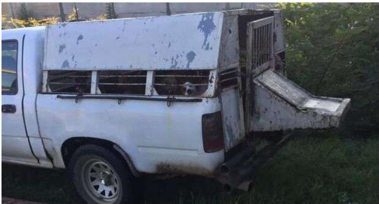
Vehículo de Zoonosis para la recogida de animales callejeros.