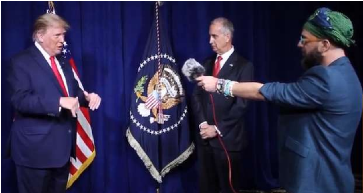
Trump concedió la entrevista a Otaola en el club de golf Trump National Doral de Miami. (Captura)