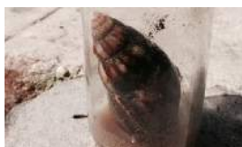
EL PELIGROSO CARACOL AFRICANO SE EXTIENDE EN CUBA