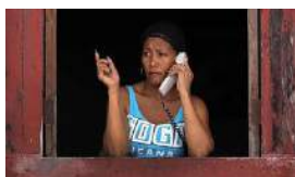
LOS TELÉFONOS FIJOS RESUCITAN CON NAUTA HOGAR