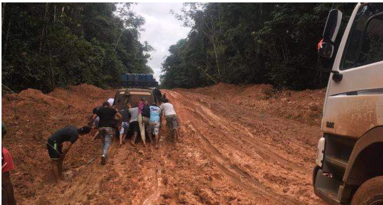
Cientos de cubanos cruzan las selvas de Guyana y Brasil para emigrar a Latinoamérica.