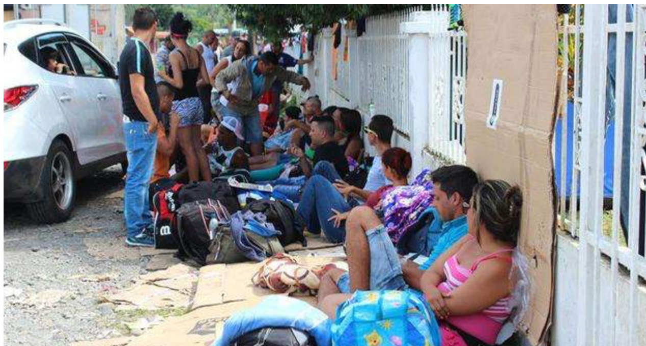
Un grupo de migrantes cubanos en Pasos Canoa (Panamá) durante la crisis de 2015.