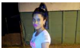
UN NUEVO CASO DE FEMINICIDIO CONMOCIONA EL PAÍS