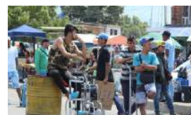
LA ESTAMPIDA DE VENEZOLANOS PONE EN JAQUE LA REGIÓN