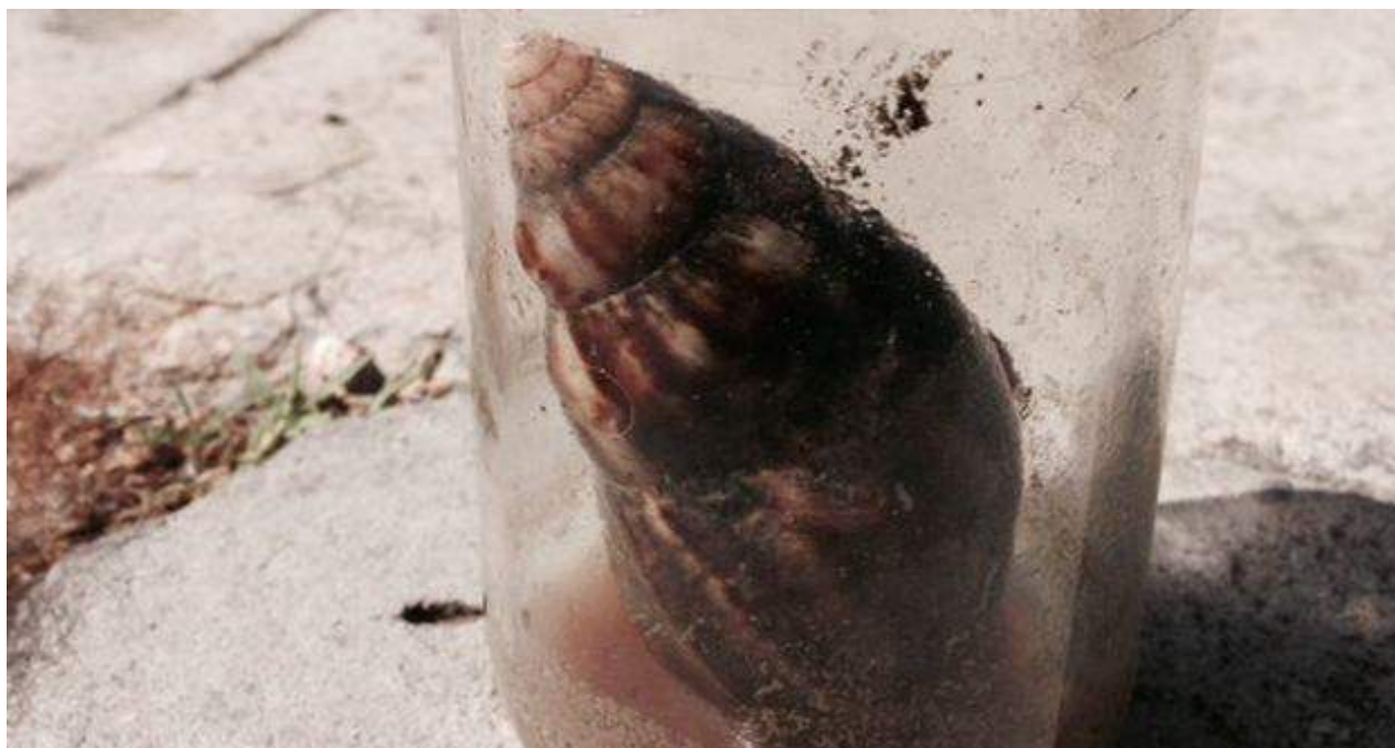
Caracol gigante africano atrapado en Cuba.