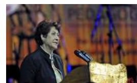
DE CONVENIENCIAS Y GEOGRAFÍAS, POR YOANI SÁNCHEZ