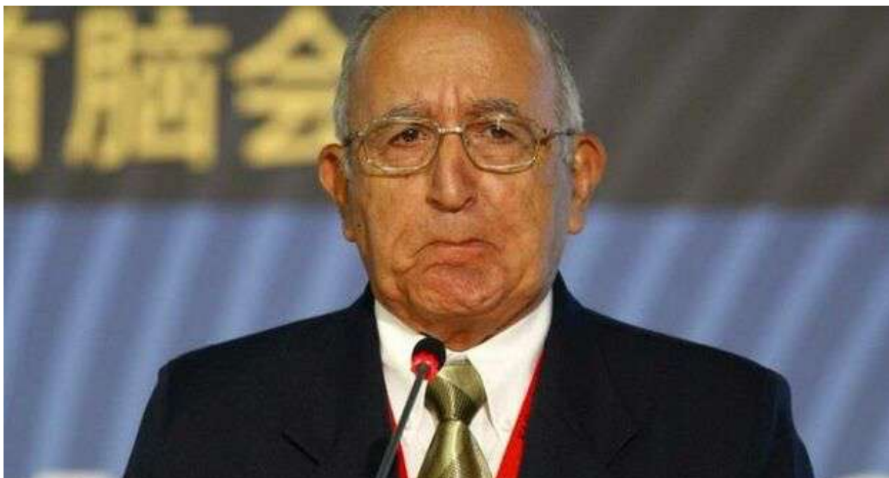
Ulises Rosales del Toro en 2009, cuando fue elegido vicepresidente del Consejo de Ministros.