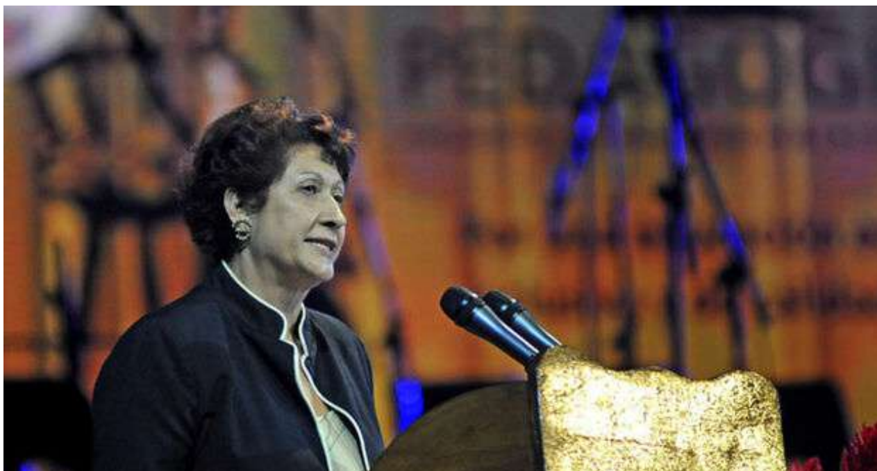
La ministra de Educación de Cuba, Ena Elsa Velázquez Cobiella.