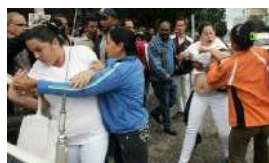
UNPACU Y CUBA DECIDE CONVOCAN A SALIR A LA CALLE