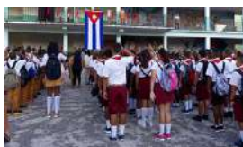
"TRATAMIENTO IDEOLÓGICO" EN LAS ESCUELAS