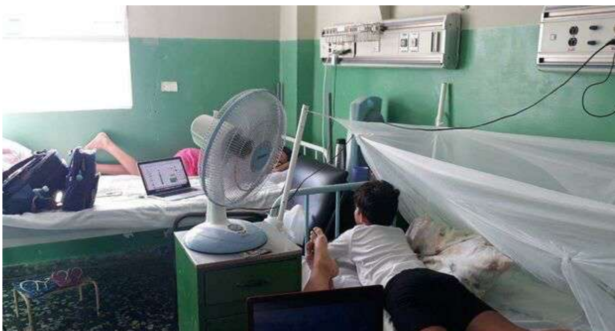
Desde inicios del verano los hospitales de la capital, sobre todo los infantiles, están colapsados recibiendo casos de pacientes con síntomas de dengue.

Una selección con lo mejor de la semana del primer diario independiente hecho en Cuba