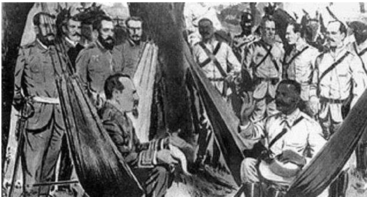
El encuentro entre ambos generales, el español y el mambí, tuvo lugar el 15 de marzo de 1878 en un remoto punto de la geografía rural de Cuba.