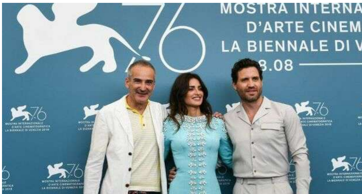
Penélope Cruz, Edgar Ramírez y Olivier Assayas en el pase de prensa de Wasp Network en la Mostra de Venecia.