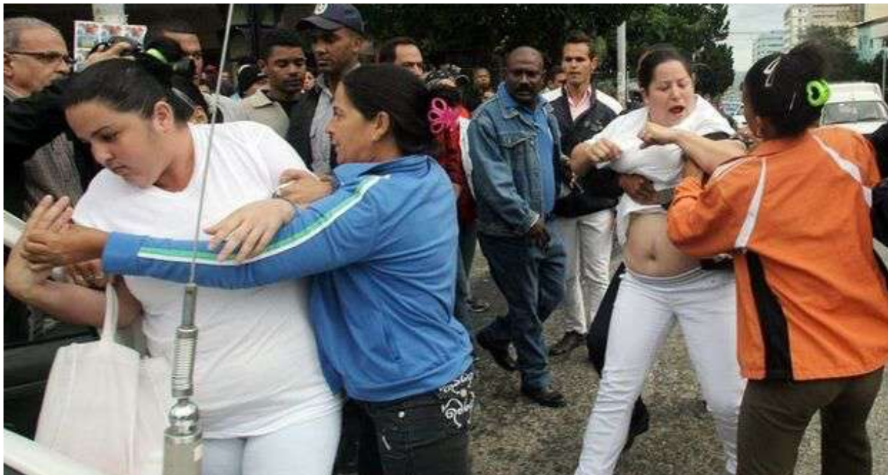
Los organizadores mostraron su solidaridad con el Movimiento de las Damas de Blanco "reprimidas semana tras semana por la dictadura".

La vieja Europa occidental es más explotadora que la Europa oriental, la excomunista, que sí entiende lo que sucede en Cuba y lo que siente el pueblo cubano.