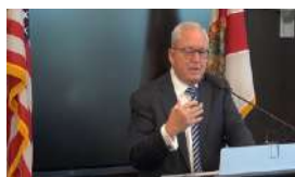
ENTREVISTA CON OTTO REICH SOBRE CUBA