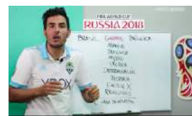
"CUBA TIENE QUE IR A UN MUNDIAL, PERO CON TODOS"