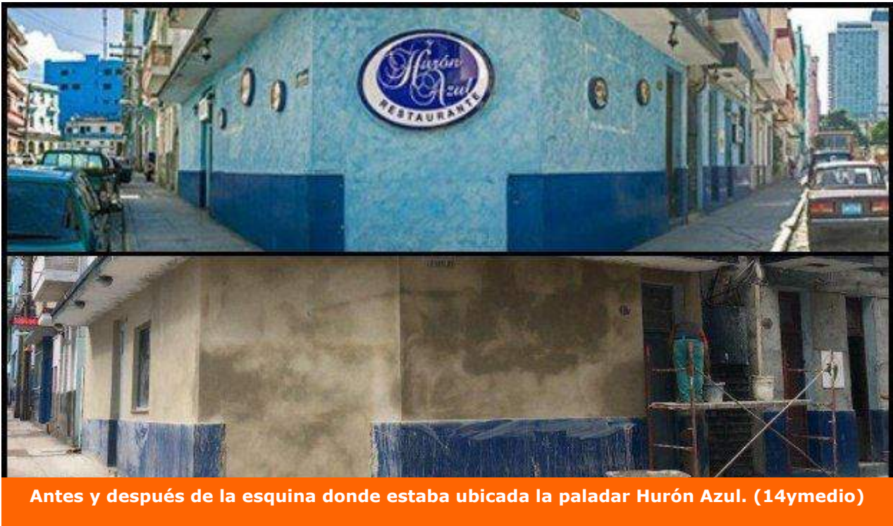
Antes y después de la esquina donde estaba ubicada la paladar Hurón Azul.