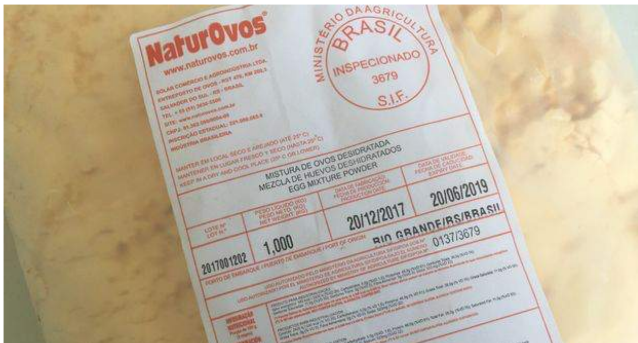
El huevo deshidratado, procedente de Brasil, está siendo de gran ayuda para los negocios de venta de dulces.