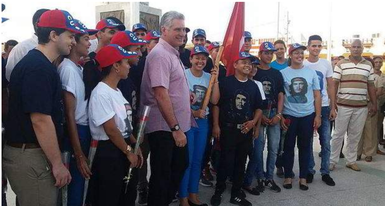
Miguel Díaz-Canel durante un encuentro con los jóvenes en Granma en el que les preguntó si todos tenían internet.