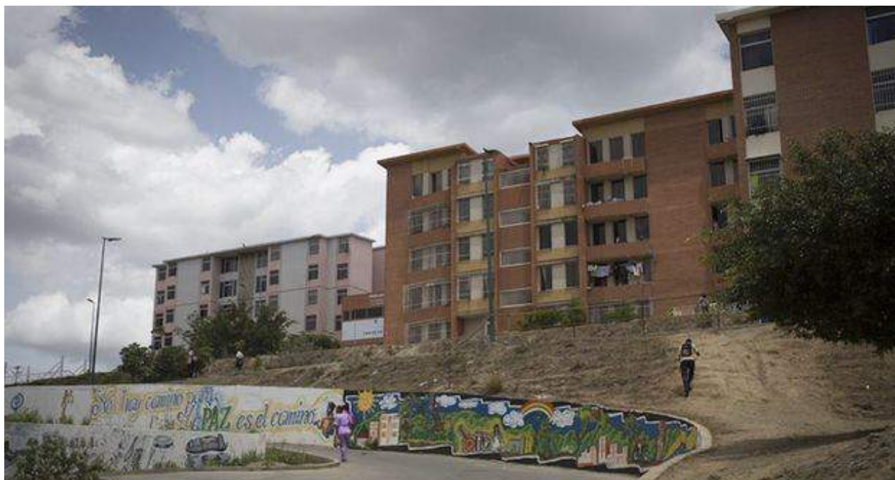
Un complejo de edificios en Ciudad Caribia, a las afueras de Caracas.