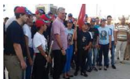
DÍAZ-CANEL, NUEVA IMAGEN Y VIEJO DOGMA