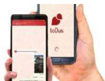
¿QUIÉN VIGILA LA APLICACIÓN DE MENSAJERÍA TODUS?