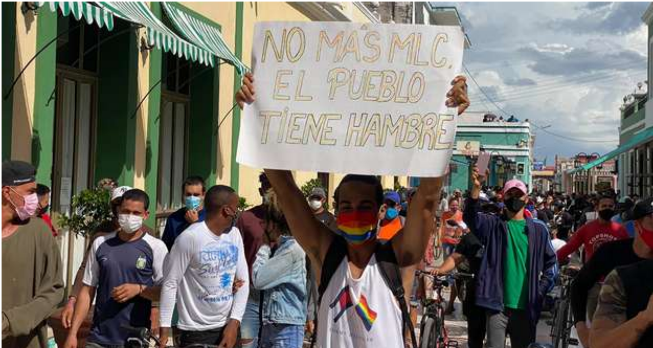
La escasez ha dejado marcas profundas en esta joven generación.