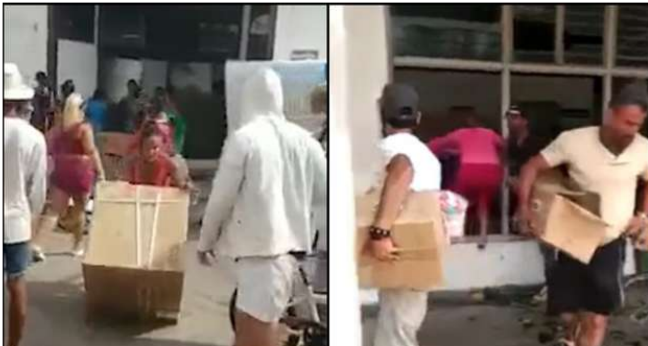
Quienes cargan botellas de refrescos, equipos de climatización, incluso colchones, actúan de forma similar a otros en Santiago de Chile, Quito, Cali o Washington. (Collage)