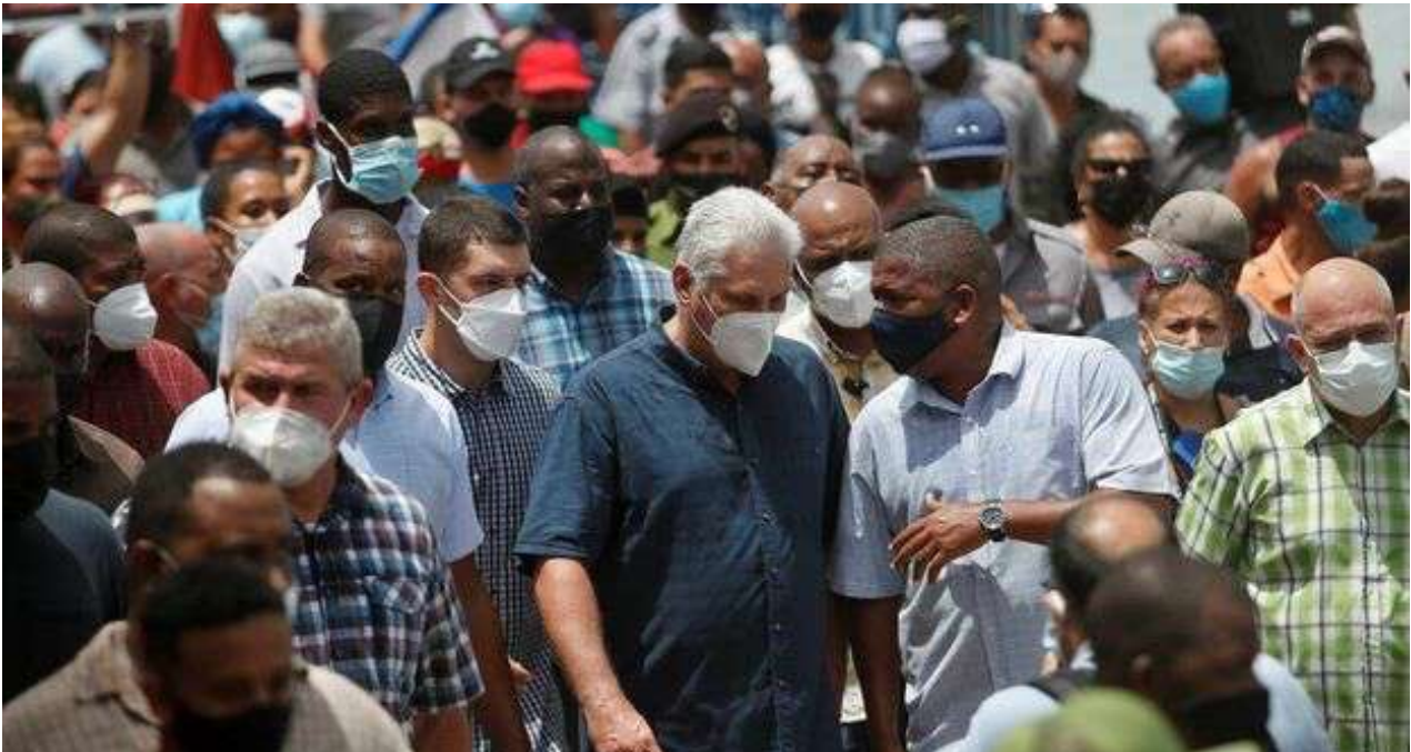
Miguel Díaz-Canel en San Antonio de los Baños, lugar donde se iniciaron las protestas, el pasado 11 de julio.