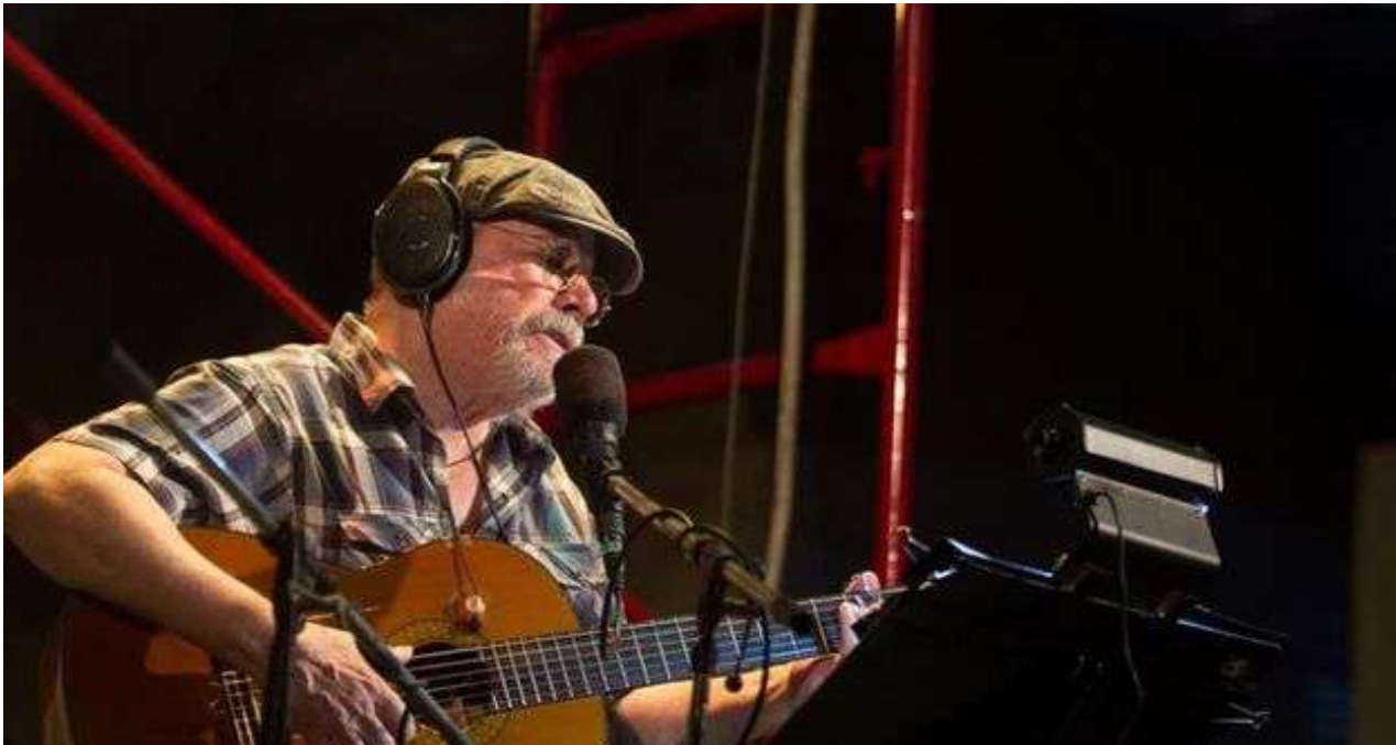
El cantautor oficialista cubano Silvio Rodríguez, en 2019.