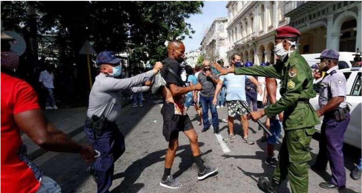
Varios agentes arrestan a un hombre mientras se manifestaba en La Habana, el pasado 11 de julio.