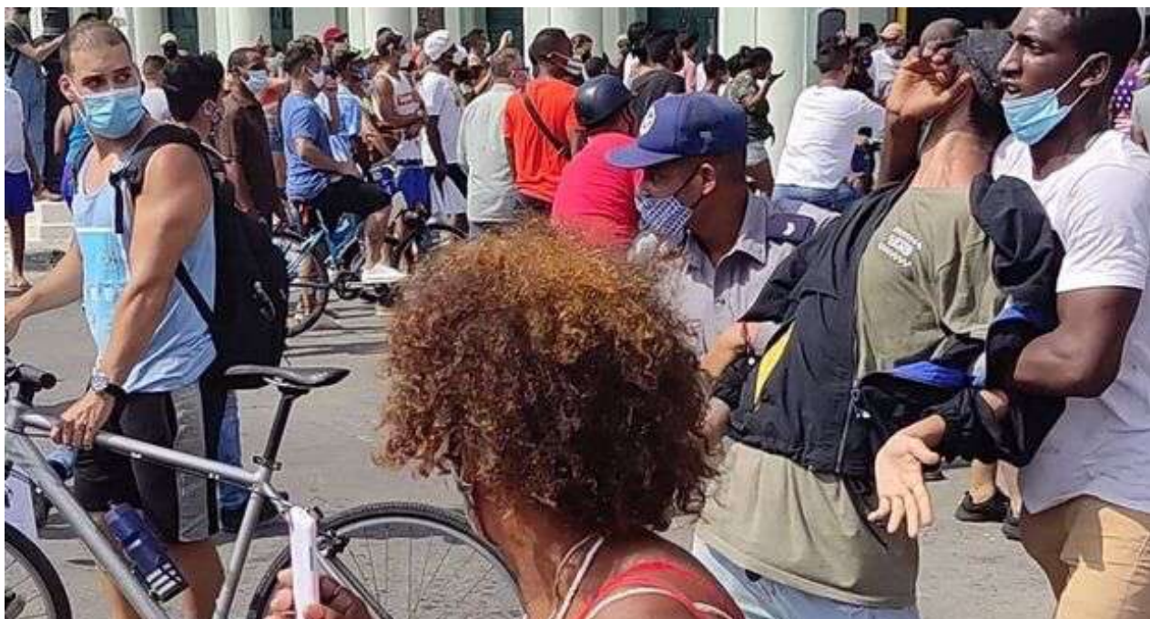
Un manifestante es detenido por un policía y un agente de la Seguridad del Estado vestido de civil, este 11 de julio en La Habana.