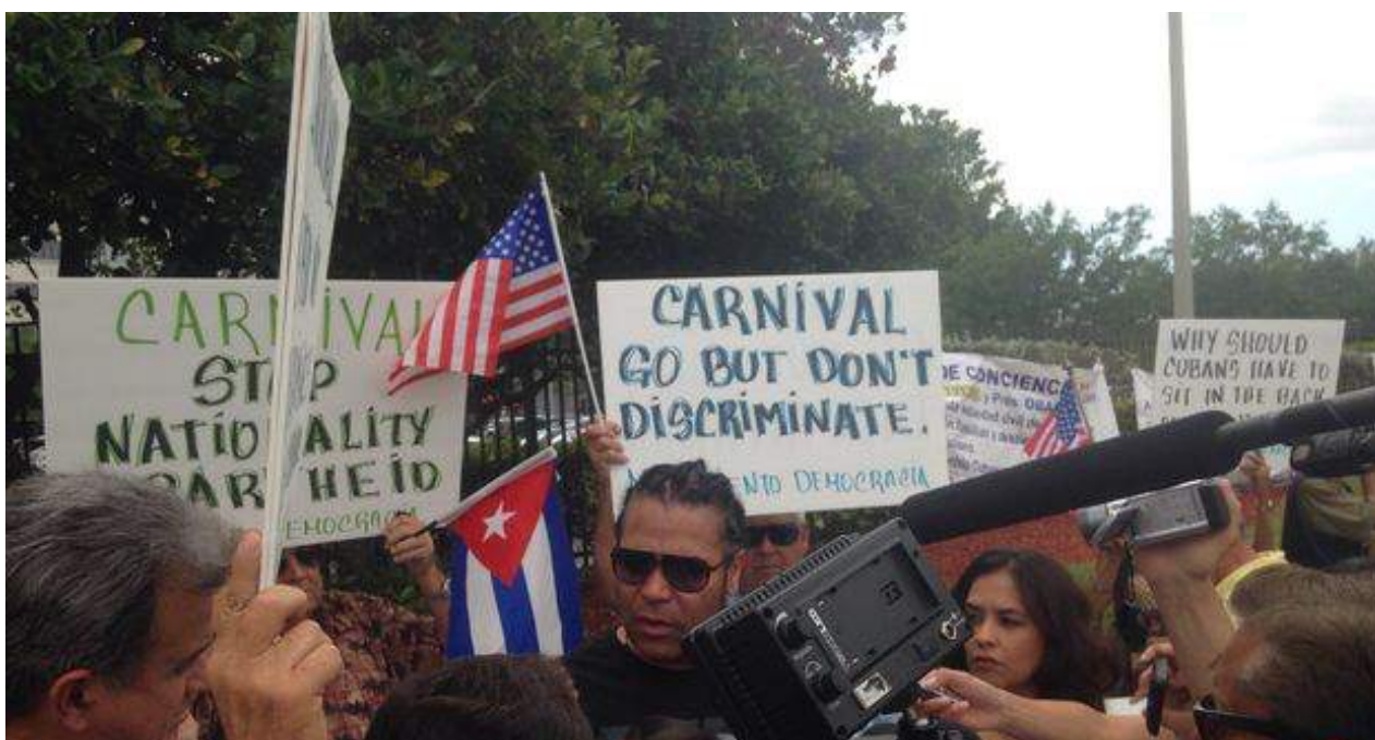
Concentración ante la sede de Carnival.

Una selección con lo mejor de la semana del primer diario independiente hecho en Cuba