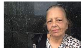
"LA OPOSICIÓN NO HA MADURADO"