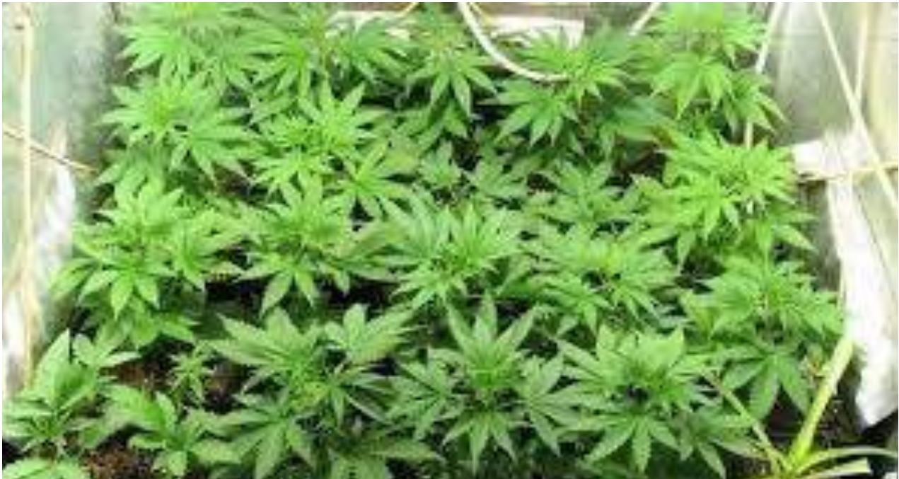
La mayor plantación legal de marihuana en América Latina crece en Chile.