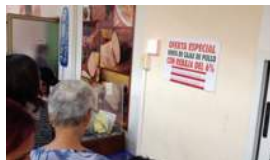
COMENTARIOS "A PIE DE CAJA"