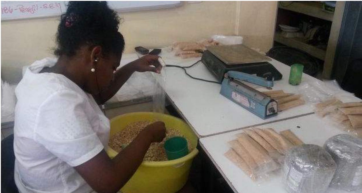
Una empleada selecciona y envasa especias en las Industrias Purita. (14ymedio)