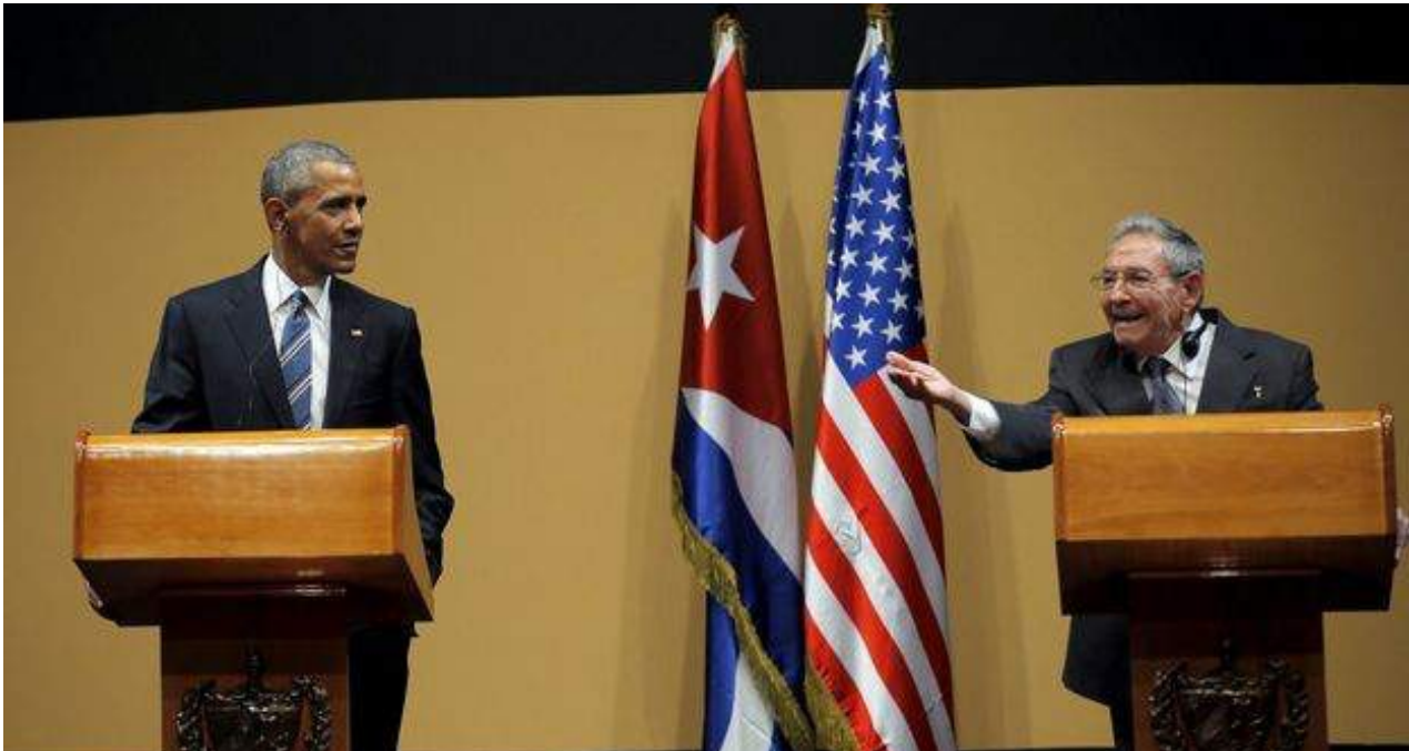
Raúl Castro, en presencia de Barack Obama, increpa a un periodista que le pregunta por los presos políticos en la Isla.