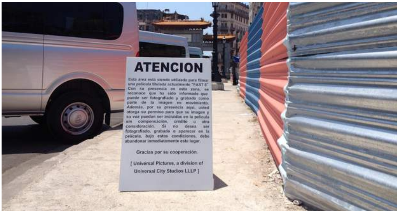
Un cartel advierte de la posibilidad de ser fotografiado y filmado en la zona de rodaje de una película.