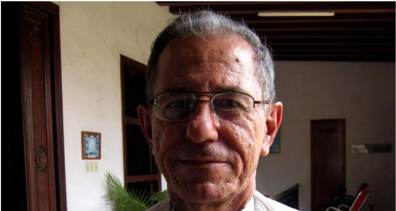
Juan de la Caridad García, nuevo arzobispo de San Cristóbal de Habana.