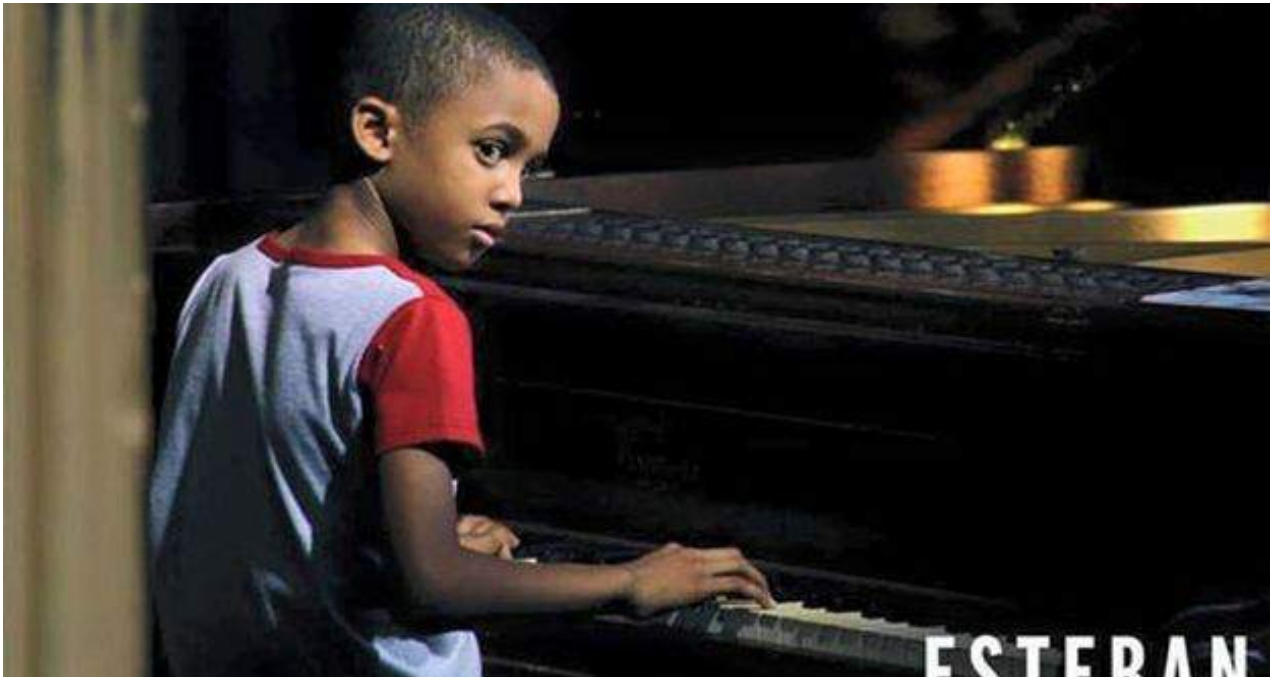
Un fotograma de la película 'Esteban', de Jonal Cosculluela.