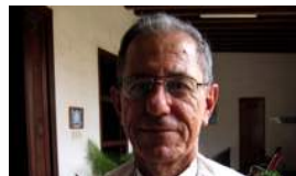
UN 'OBISPO DEL PUEBLO'