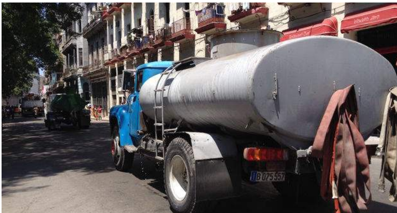
Un camión cisterna reparte agua en las calles de La Habana.