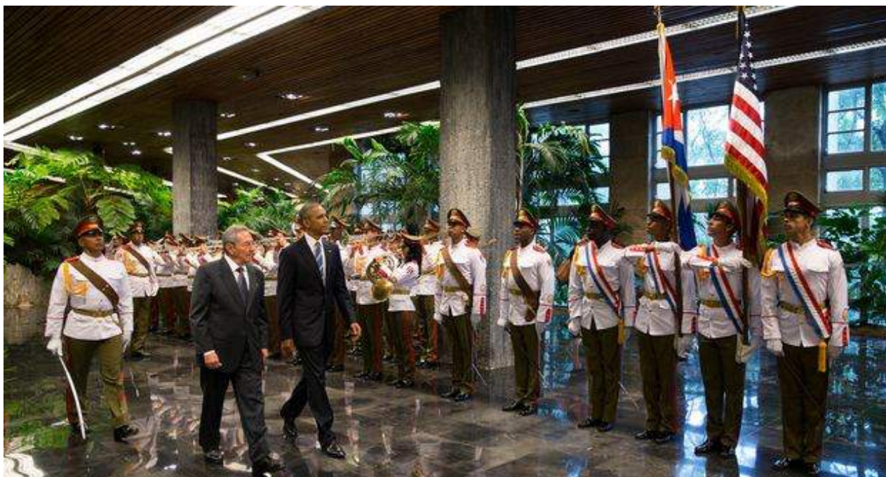
El presidente de EE UU, Barack Obama, y su homólogo cubano, Raúl Castro, en el Palacio de la Revolución de La Habana.