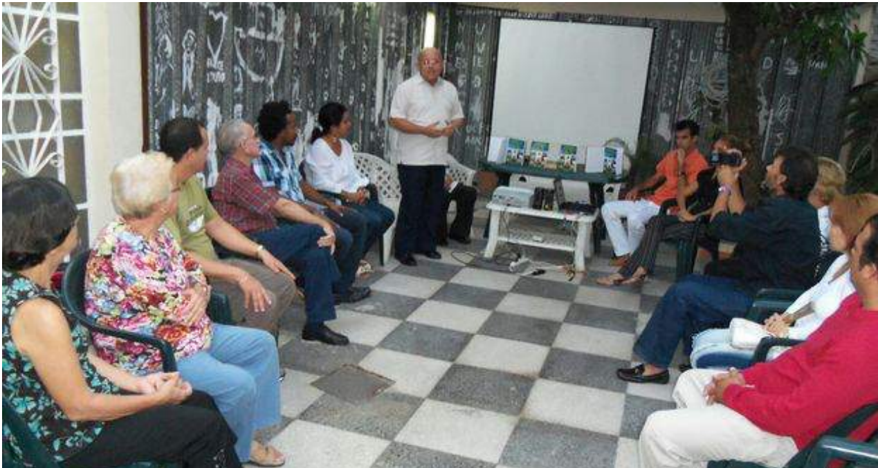
Una tertulia organizada por el equipo del proyecto. (Convivencia)