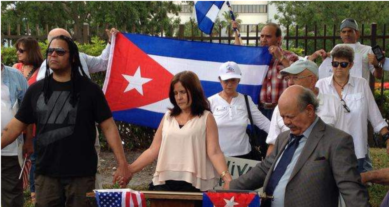
Concentración ante la sede de Carnival.