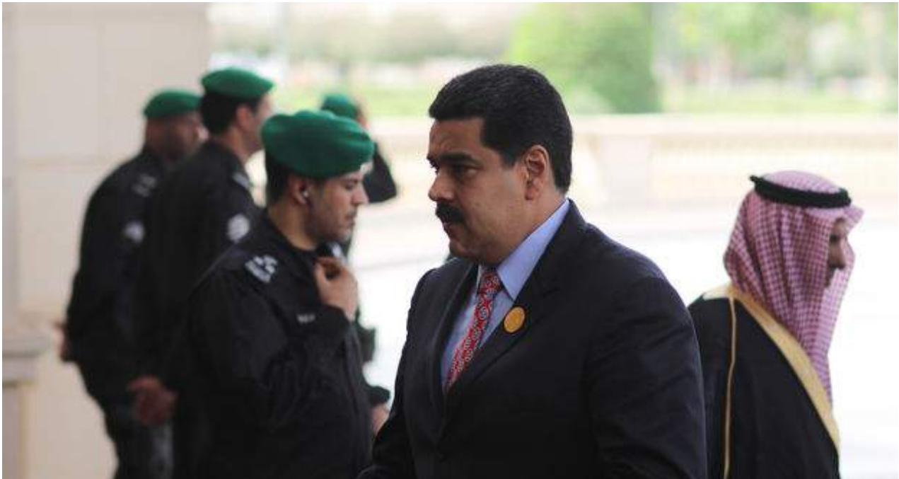
Nicolás Maduro entra a la cumbre de América del Sur y Países Árabes en Riad.