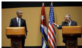
EL LARGO DESMORONAMIENTO