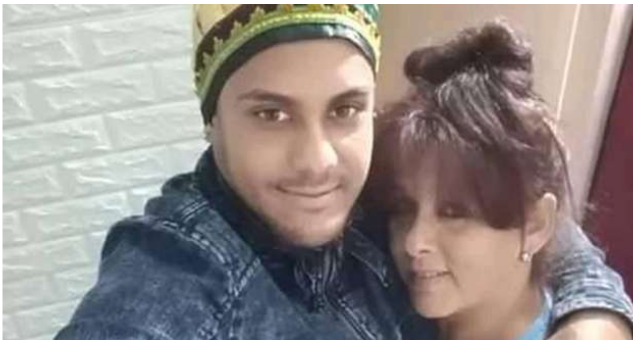
Los migrantes aparentemente murieron cuando intentaban cruzar el río Darién.