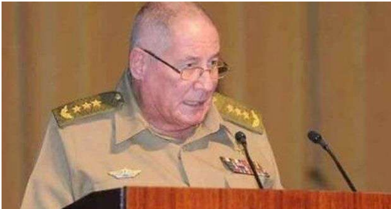
Álvaro López Miera, nuevo ministro de las Fuerzas Armadas.